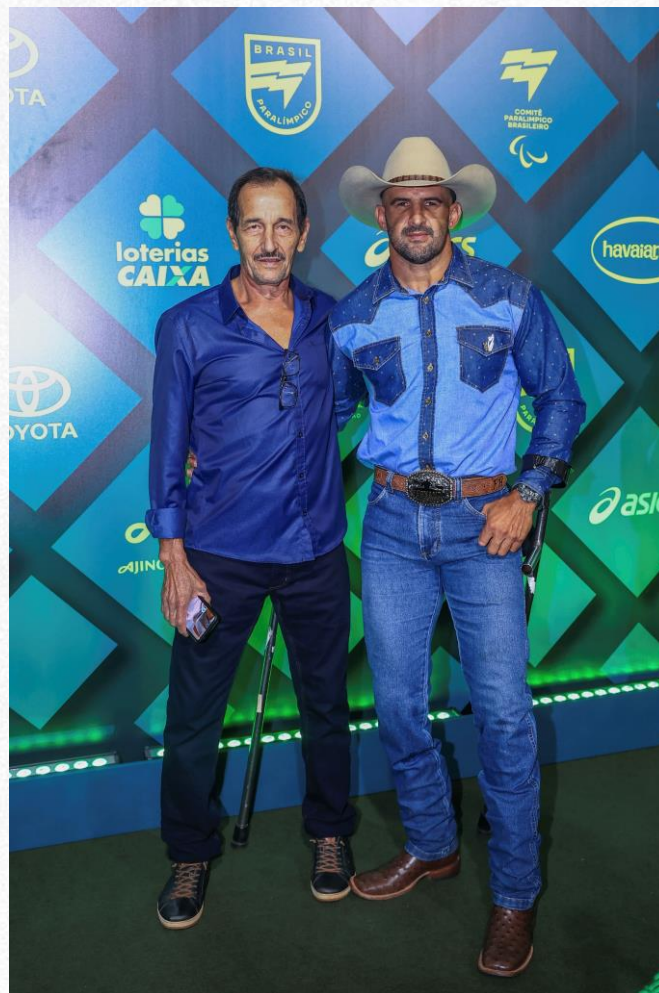
Prêmio Paralímpicos 2024, em São Paulo.