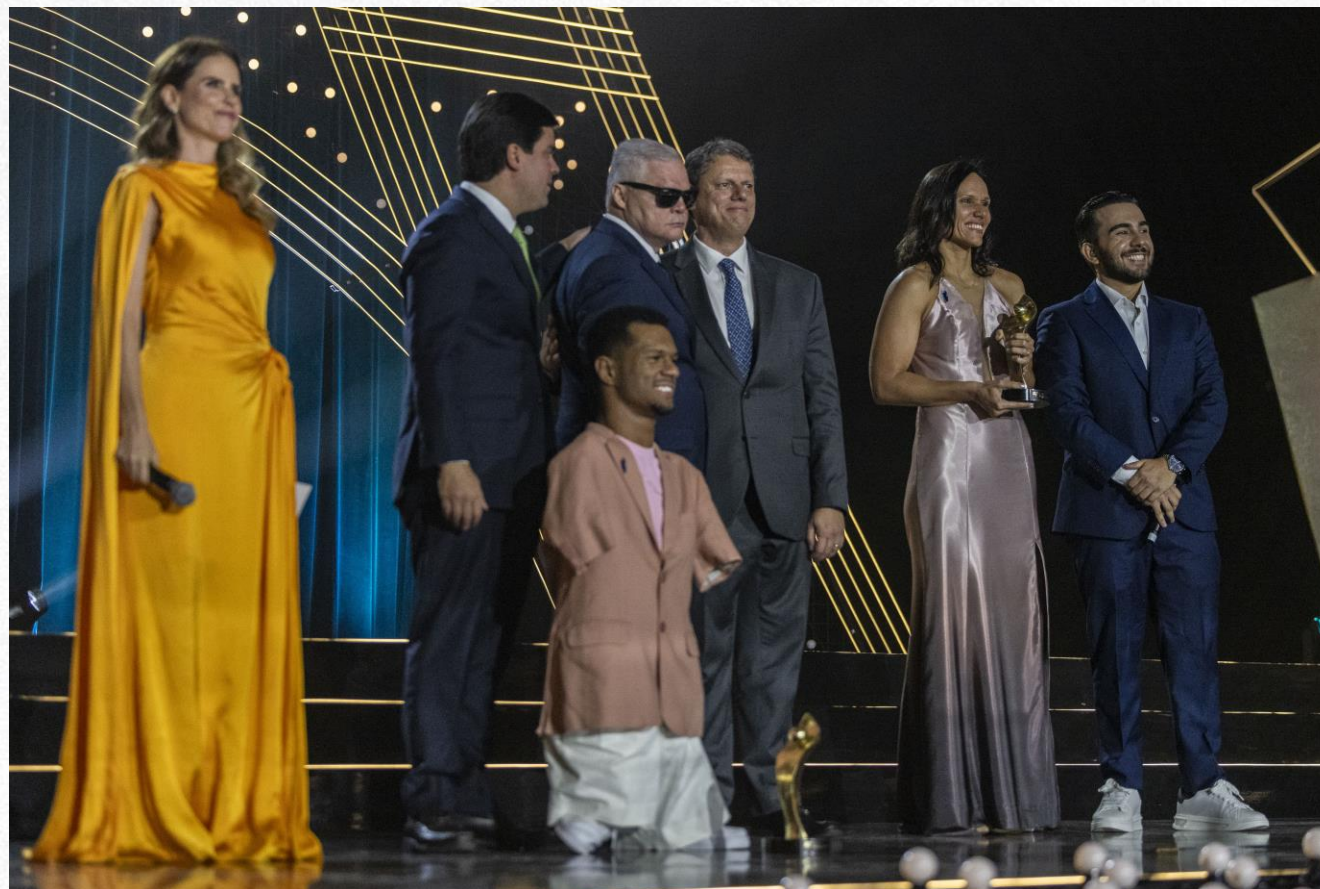
Prêmio Paralímpicos 2024, em São Paulo.