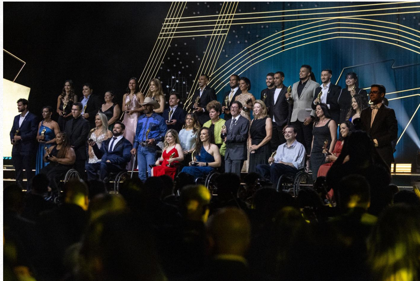
Prêmio Paralímpicos 2024, em São Paulo.