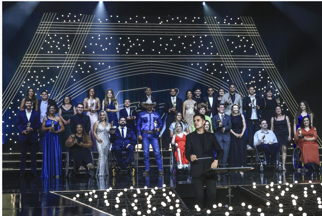
Prêmio Paralímpicos 2024, em São Paulo.