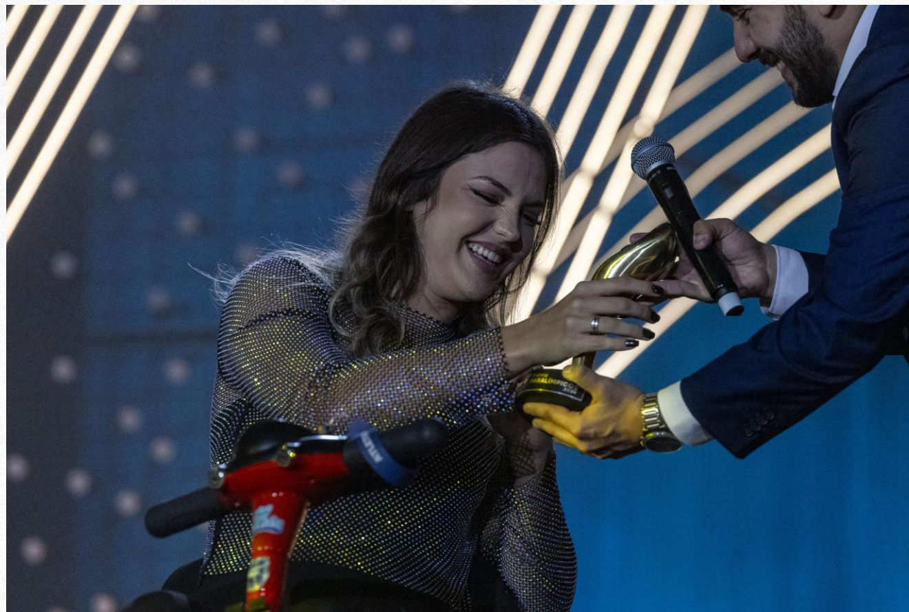
Prêmio Paralímpicos 2024, em São Paulo.