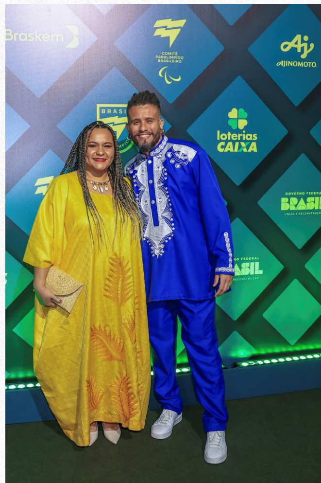
Prêmio Paralímpicos 2024, em São Paulo.