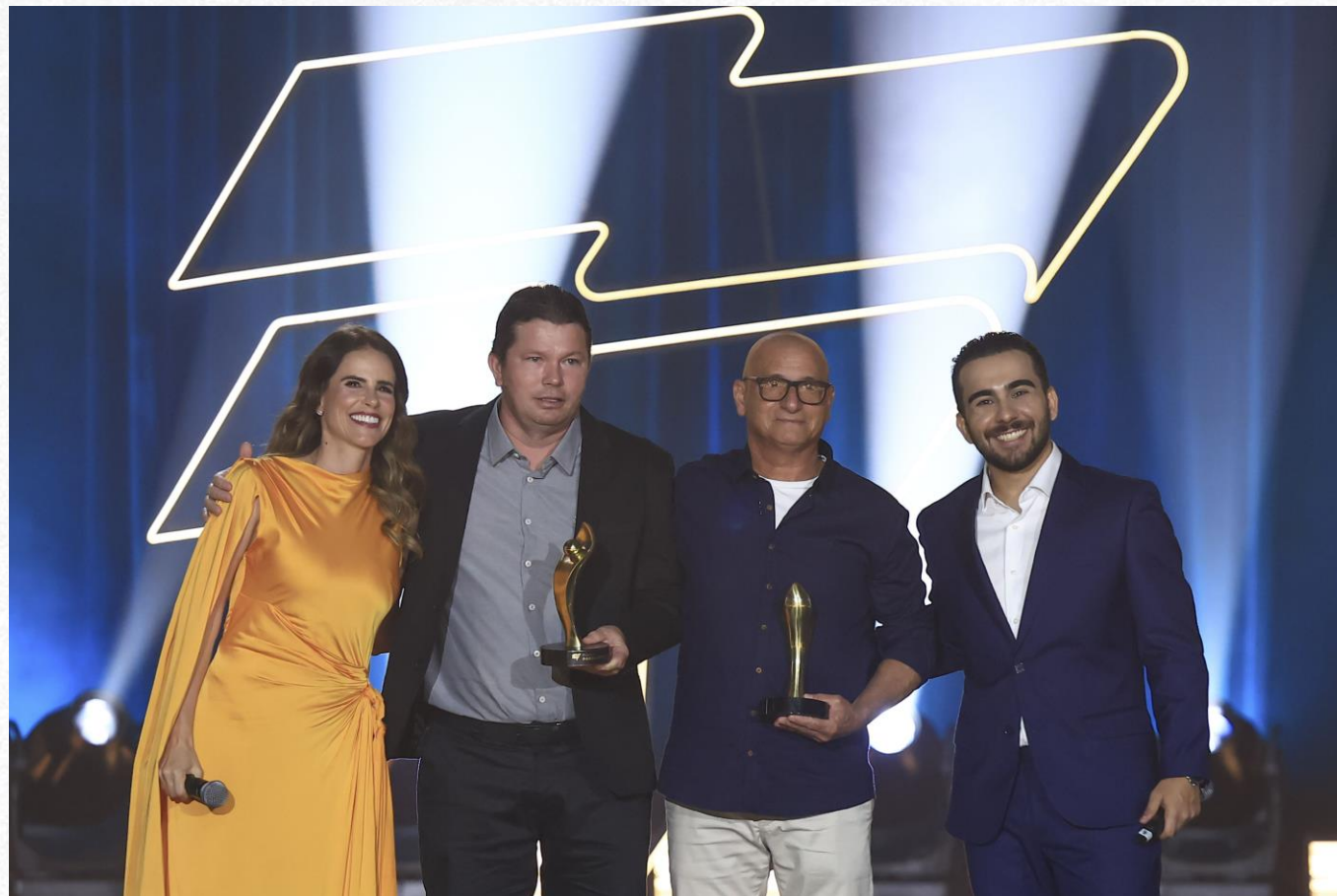
Prêmio Paralímpicos 2024, em São Paulo.