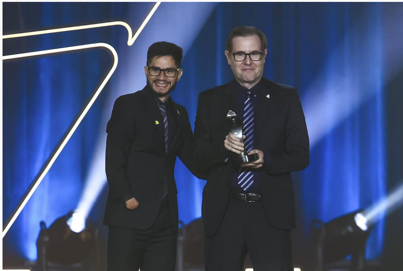
Prêmio Paralímpicos 2024, em São Paulo.