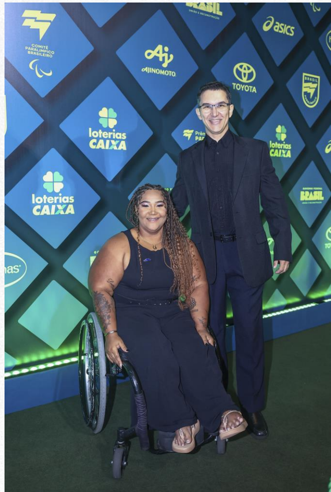
Prêmio Paralímpicos 2024, em São Paulo.