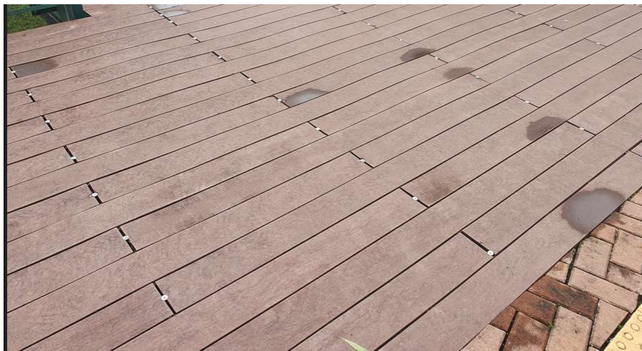
Pontos adicionais de Fixação executados pela equipe de manutenção do CPB

Como medida paliativa, foram acrescentados pontos adicionais de fixação, com a finalidade de garantir a segurança dos usuários da passarela e do Centro de Treinamento.