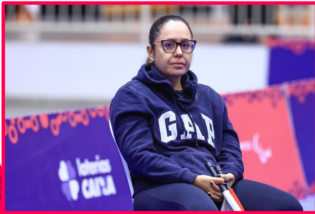
Meeting Paralímpico Loterias Caixa de Halterofilismo em São Paulo.