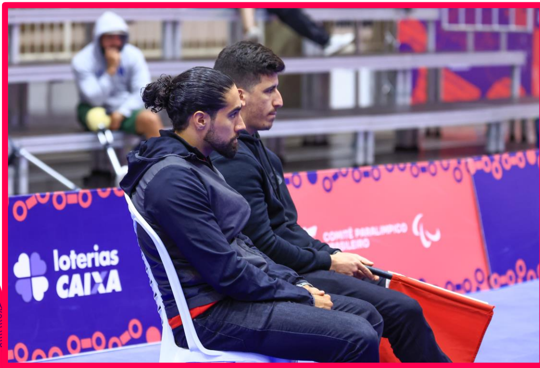
Meeting Paralímpico Loterias Caixa de Halterofilismo em São Paulo.