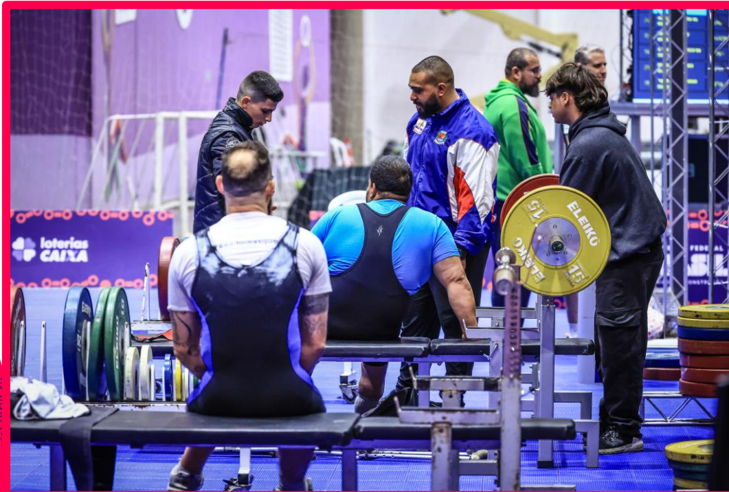
Meeting Paralímpico Loterias Caixa de Halterofilismo em São Paulo.