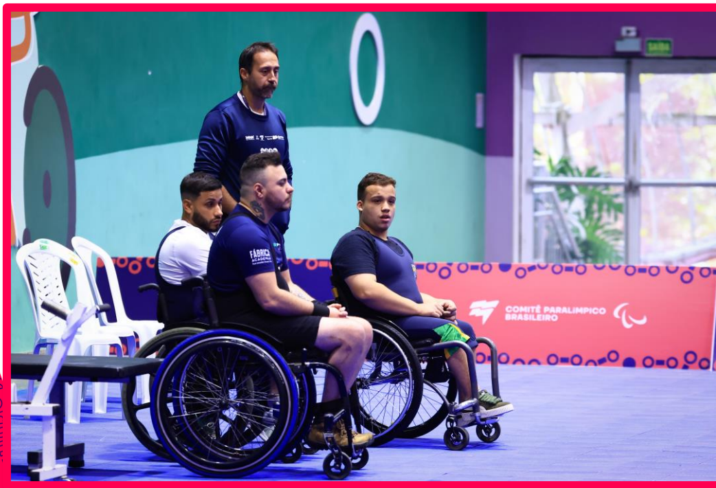
Meeting Paralímpico Loterias Caixa de Halterofilismo em São Paulo.