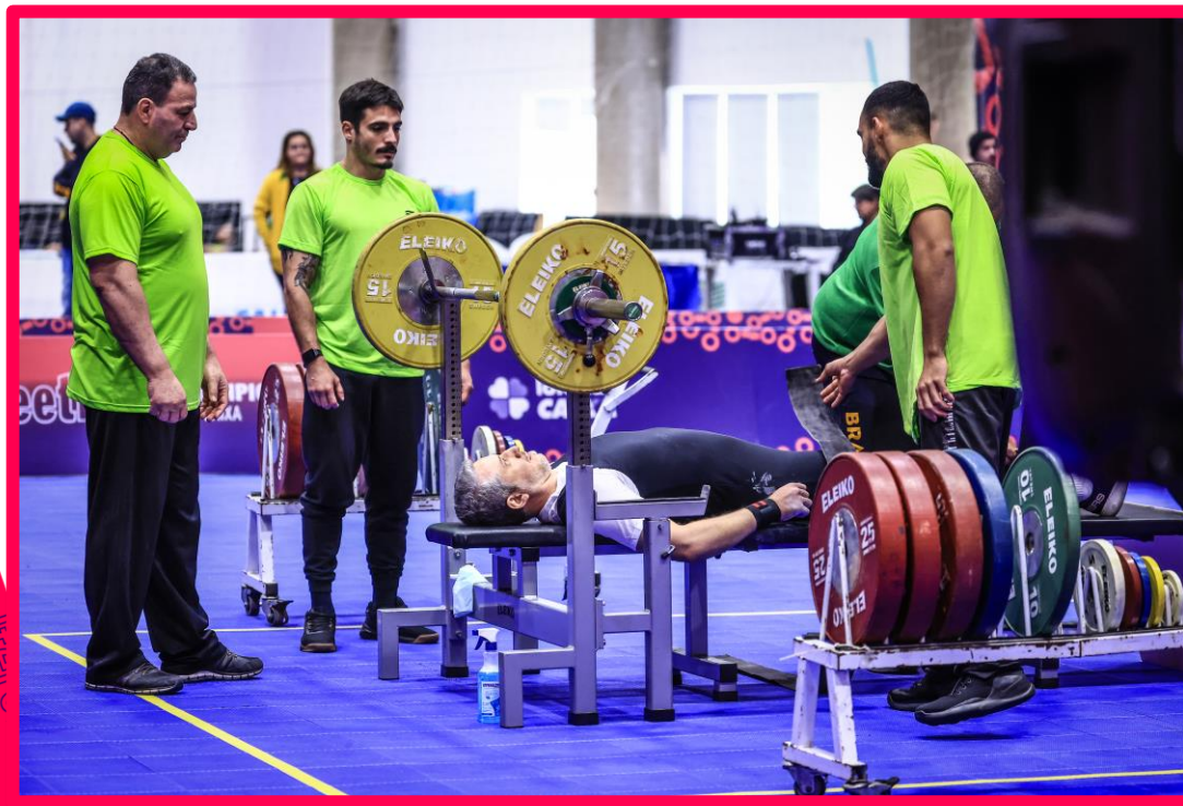
Meeting Paralímpico Loterias Caixa de Halterofilismo em São Paulo.