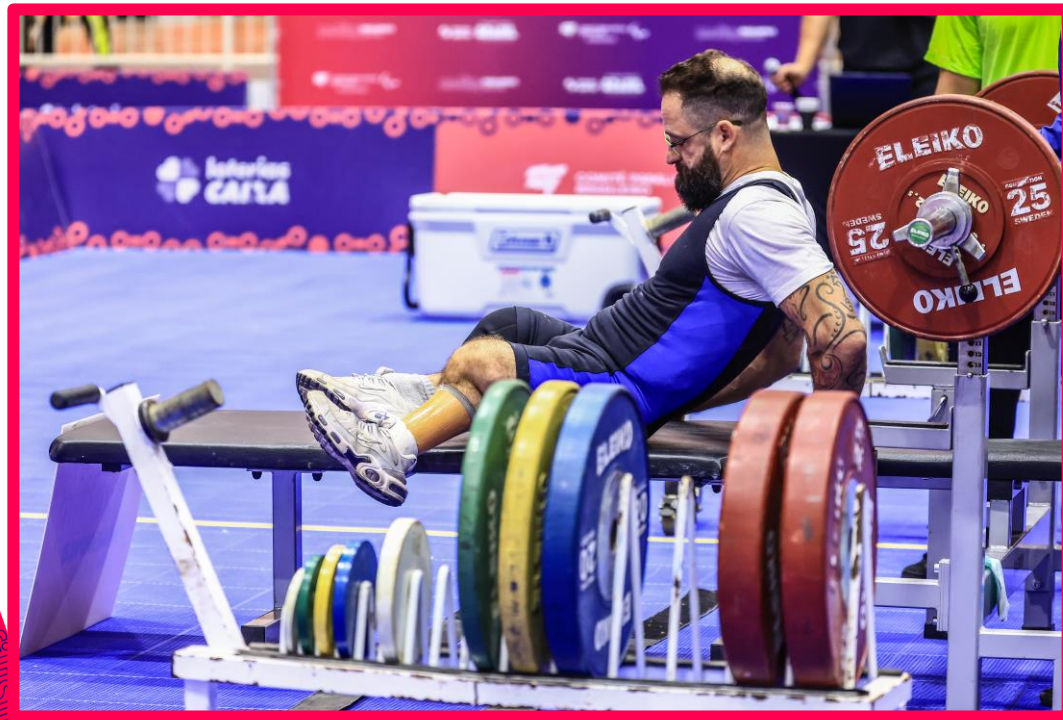
Meeting Paralímpico Loterias Caixa de Halterofilismo em São Paulo.