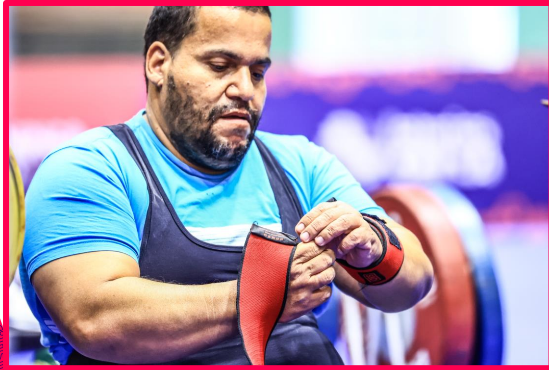
Meeting Paralímpico Loterias Caixa de Halterofilismo em São Paulo.