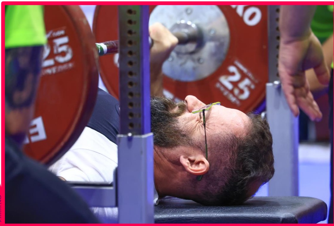
Meeting Paralímpico Loterias Caixa de Halterofilismo em São Paulo.