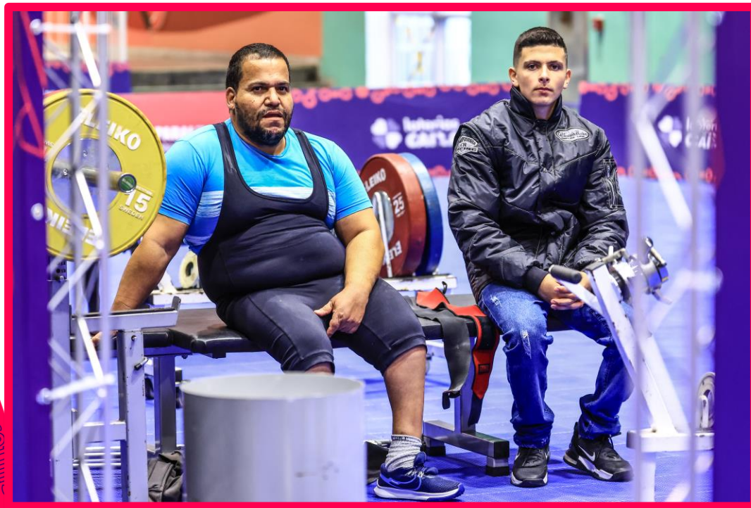
Meeting Paralímpico Loterias Caixa de Halterofilismo em São Paulo.