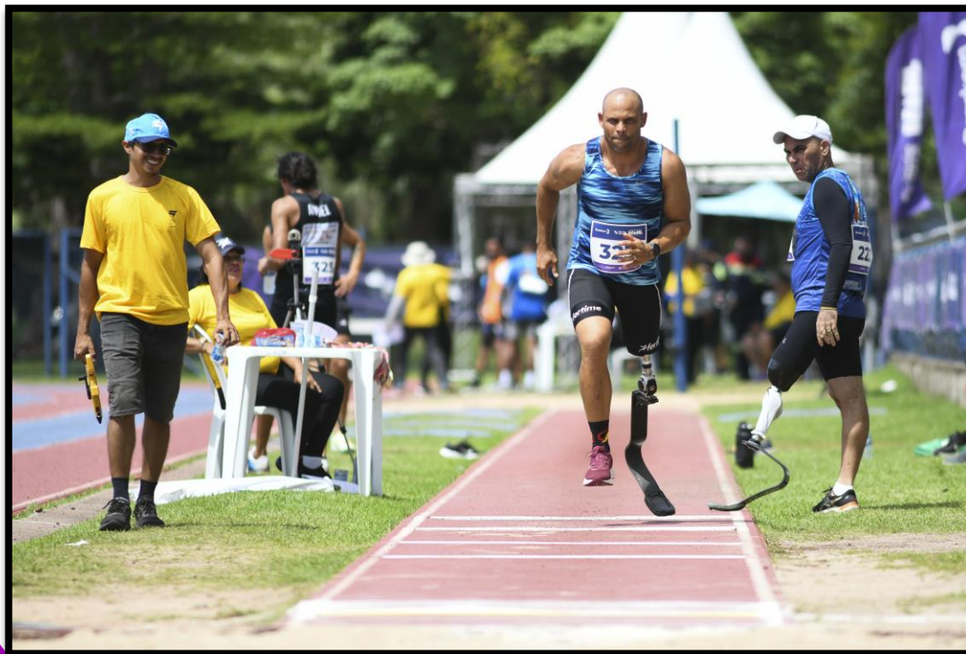
Meeting Paralímpico Loterias Caixa de Fortaleza/CE.