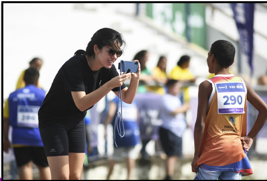
Meeting Paralímpico Loterias Caixa de Fortaleza/CE.