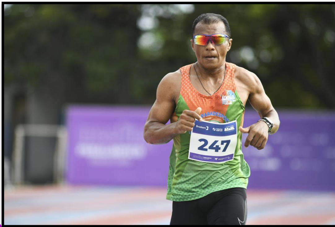
Meeting Paralímpico Loterias Caixa de Fortaleza/CE.