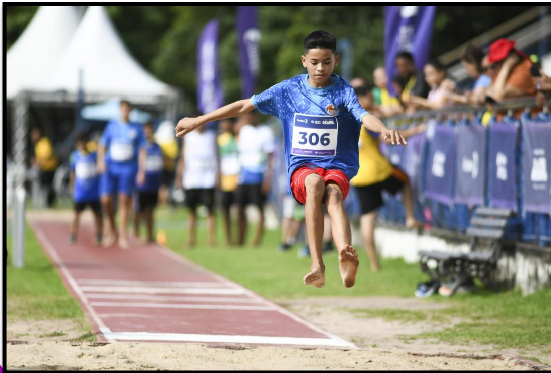
Meeting Paralímpico Loterias Caixa de Fortaleza/CE.