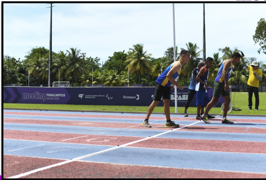
Meeting Paralímpico Loterias Caixa de Fortaleza/CE.