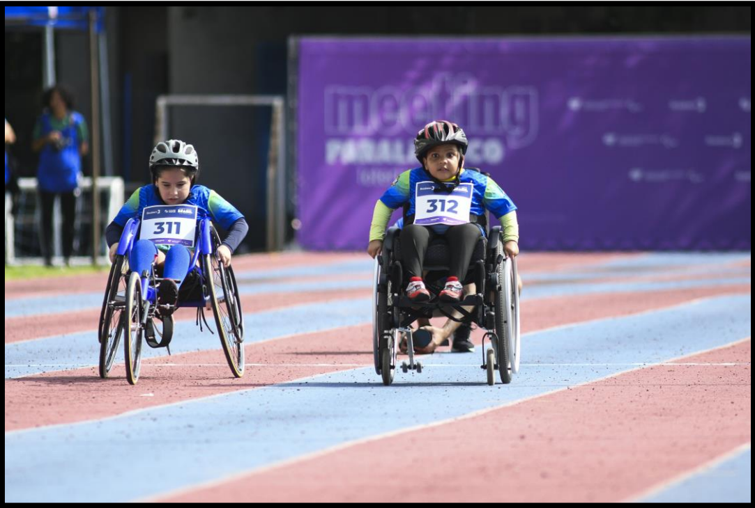
Meeting Paralímpico Loterias Caixa de Fortaleza/CE.