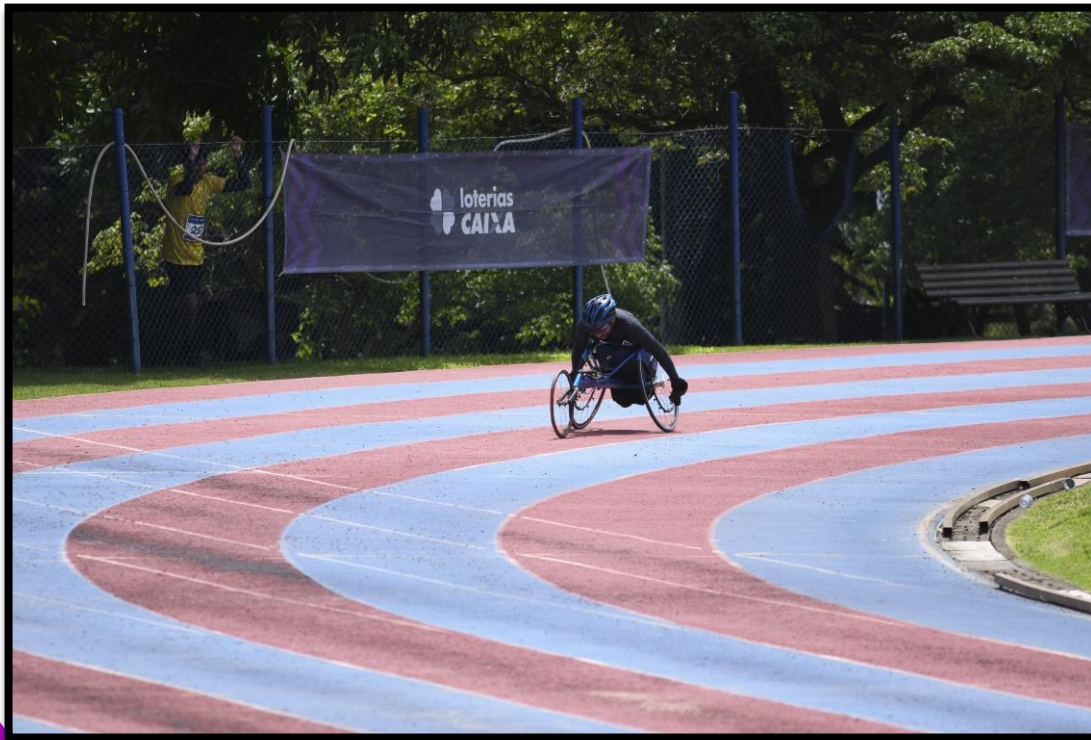
Meeting Paralímpico Loterias Caixa de Fortaleza/CE.