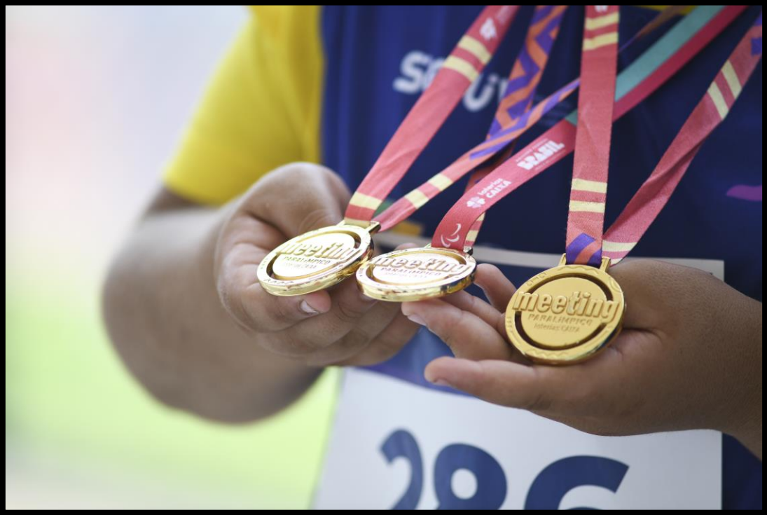
Meeting Paralímpico Loterias Caixa de Fortaleza/CE.