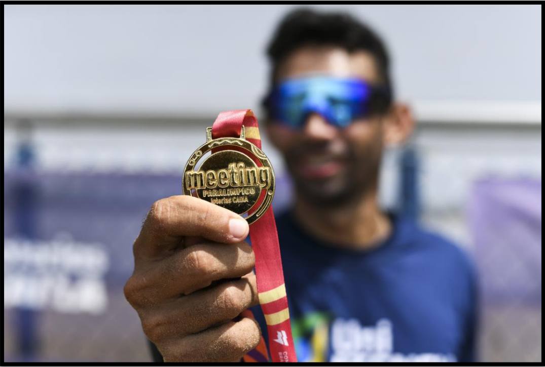
Meeting Paralímpico Loterias Caixa de Fortaleza/CE.