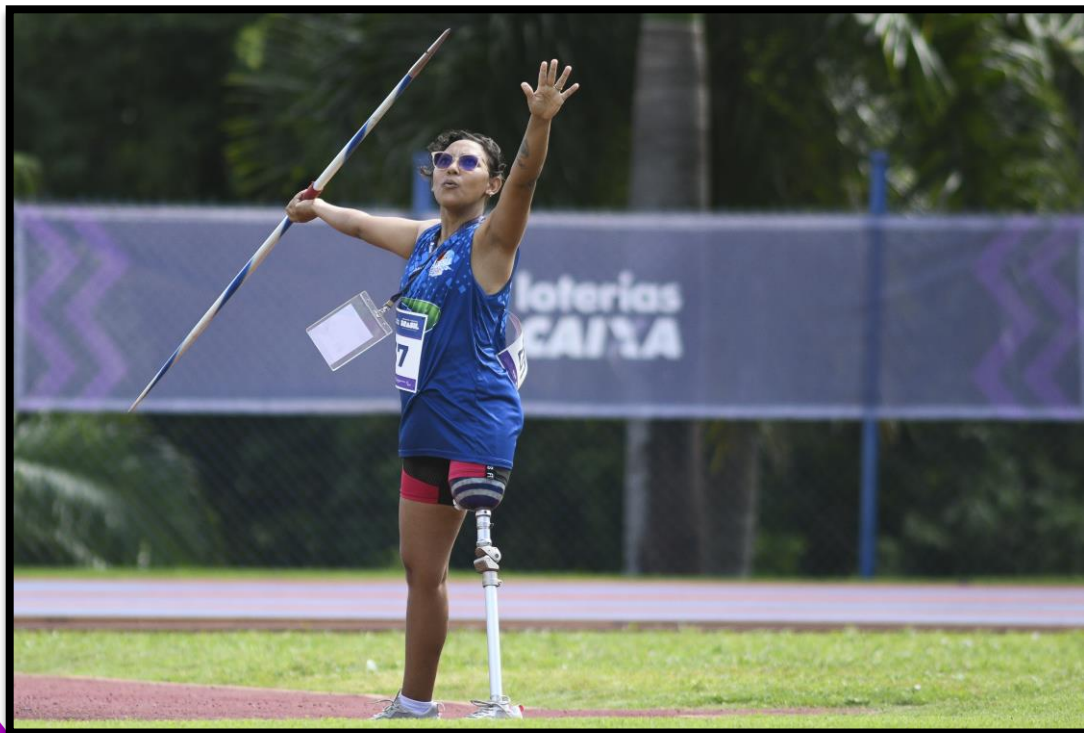
Meeting Paralímpico Loterias Caixa de Fortaleza/CE.