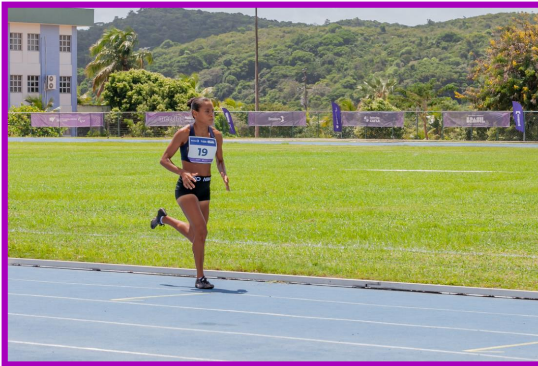
Meeting Paralímpico Loterias Caixa de Atletismo em Natal.