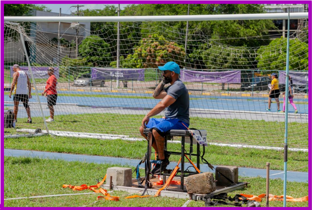
Meeting Paralímpico Loterias Caixa de Atletismo em Natal.