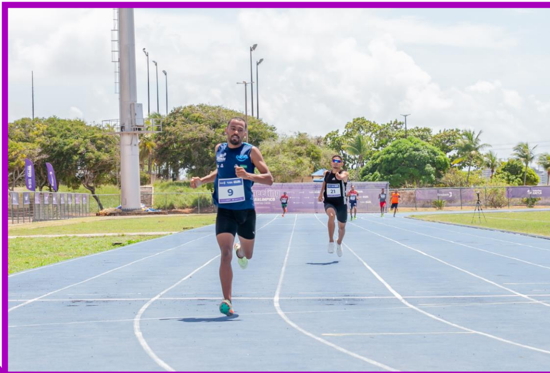
Meeting Paralímpico Loterias Caixa de Atletismo em Natal.