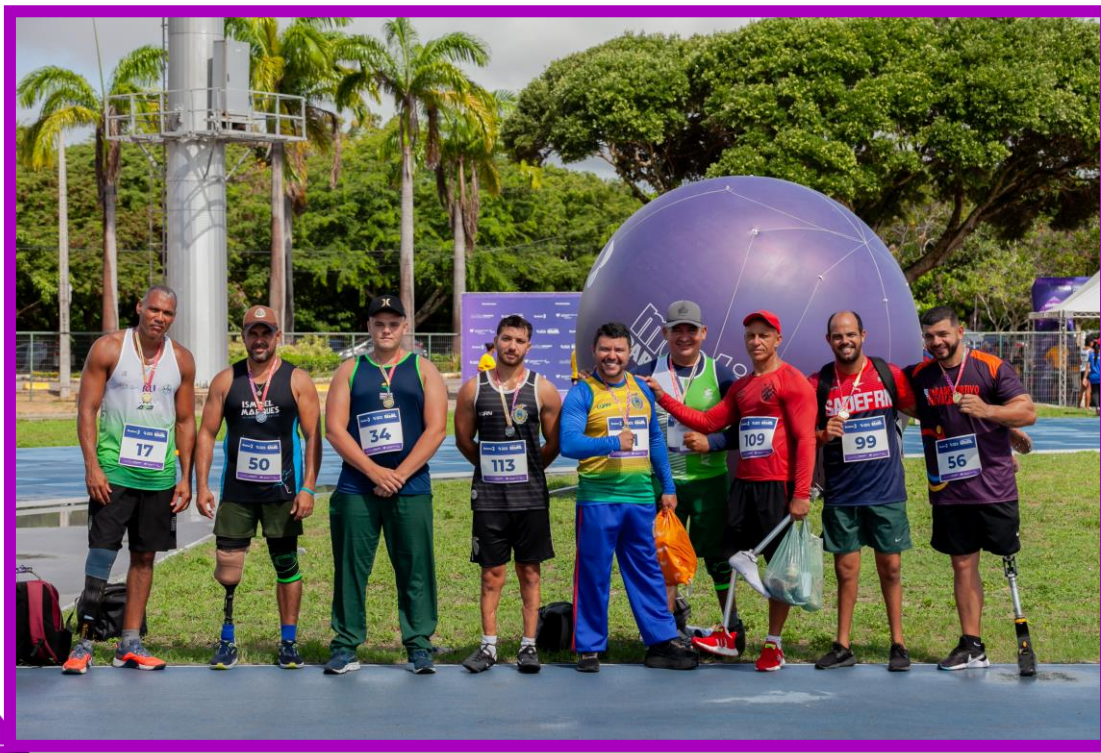
Meeting Paralímpico Loterias Caixa de Atletismo em Natal.