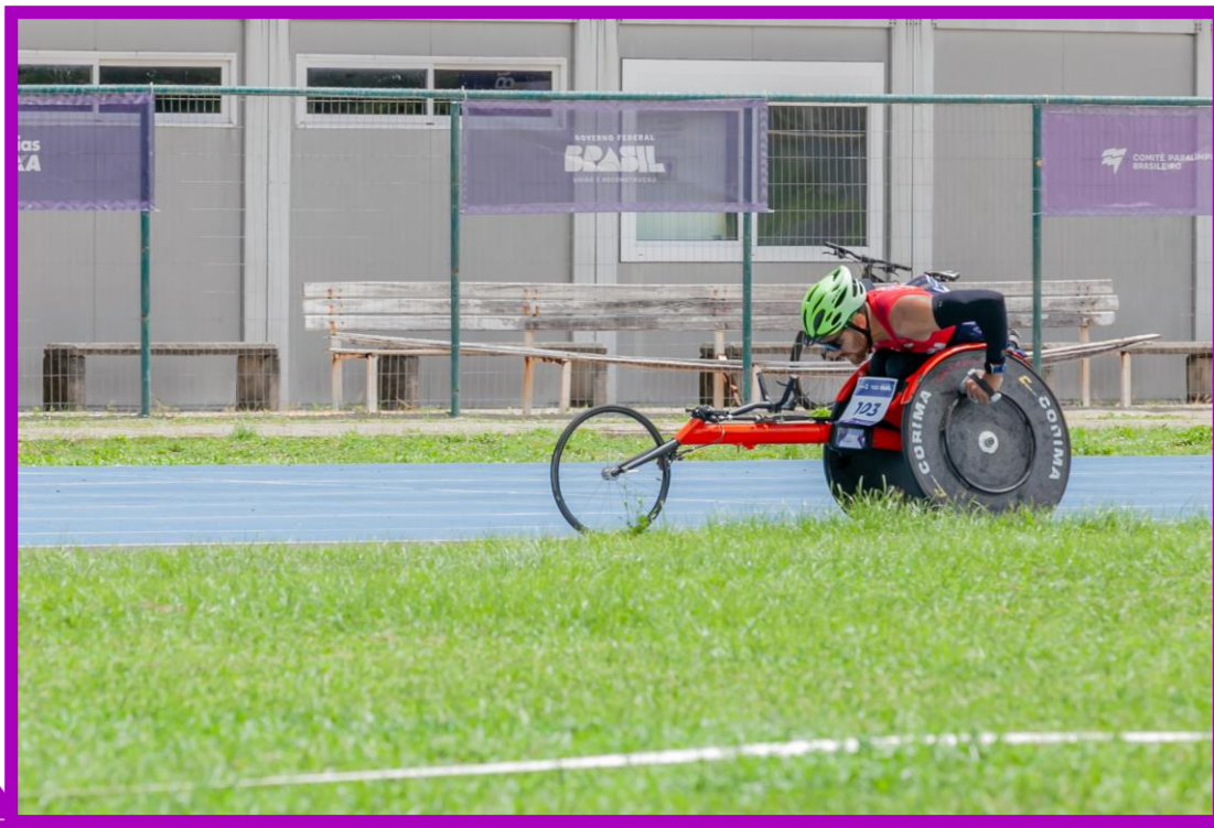
Meeting Paralímpico Loterias Caixa de Atletismo em Natal.