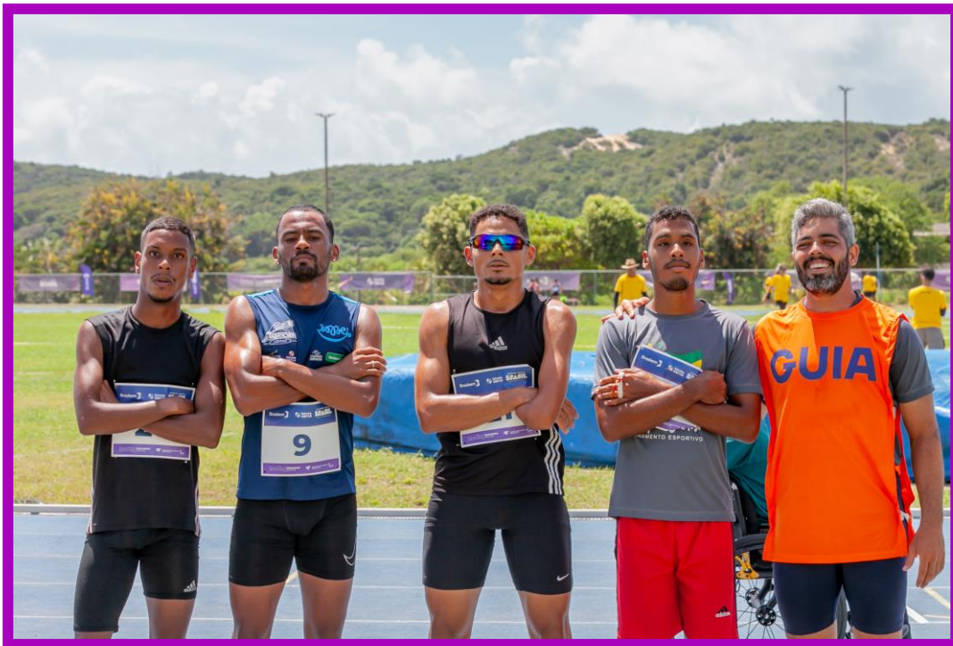
Meeting Paralímpico Loterias Caixa de Atletismo em Natal.