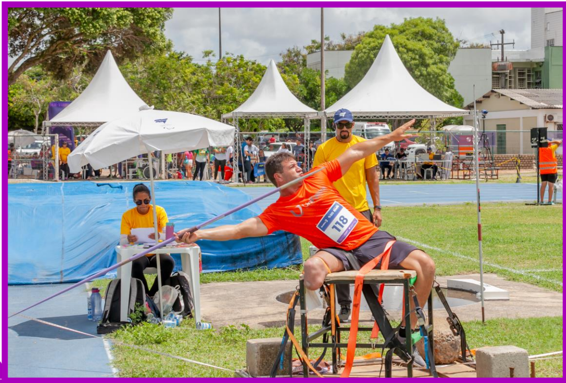
Meeting Paralímpico Loterias Caixa de Atletismo em Natal.