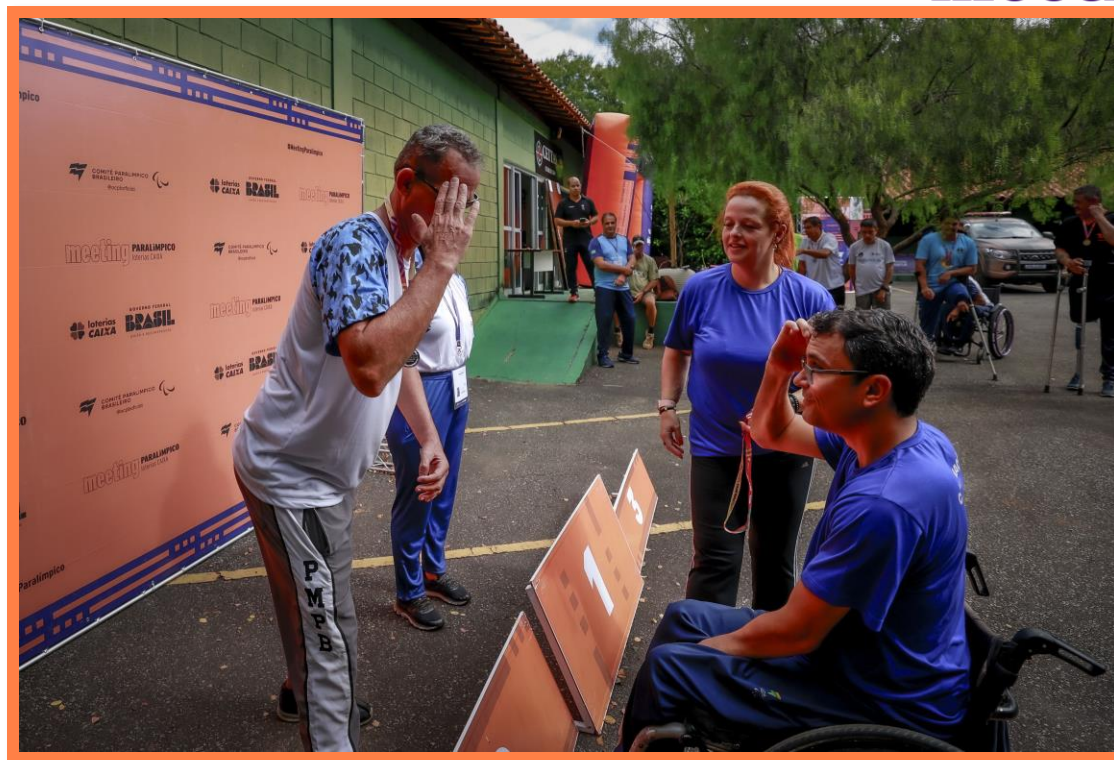
Meeting Paralympic Loterias Caixa de Tiro Esportivo em Belo Horizonte, MG.