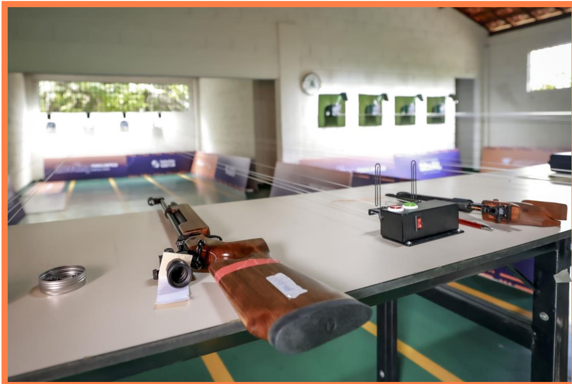
Meeting Paralímpico Loterias Caixa de Tiro Esportivo em Belo Horizonte, MG.