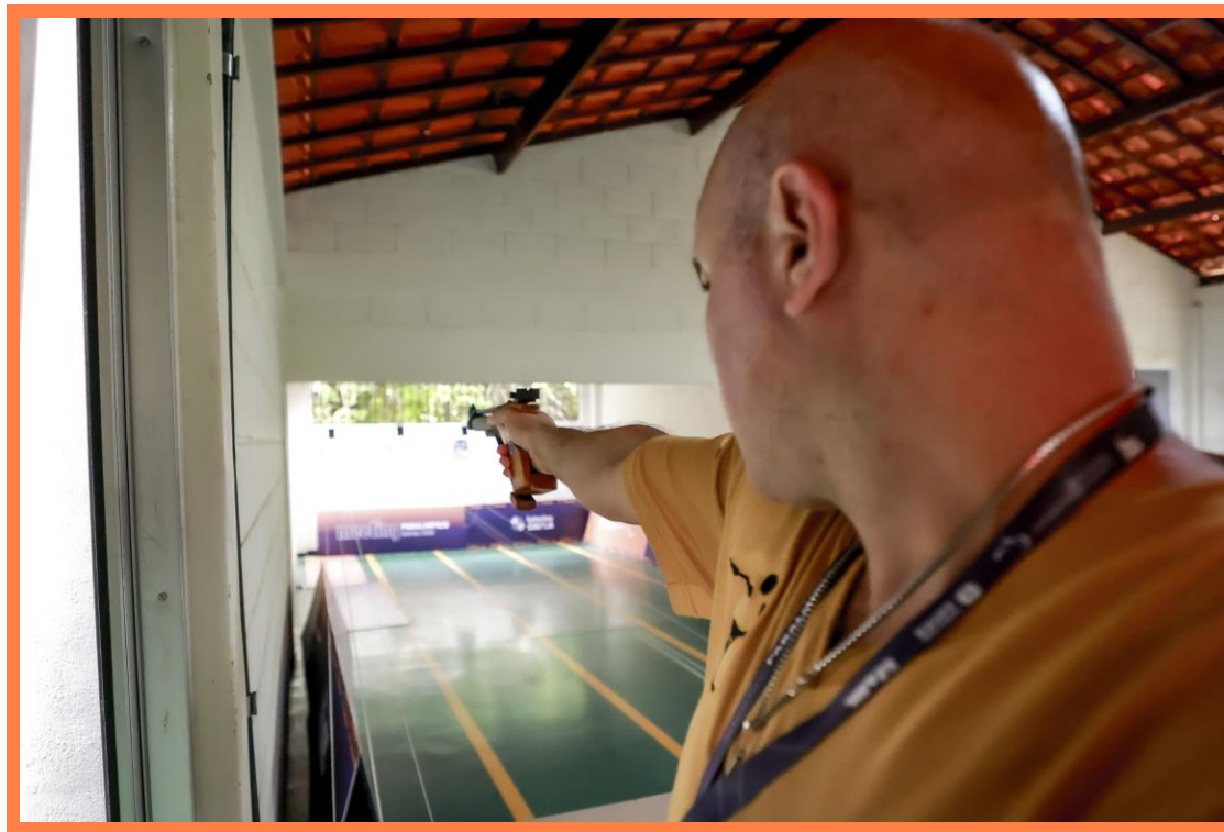
Meeting Paralímpico Loterias Caixa de Tiro Esportivo em Belo Horizonte, MG.