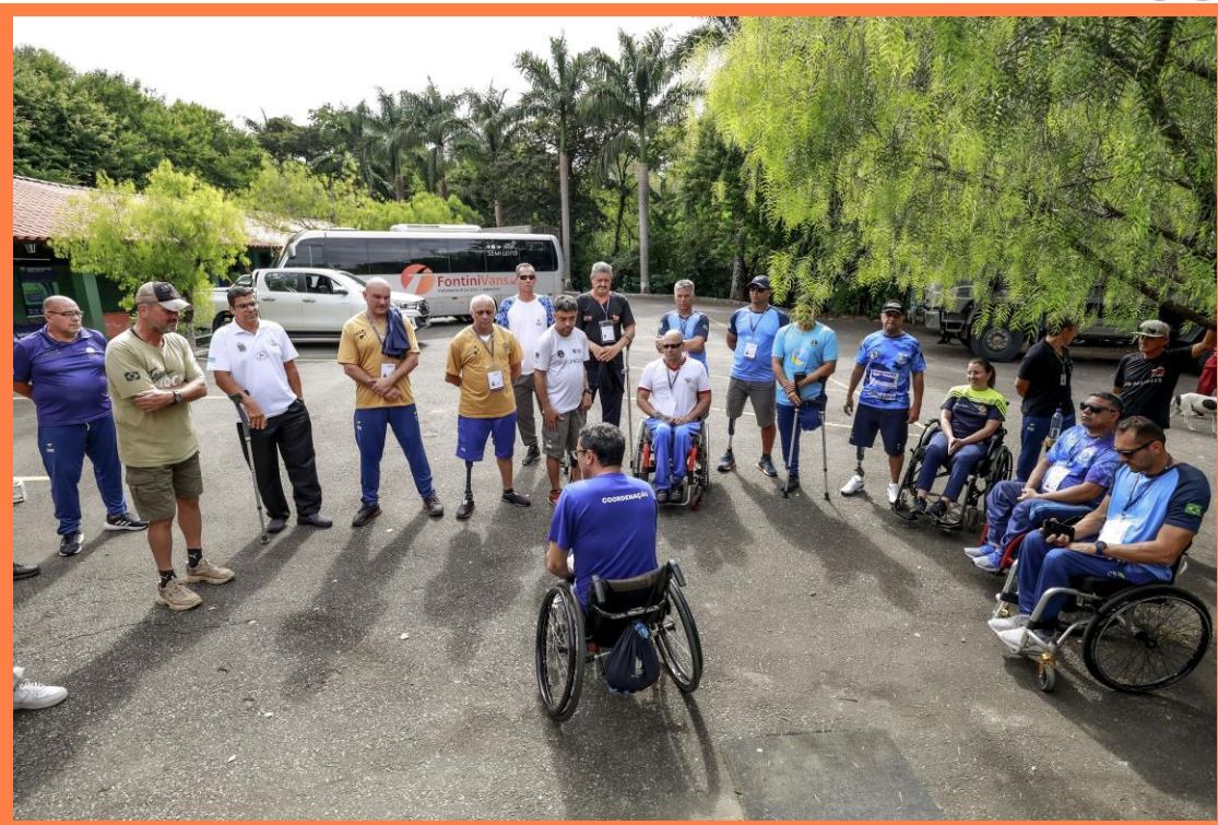
Meeting Paralímpico Loterias Caixa de Tiro Esportivo em Belo Horizonte, MG.