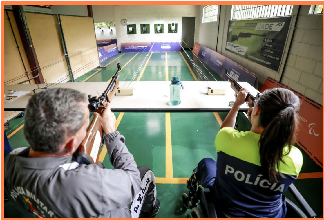
Meeting Paralímpico Loterias Caixa de Tiro Esportivo em Belo Horizonte, MG.