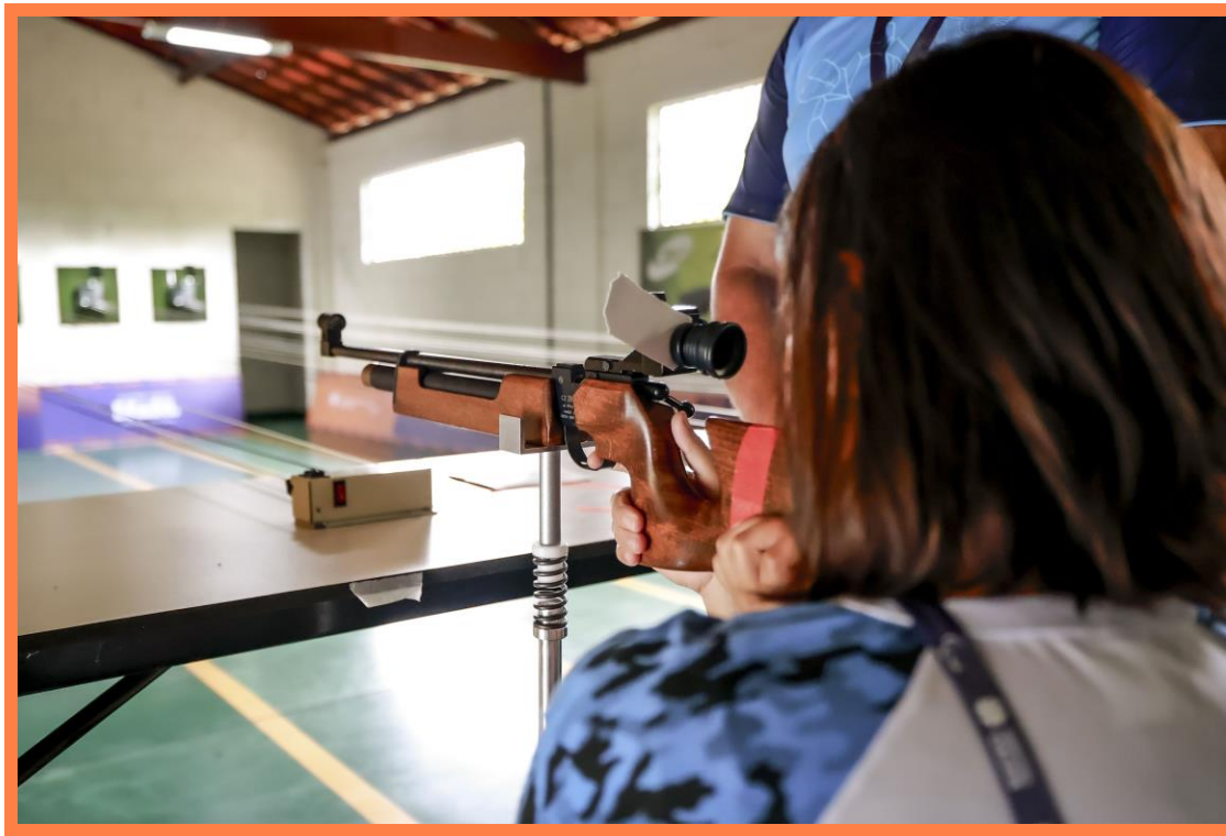
Meeting Paralímpico Loterias Caixa de Tiro Esportivo em Belo Horizonte, MG.