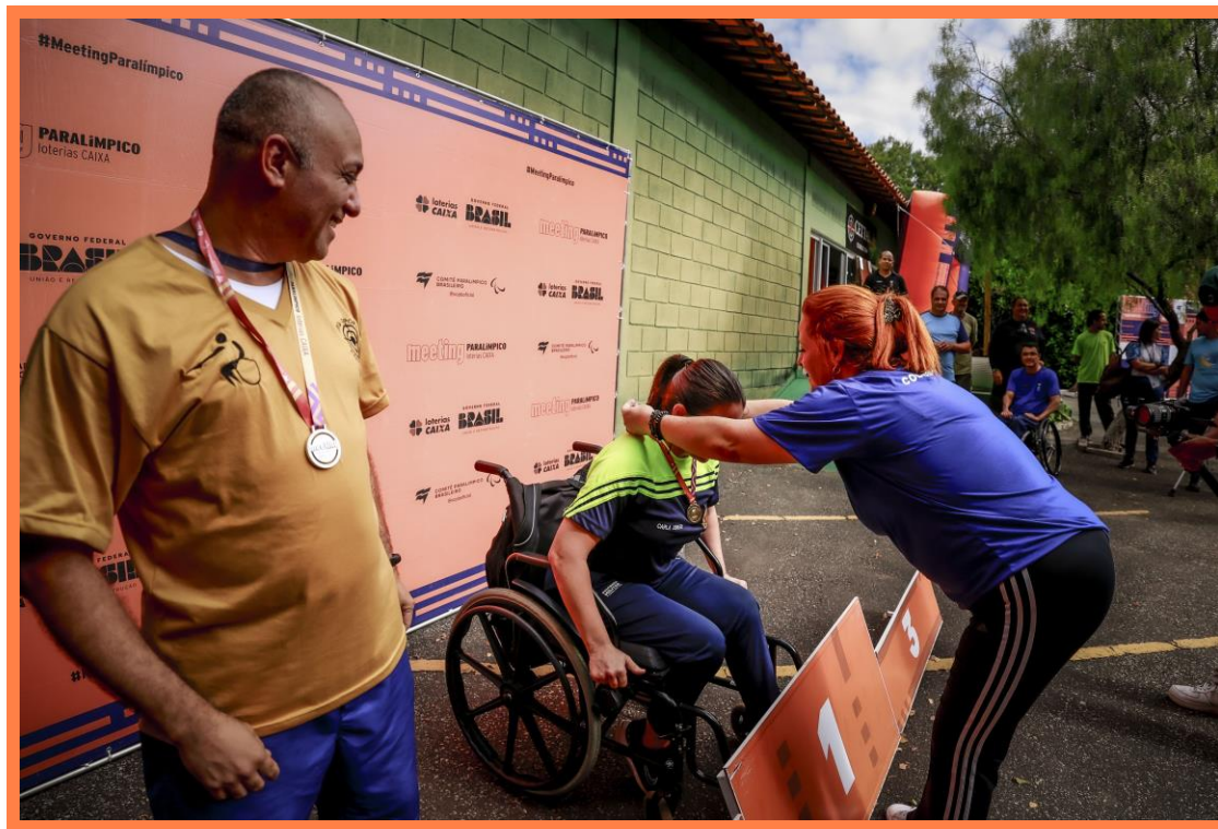
Meeting Paralímpico Loterias Caixa de Tiro Esportivo em Belo Horizonte, MG.