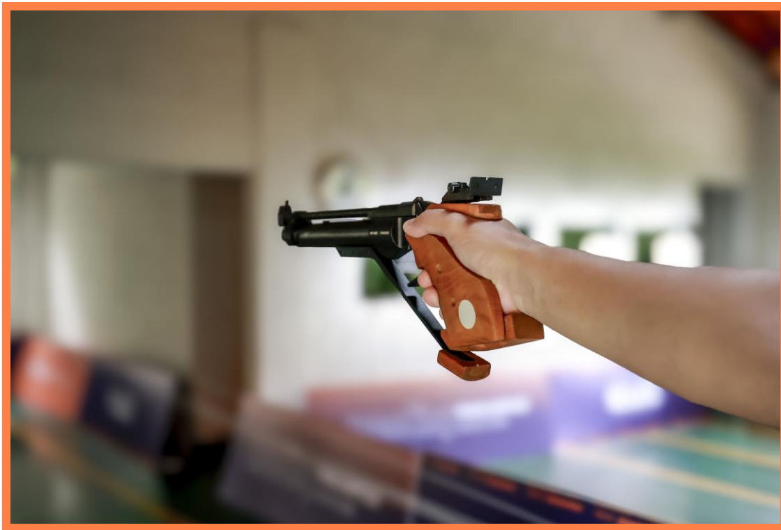
Meeting Paralímpico Loterias Caixa de Tiro Esportivo em Belo Horizonte, MG.