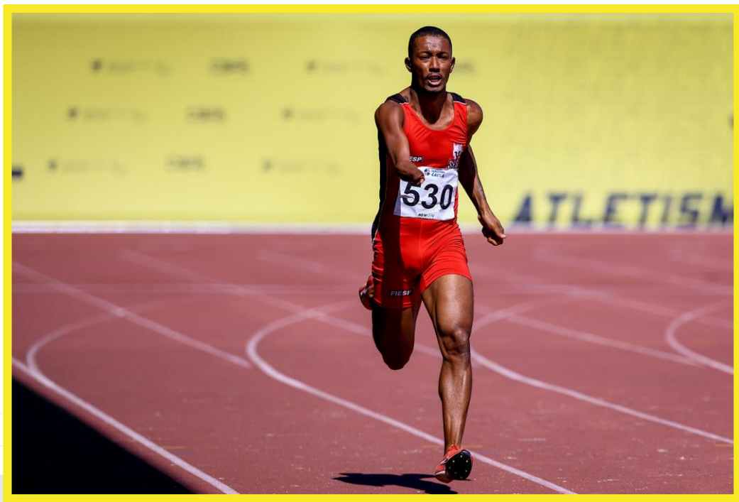
Desafio CPB/CBAAt, realizado no CT Paralímpico em São Paulo.