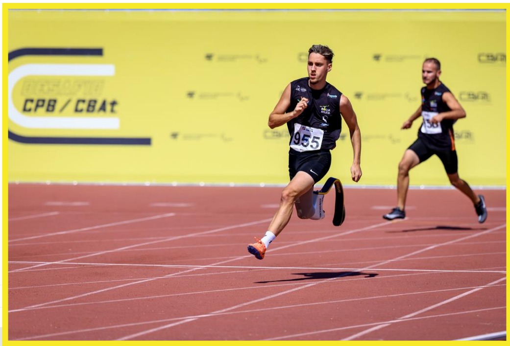
Desafio CPB/CBAAt, realizado no CT Paralímpico em São Paulo.