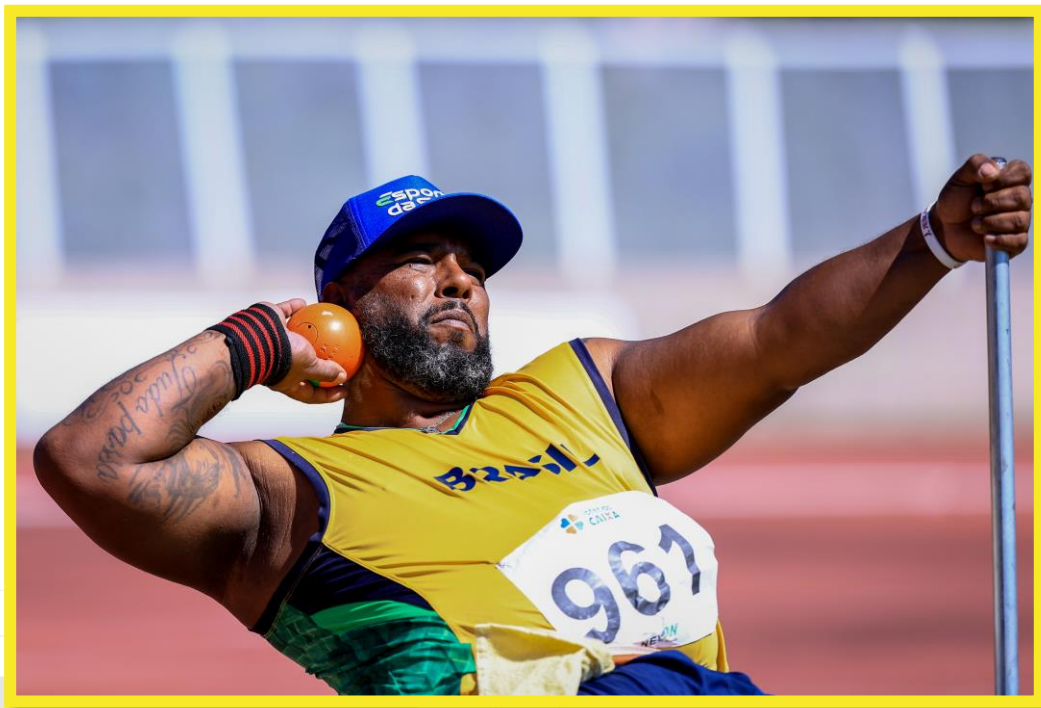
Desafio CPB/CBAt, realizado no CT Paralímpico em São Paulo.