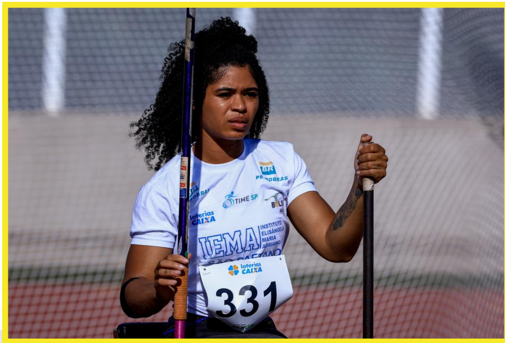
Desafio CPB/CBAt, realizado no CT Paralímpico em São Paulo.