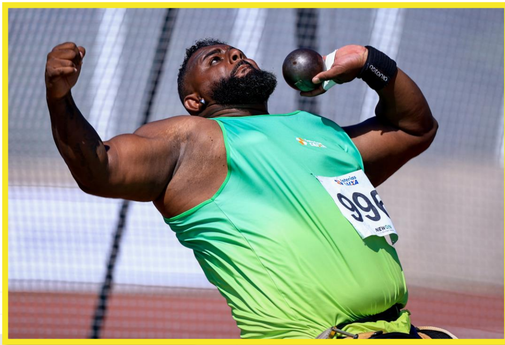
Desafio CPB/CBAAt, realizado no CT Paralímpico em São Paulo.