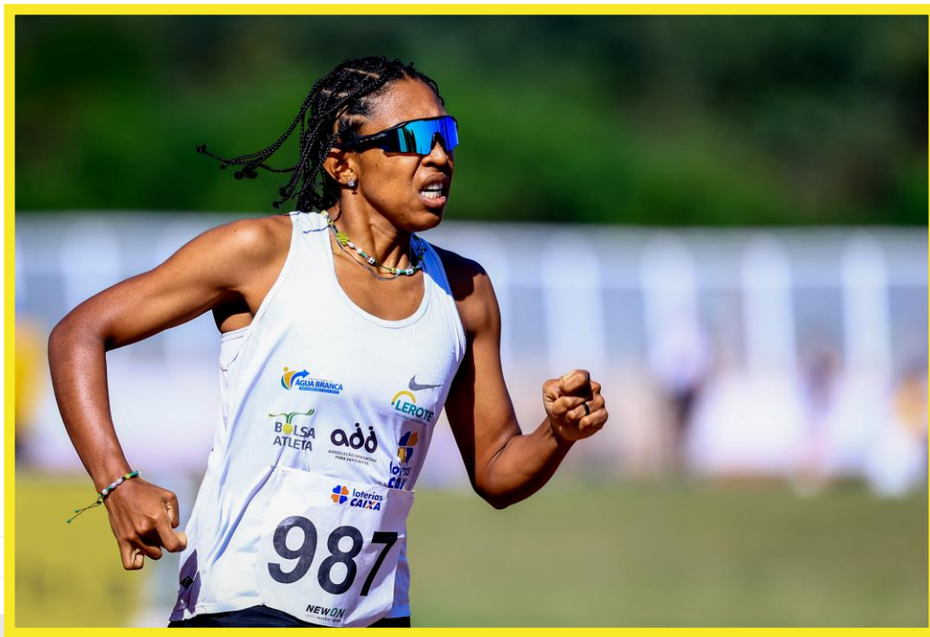
Desafio CPB/CBAt, realizado no CT Paralímpico em São Paulo.