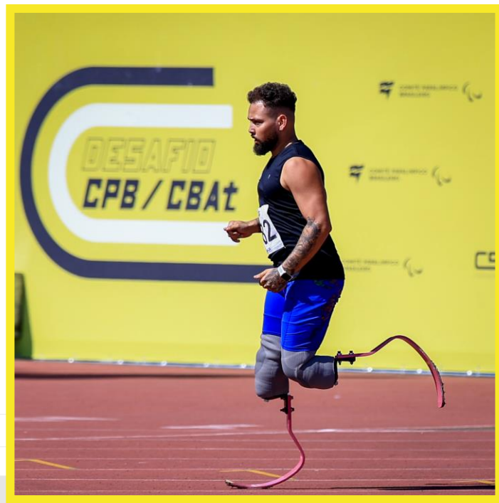
Desafio CPB/CBAt, realizado no CT Paralímpico em São Paulo.