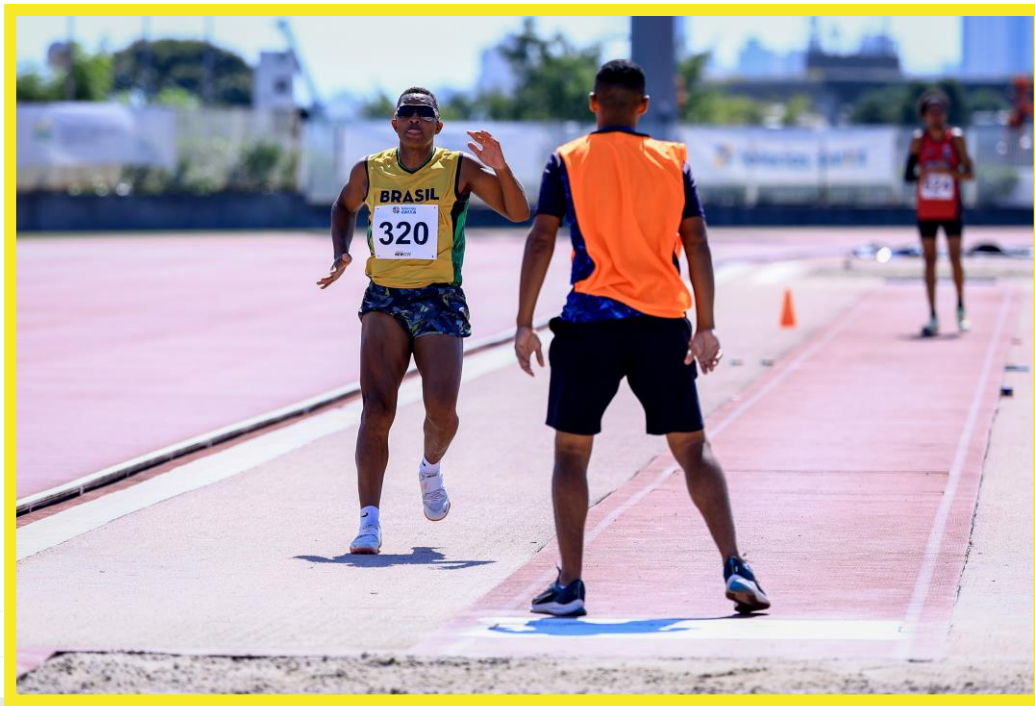
Desafio CPB/CBAt, realizado no CT Paralímpico em São Paulo.