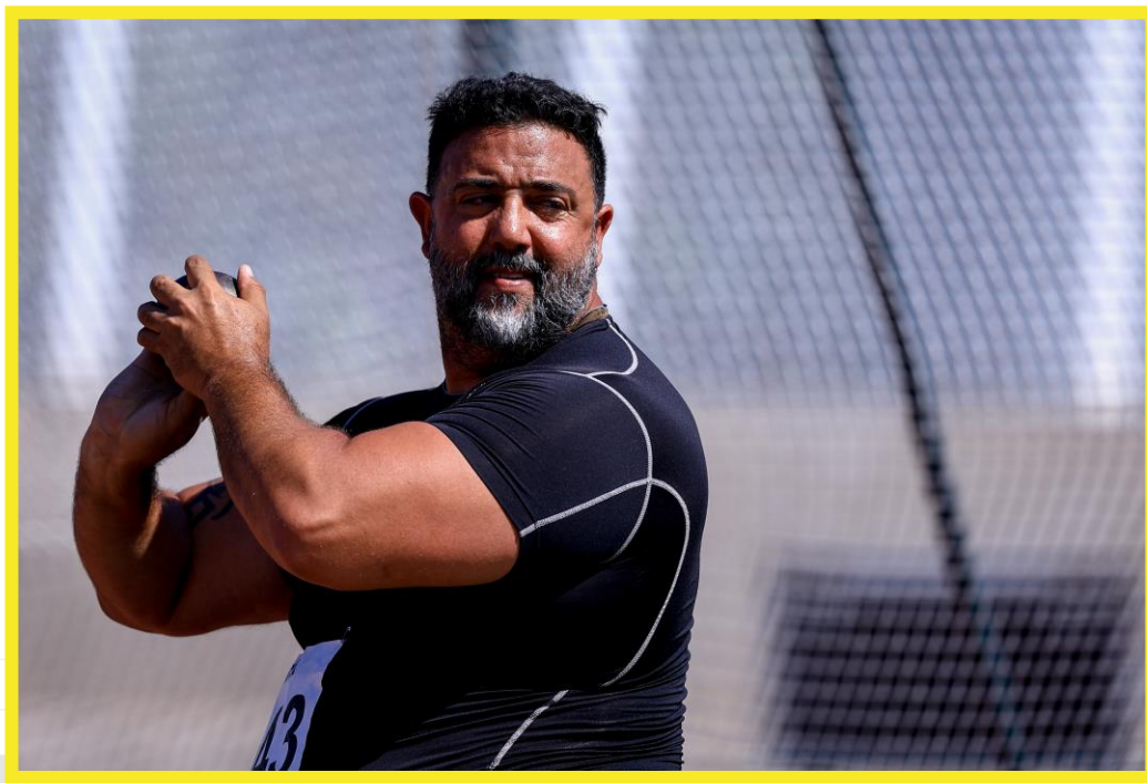
Desafio CPB/CBAAt, realizado no CT Paralímpico em São Paulo.