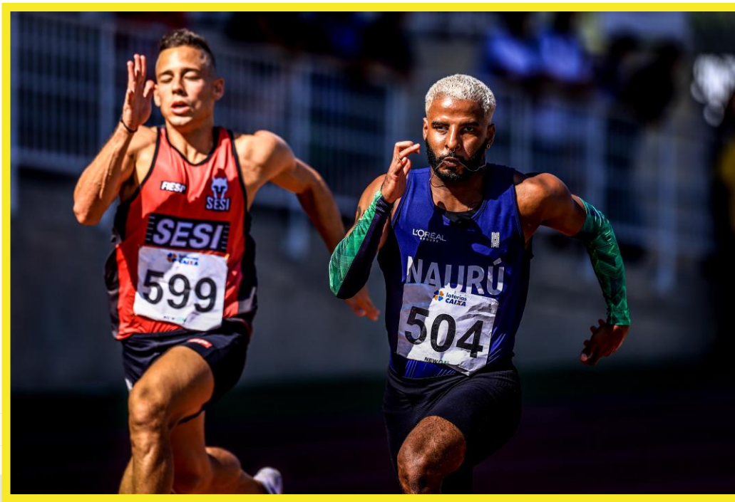
Desafio CPB/CBAt, realizado no CT Paralímpico em São Paulo.