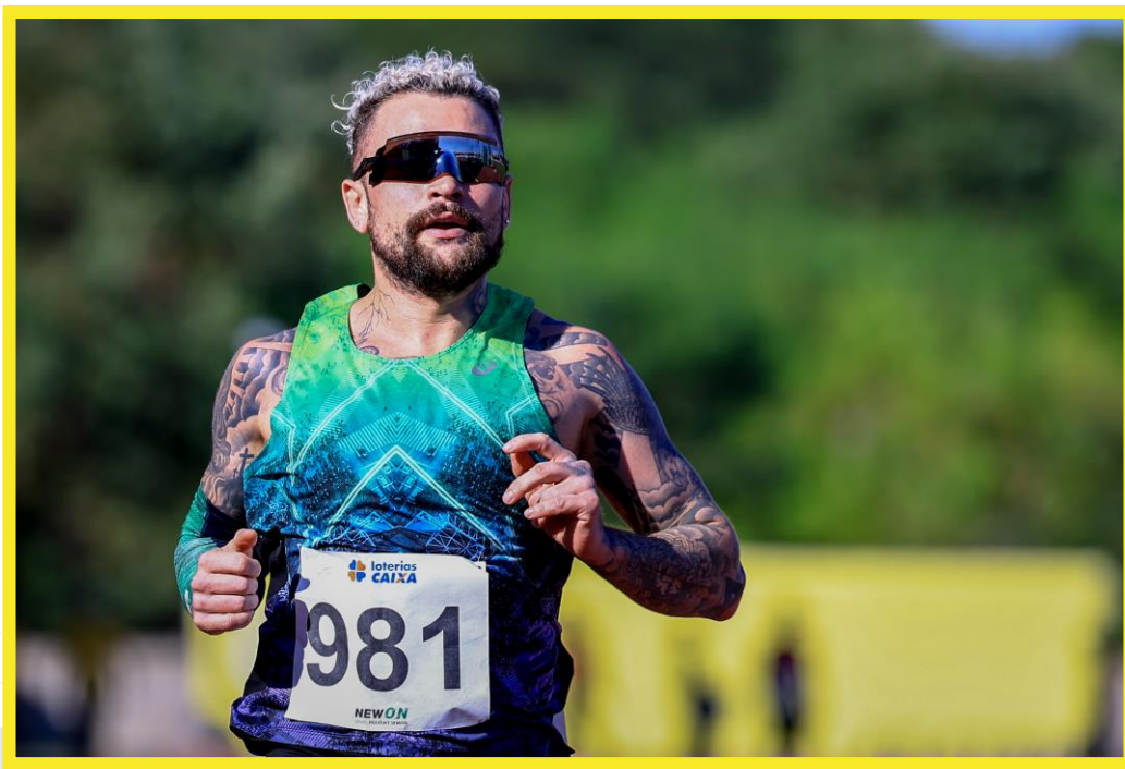
Desafio CPB/CBAt, realizado no CT Paralímpico em São Paulo.