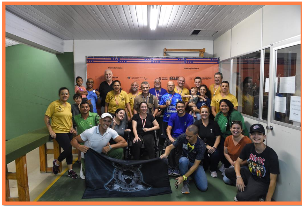
Meeting Paralímpico Loterias Caixa de Tiro Esportivo em Curitiba/PR.