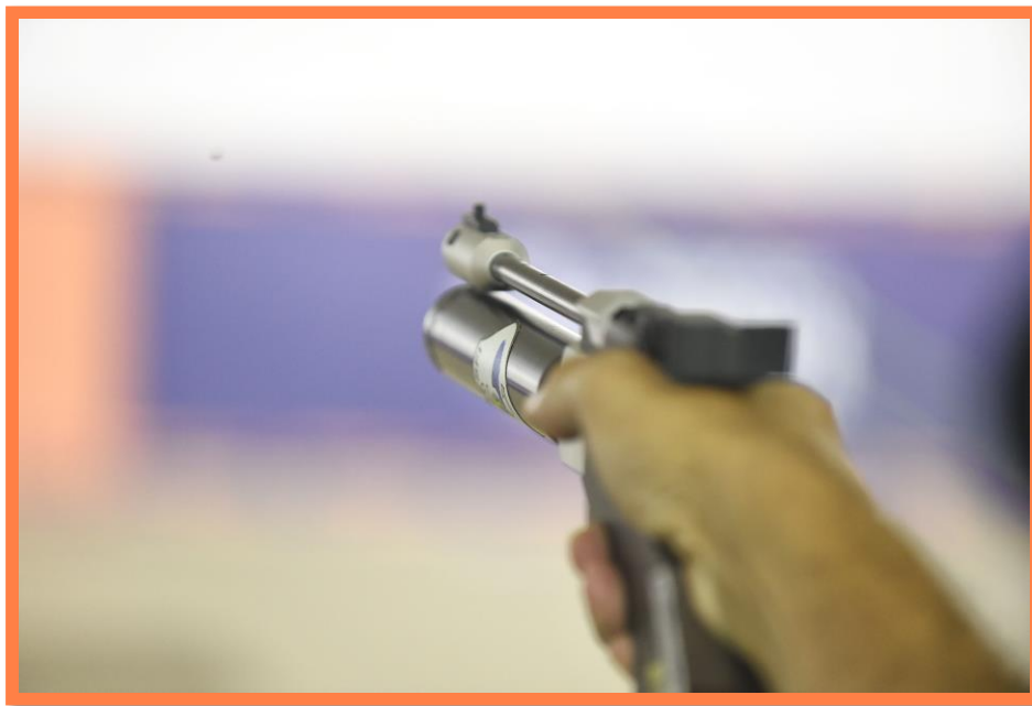
Meeting Paralímpico Loterias Caixa de Tiro Esportivo em Curitiba/PR.