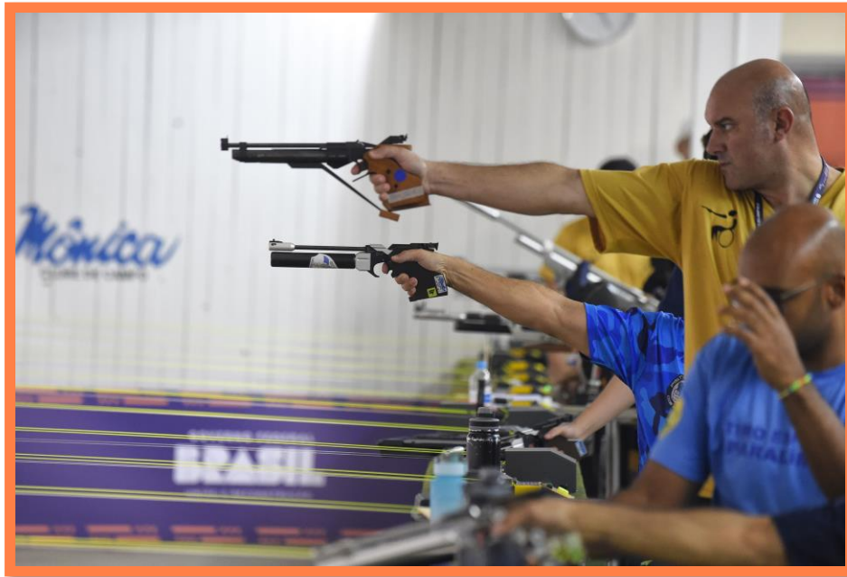
Meeting Paralímpico Loterias Caixa de Tiro Esportivo em Curitiba/PR.