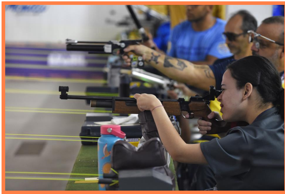
Meeting Paralímpico Loterias Caixa de Tiro Esportivo em Curitiba/PR.