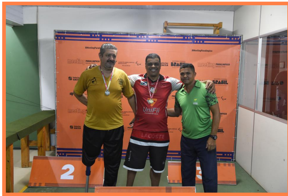
Meeting Paralímpico Loterias Caixa de Tiro Esportivo em Curitiba/PR.