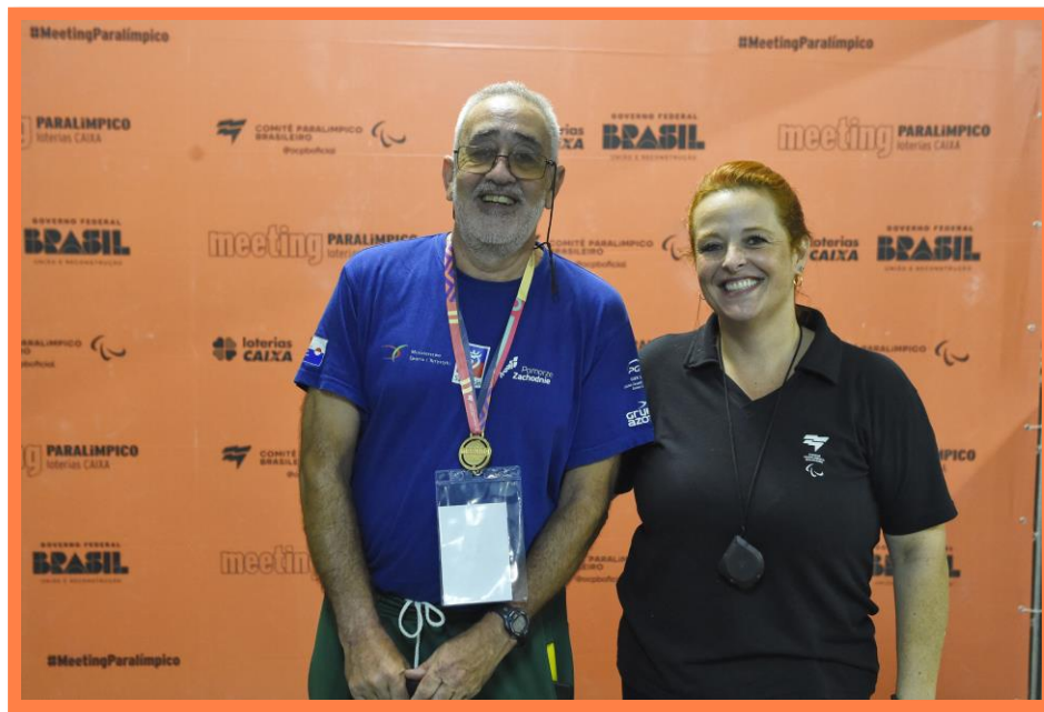
Meeting Paralímpico Loterias Caixa de Tiro Esportivo em Curitiba/PR. Foto Denis Ferreira Netto/CPB.