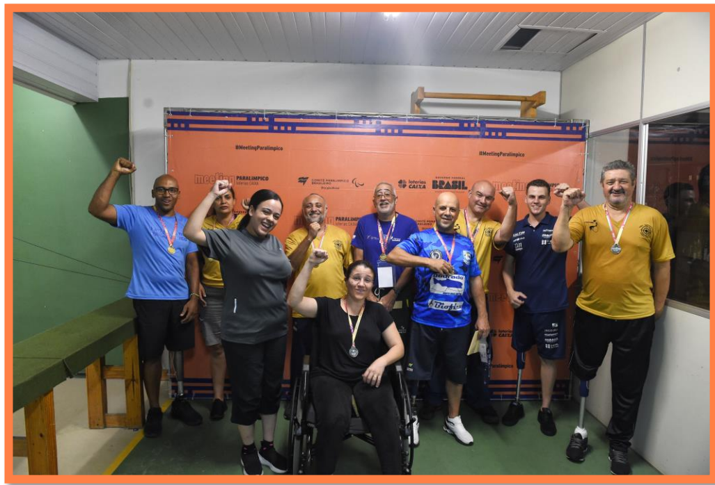
Meeting Paralímpico Loterias Caixa de Tiro Esportivo em Curitiba/PR.