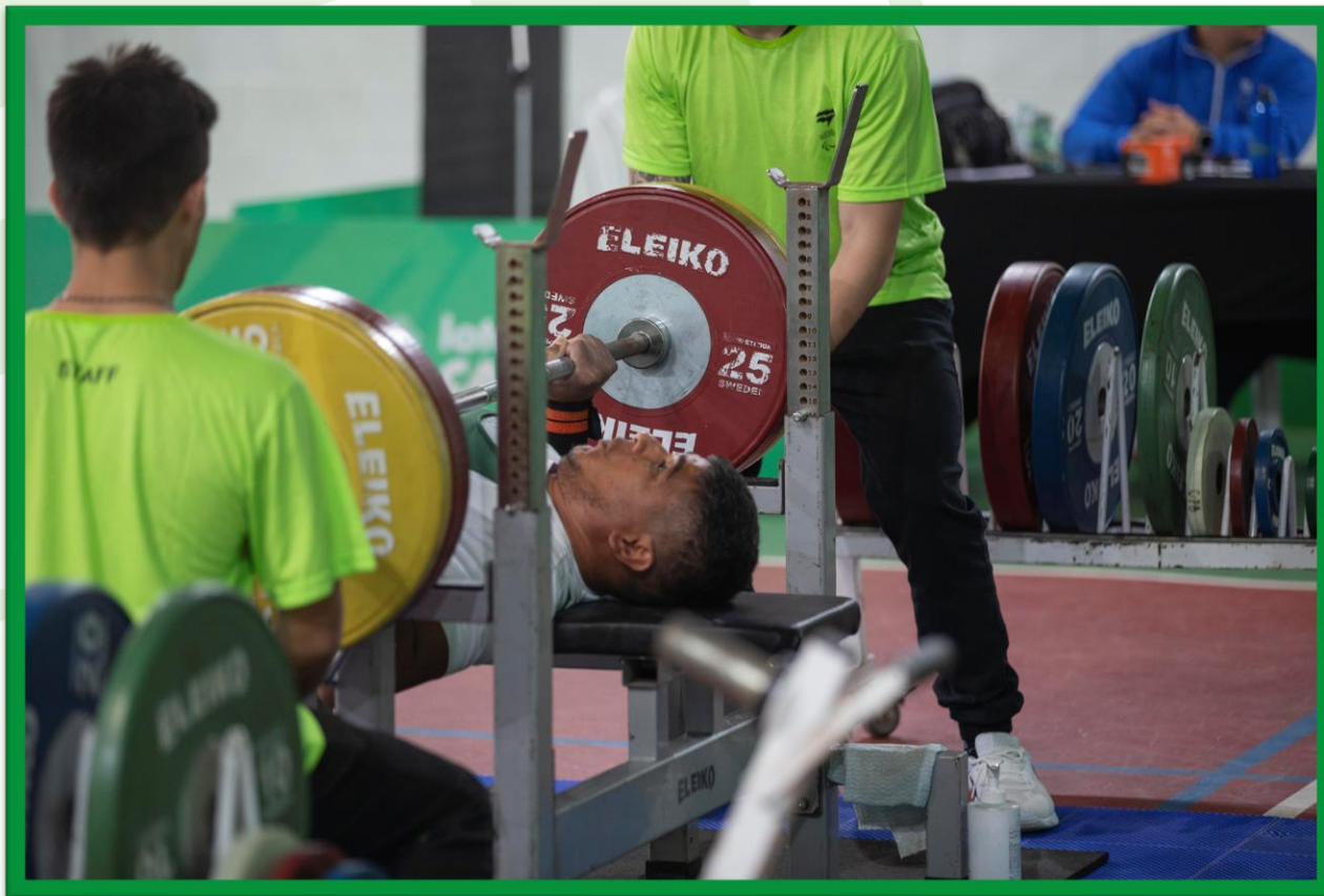
Meeting Paralímpico Loterias Caixa de Halterofilismo na UFPR, em Curitiba.