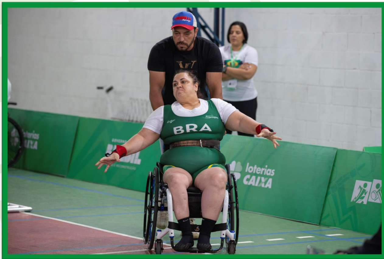
Meeting Paralímpico Loterias Caixa de Halterofilismo na UFPR, em Curitiba.