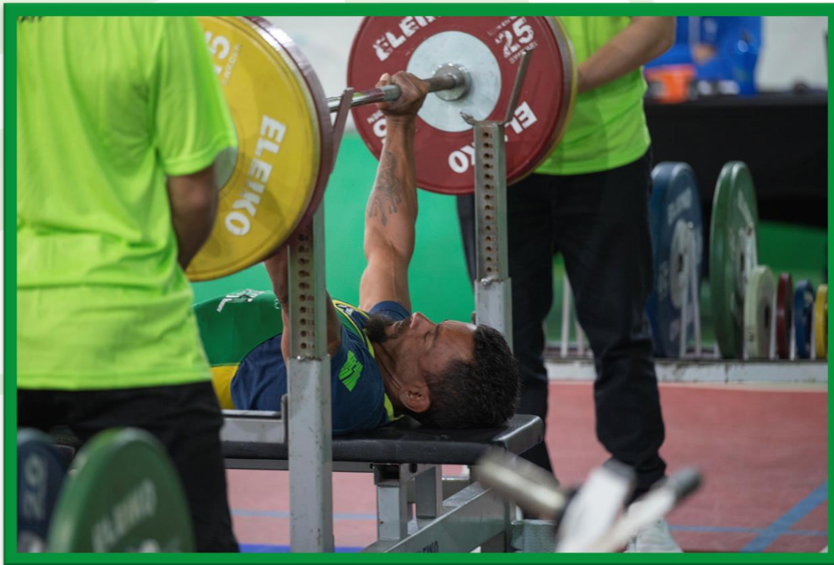
Meeting Paralímpico Loterias Caixa de Halterofilismo na UFPR, em Curitiba.