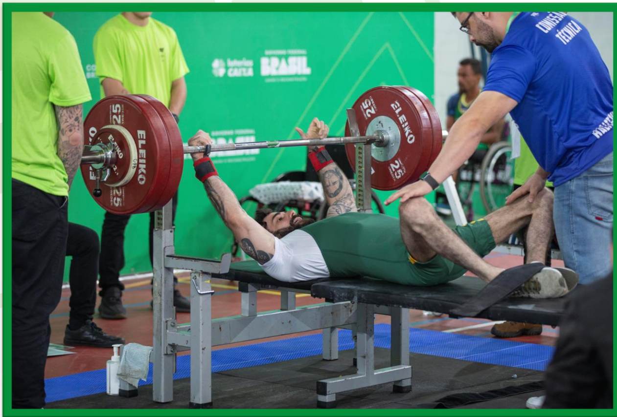
Meeting Paralímpico Loterias Caixa de Halterofilismo na UFPR, em Curitiba.