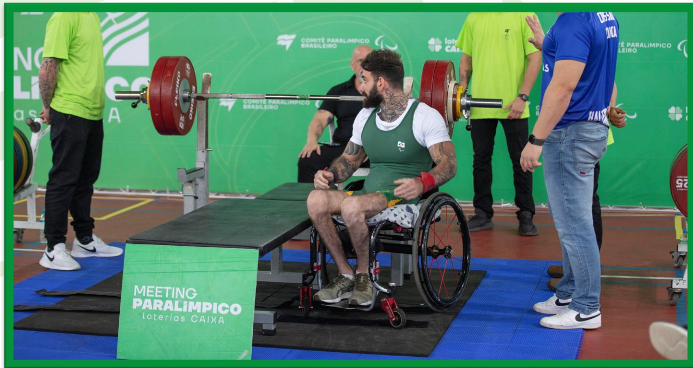
Meeting Paralímpico Loterias Caixa de Halterofilismo na UFPR, em Curitiba.