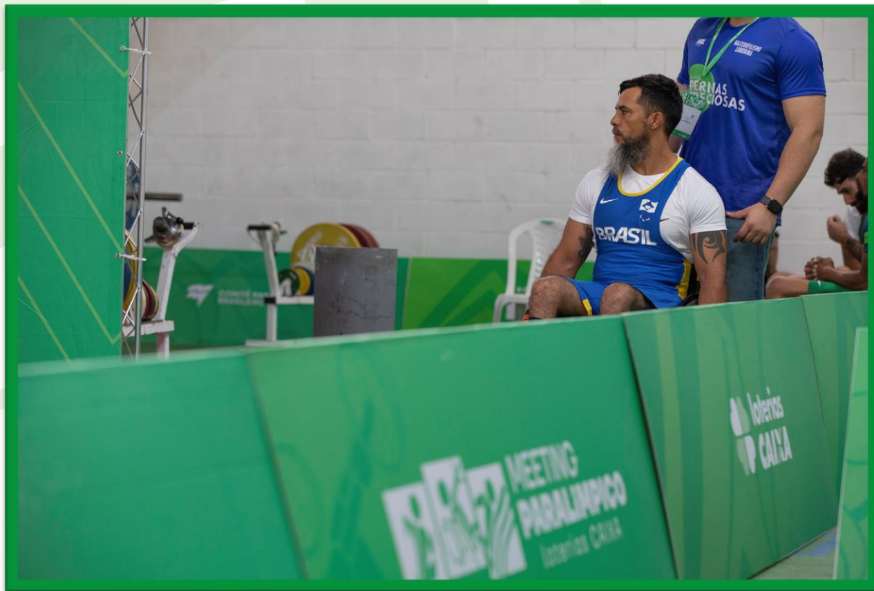
Meeting Paralímpico Loterias Caixa de Halterofilismo na UFPR, em Curitiba.