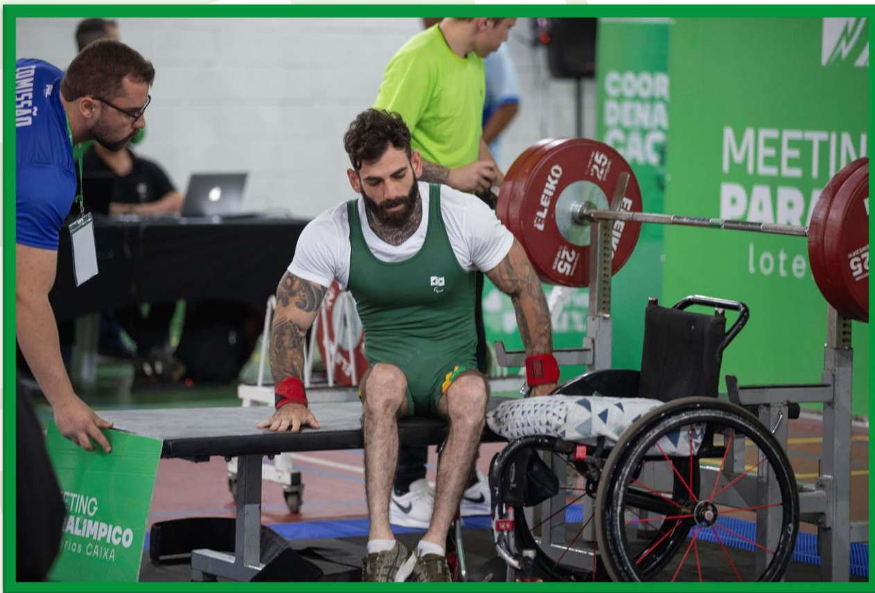
Meeting Paralímpico Loterias Caixa de Halterofilismo na UFPR, em Curitiba.