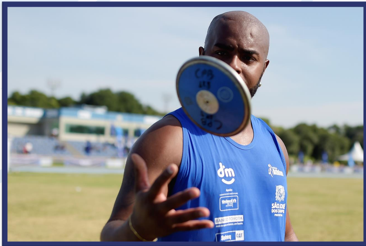
Meeting Paralímpico Loterias Caixa de Atletismo - CEFAN no Rio de Janeiro.