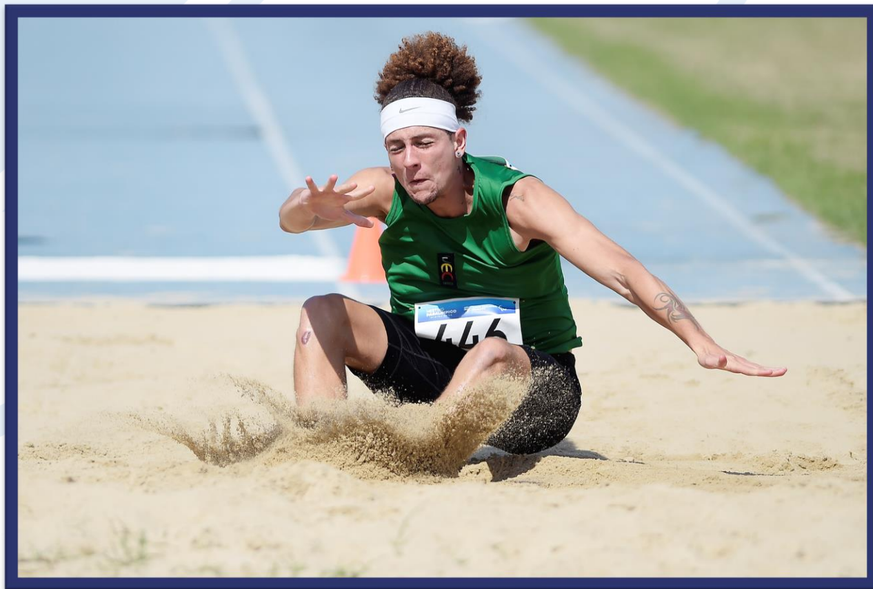
Meeting Paralímpico Loterias Caixa de Atletismo - CEFAN no Rio de Janeiro.