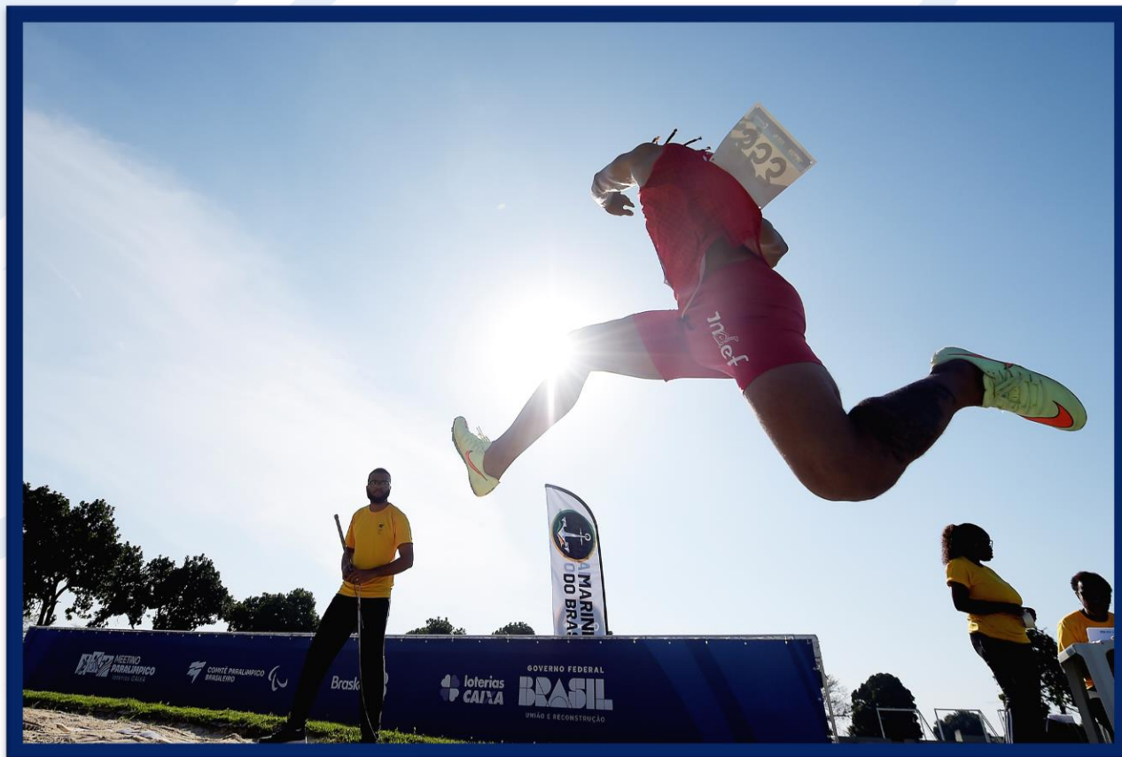
Meeting Paralímpico Loterias Caixa de Atletismo - CEFAN no Rio de Janeiro.