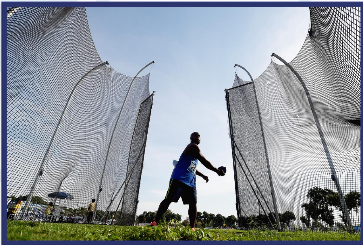
Meeting Paralímpico Loterias Caixa de Atletismo - CEFAN no Rio de Janeiro.