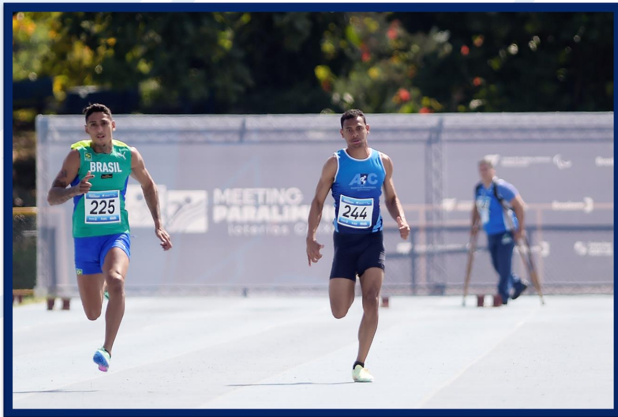
Meeting Paralímpico Loterias Caixa de Atletismo - CEFAN no Rio de Janeiro.