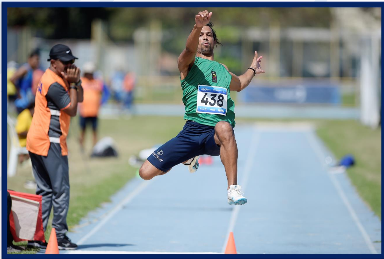
Meeting Paralímpico Loterias Caixa de Atletismo - CEFAN no Rio de Janeiro.