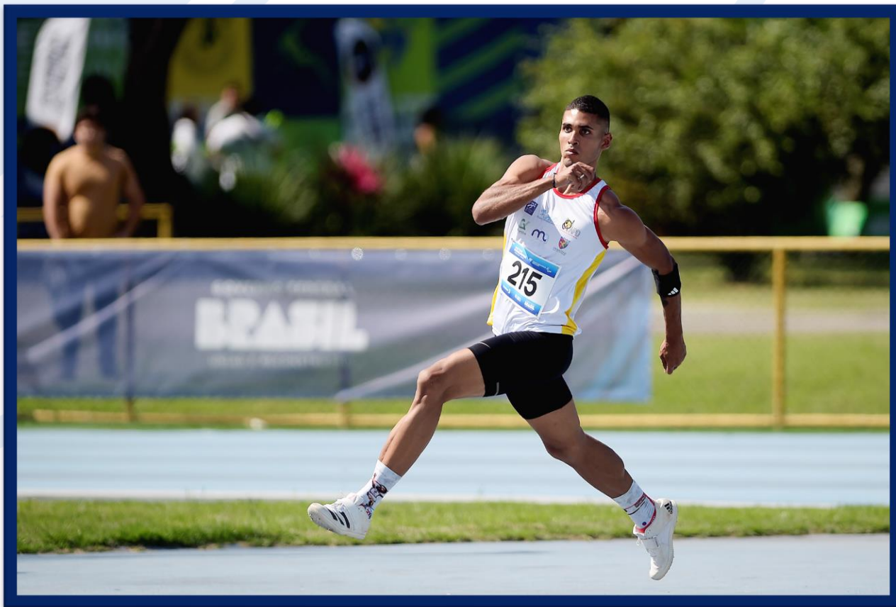
Meeting Paralímpico Loterias Caixa de Atletismo - CEFAN no Rio de Janeiro.