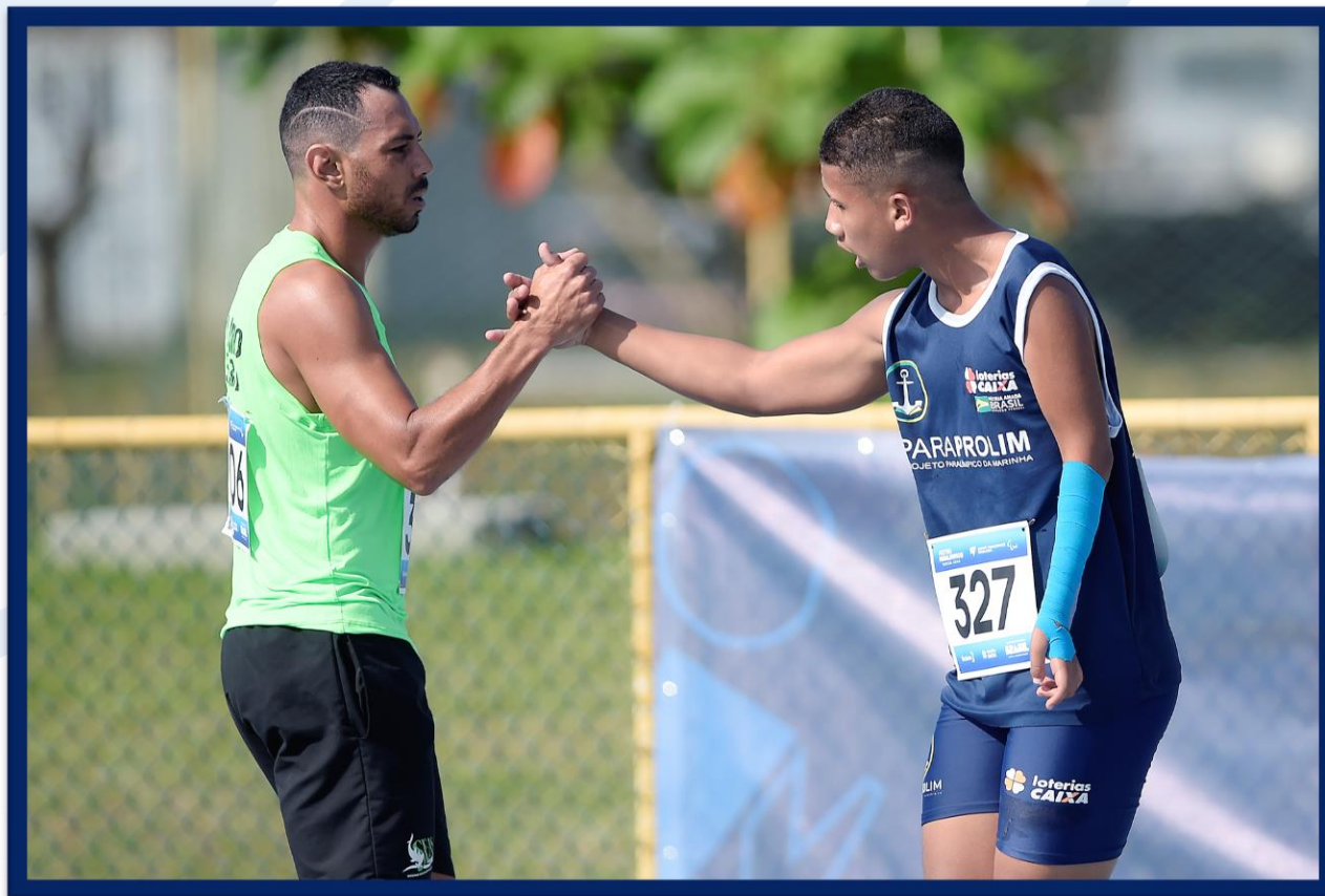
Meeting Paralímpico Loterias Caixa de Atletismo - CEFAN no Rio de Janeiro.