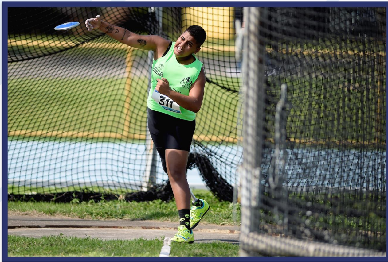
Meeting Paralímpico Loterias Caixa de Atletismo - CEFAN no Rio de Janeiro.