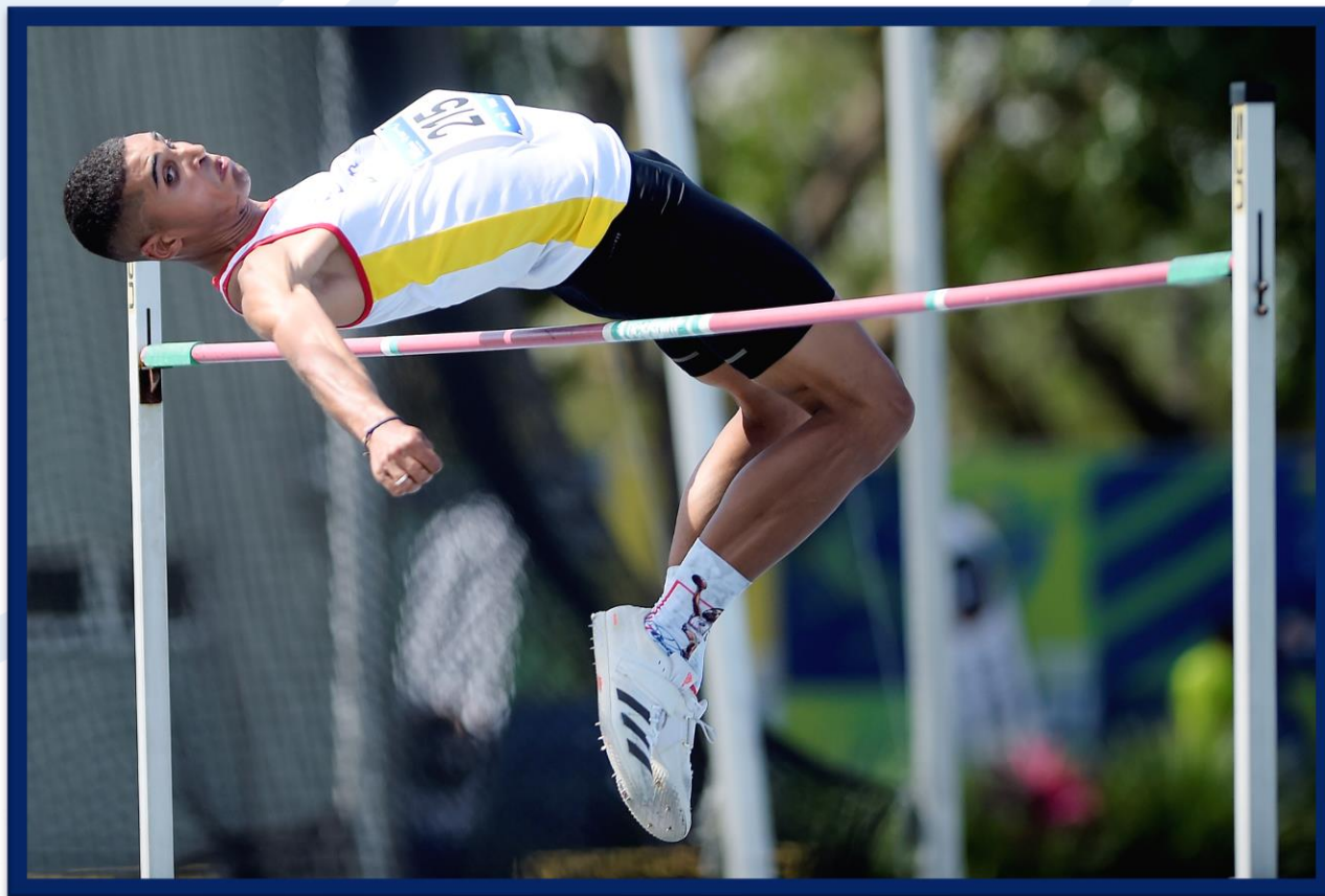
Meeting Paralímpico Loterias Caixa de Atletismo - CEFAN no Rio de Janeiro.