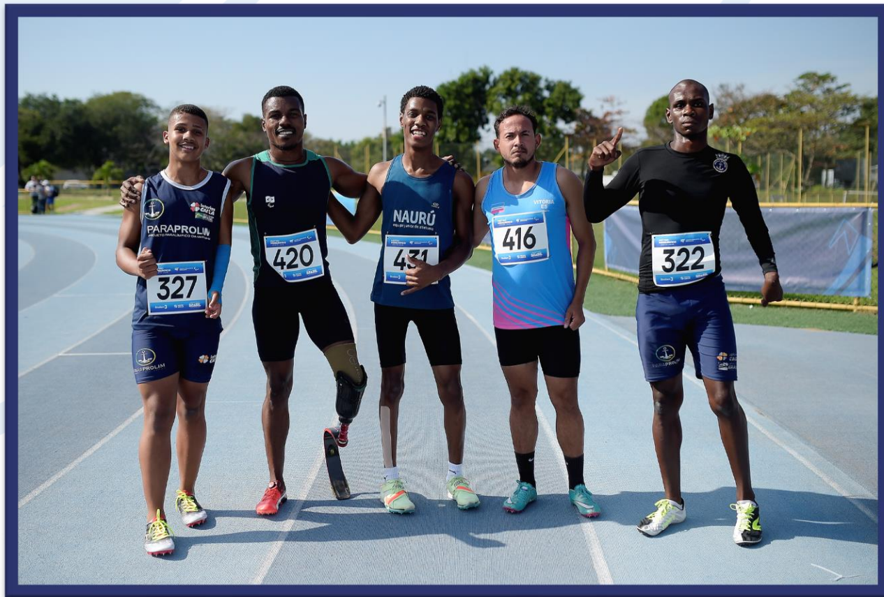
Meeting Paralímpico Loterias Caixa de Atletismo - CEFAN no Rio de Janeiro.