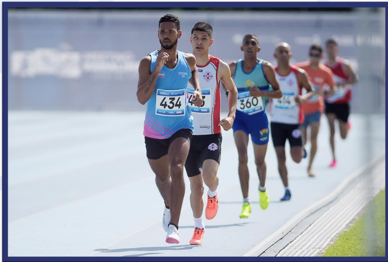
Meeting Paralímpico Loterias Caixa de Atletismo - CEFAN no Rio de Janeiro.