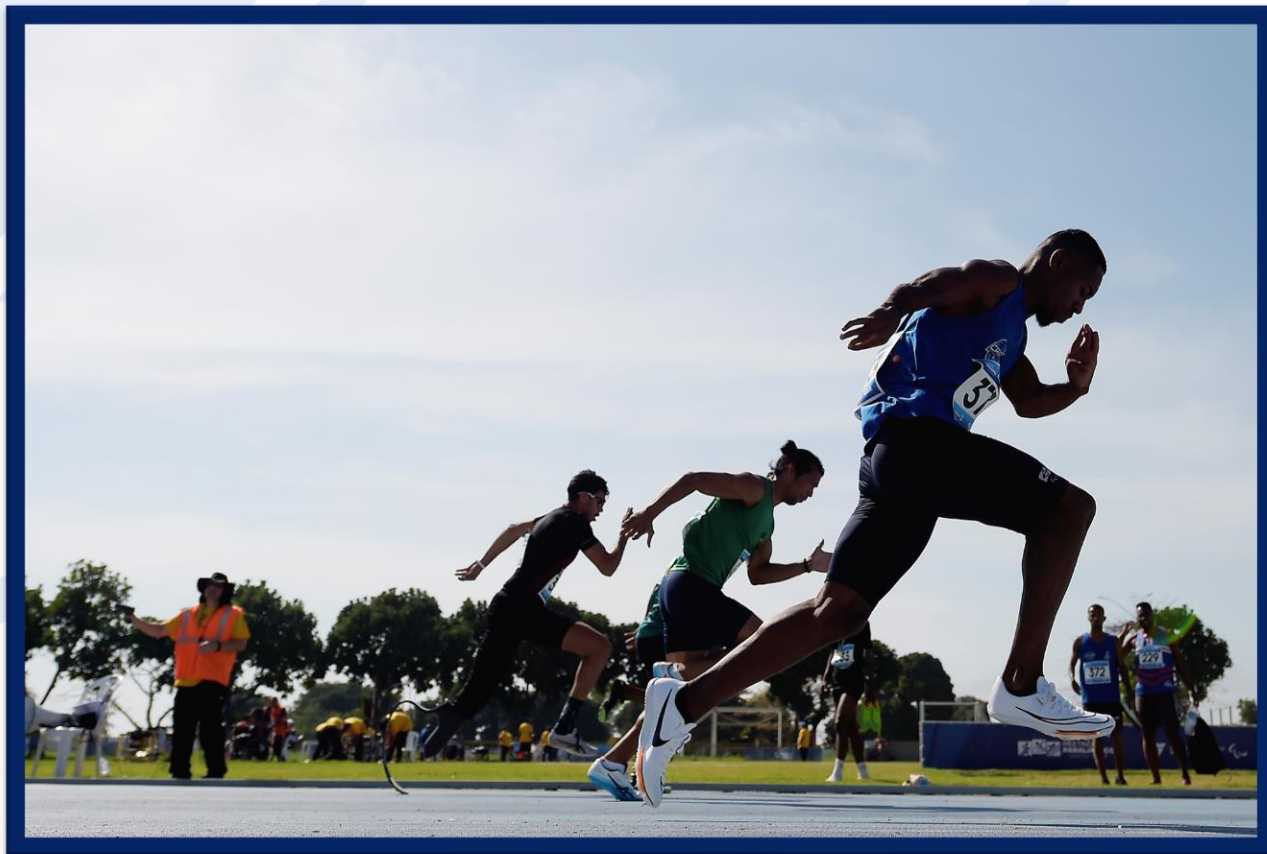
Meeting Paralímpico Loterias Caixa de Atletismo - CEFAN no Rio de Janeiro.