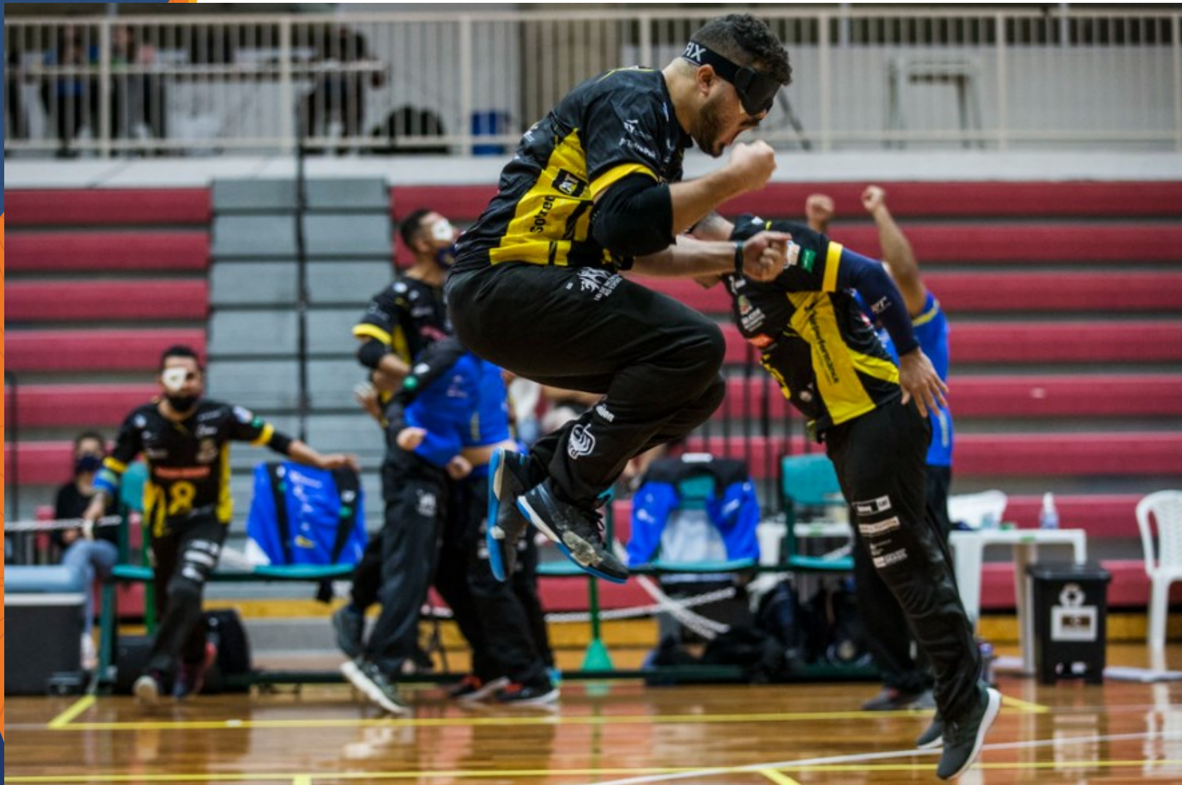
Athlon x Apace - Campeonato Brasileiro de Goalball no CT Paralímpico, em São Paulo.