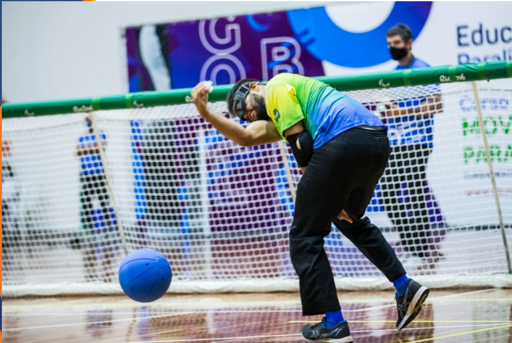
Santos x CETEFE - Campeonato Brasileiro de Goalball no CT Paralímpico, em São Paulo.