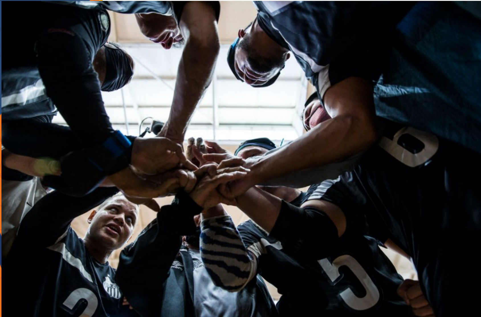
Santos x CETEFE - Campeonato Brasileiro de Goalball no CT Paralímpico, em São Paulo.