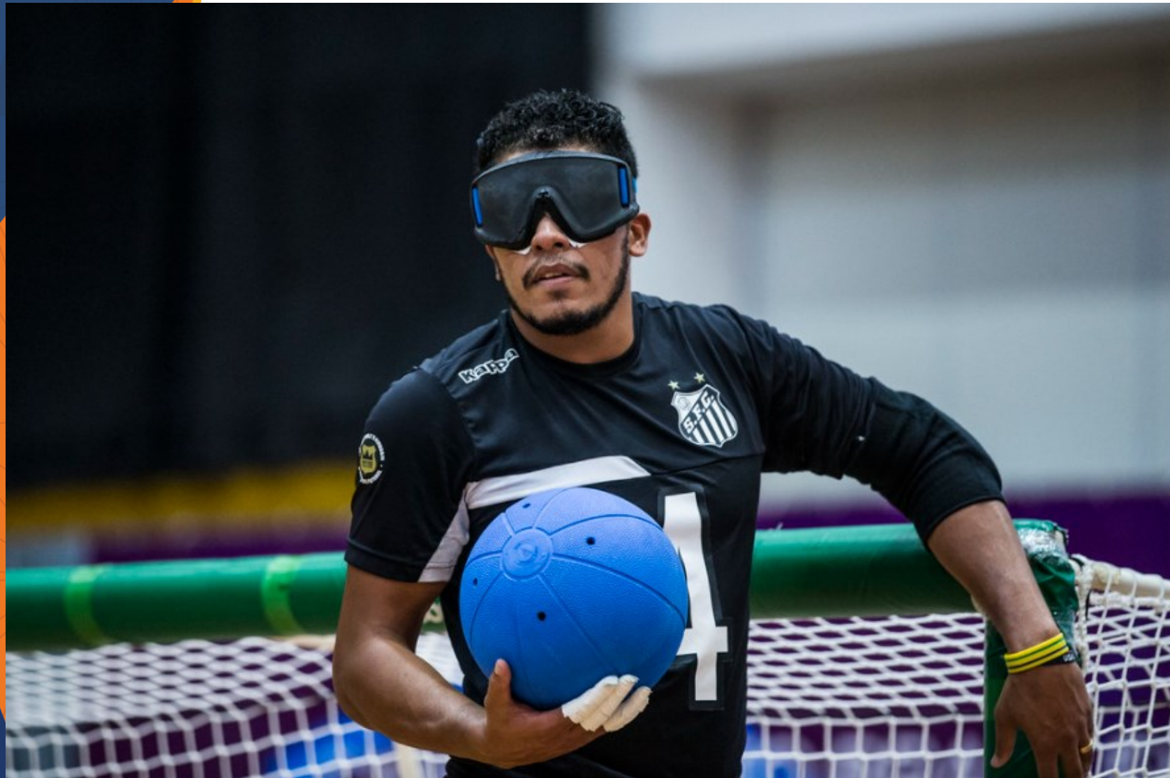
Santos x CETEFE - Campeonato Brasileiro de Goalball no CT Paralímpico, em São Paulo.