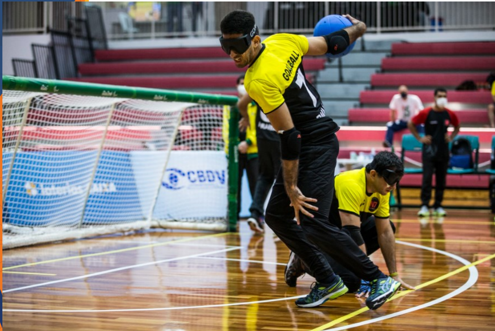
Athlon x Apace - Campeonato Brasileiro de Goalball no CT Paralímpico, em São Paulo.