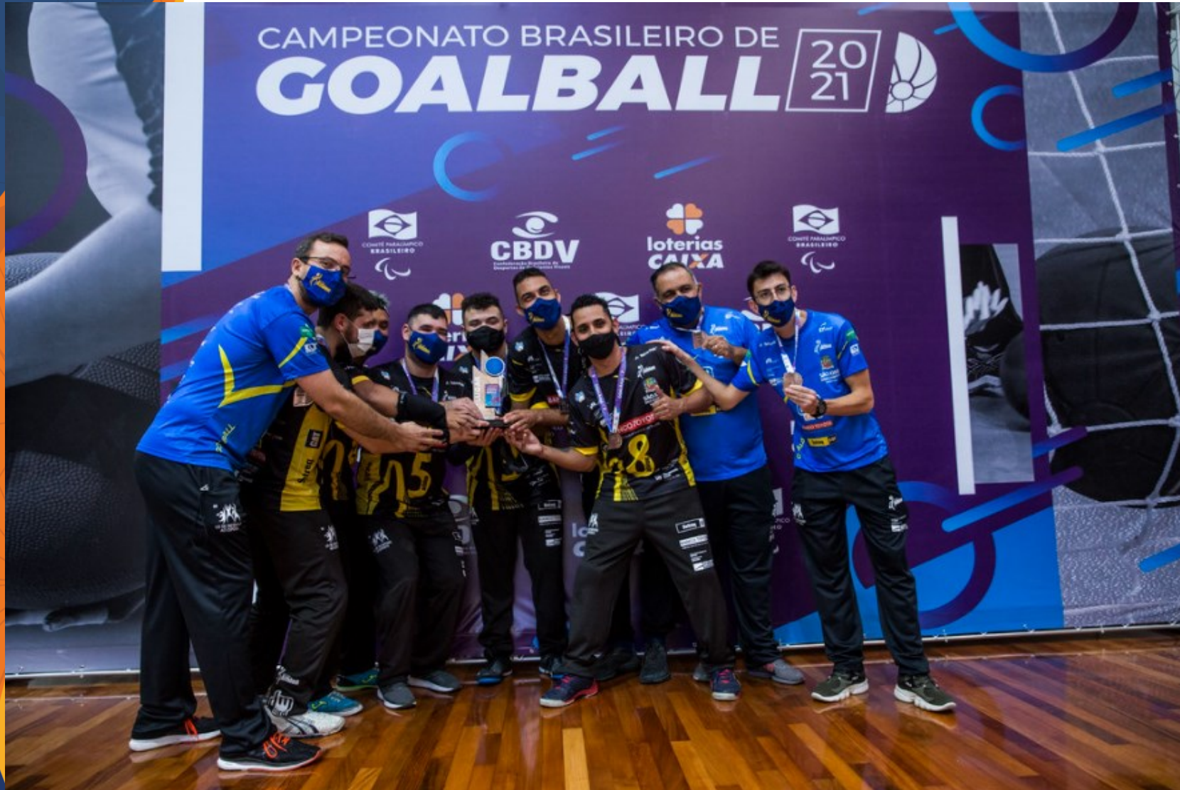
Athlon/São José - 3º LUGAR - Campeonato Brasileiro de Goalball no CT Paralímpico, em São Paulo.