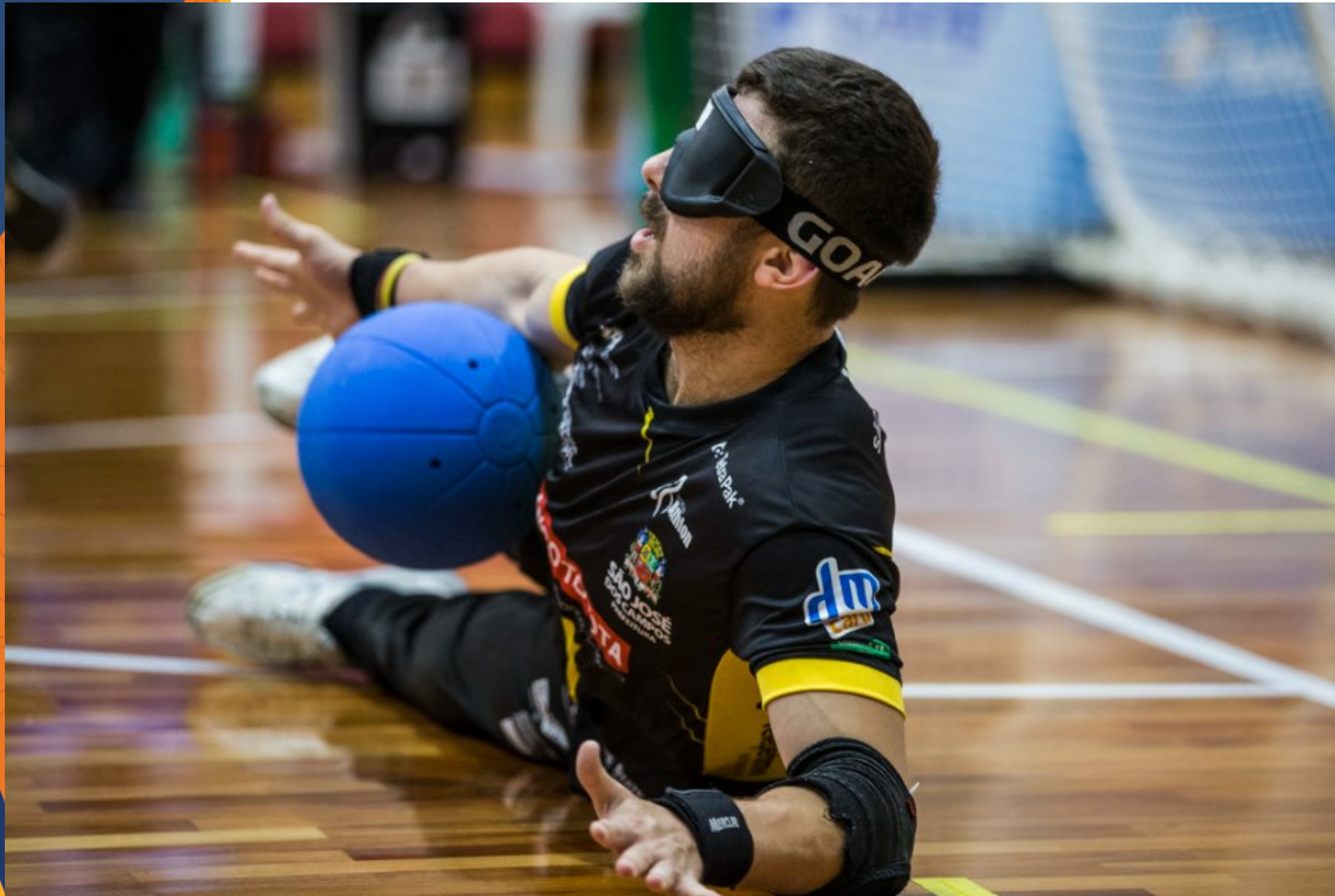
Athlon x Apace - Campeonato Brasileiro de Goalball no CT Paralímpico, em São Paulo.