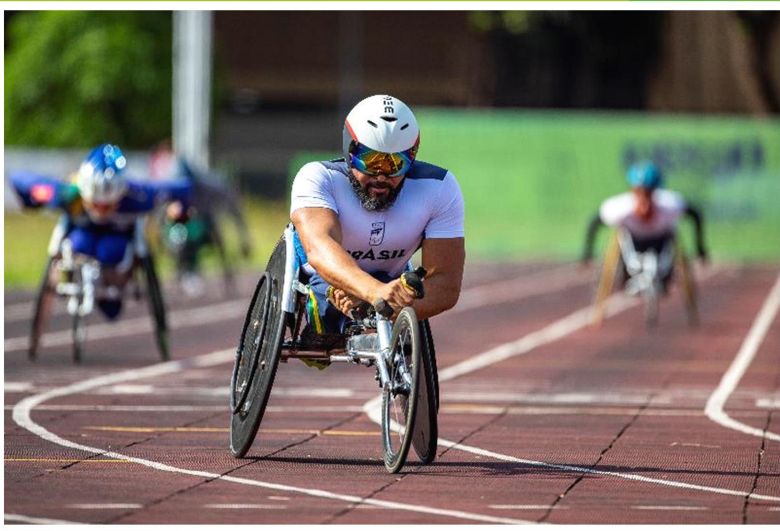
Meeting Paralímpico Loterias Caixa de atletismo em Brasília/ DF.