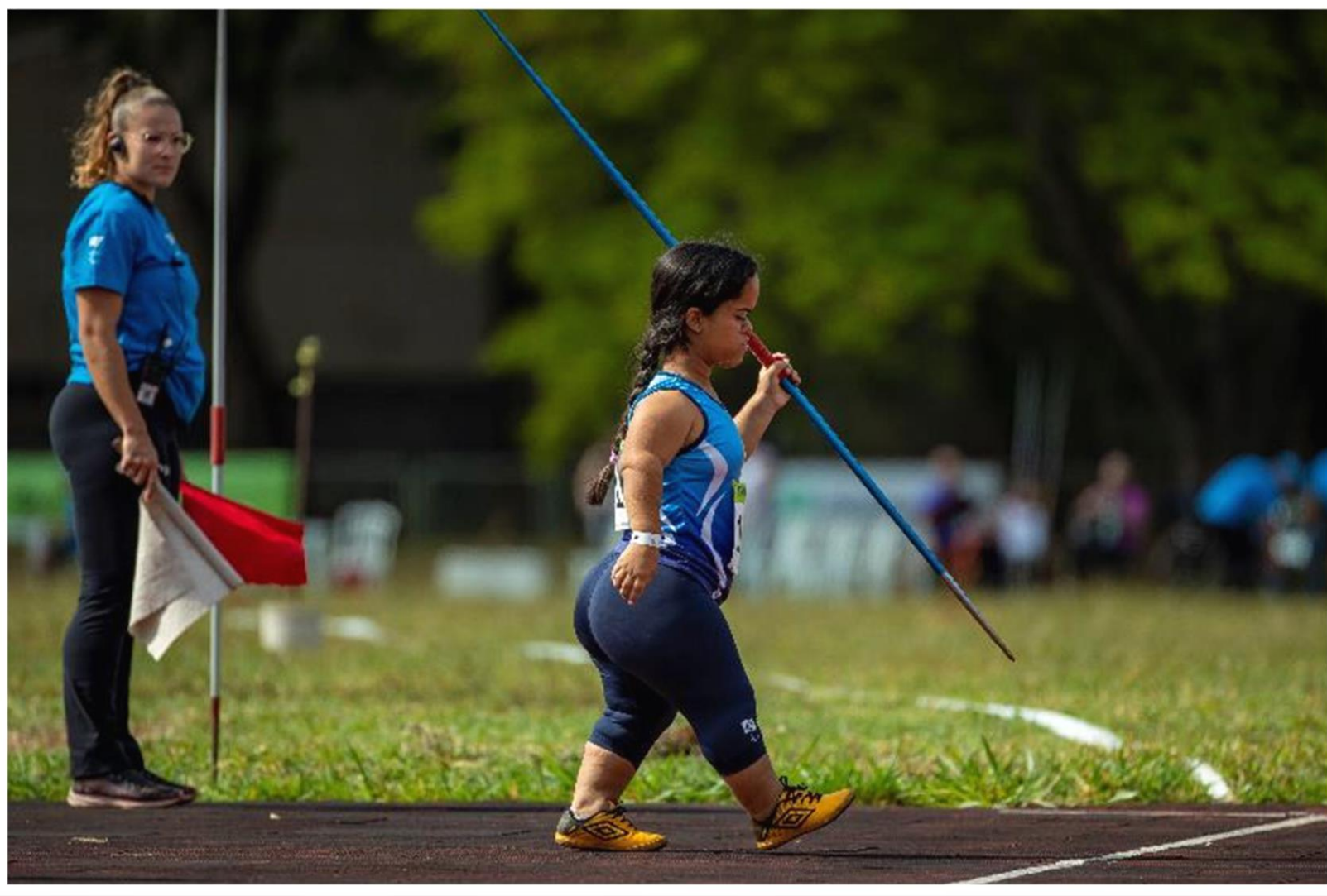
Meeting Paralímpico Loterias Caixa de atletismo em Brasília/ DF.