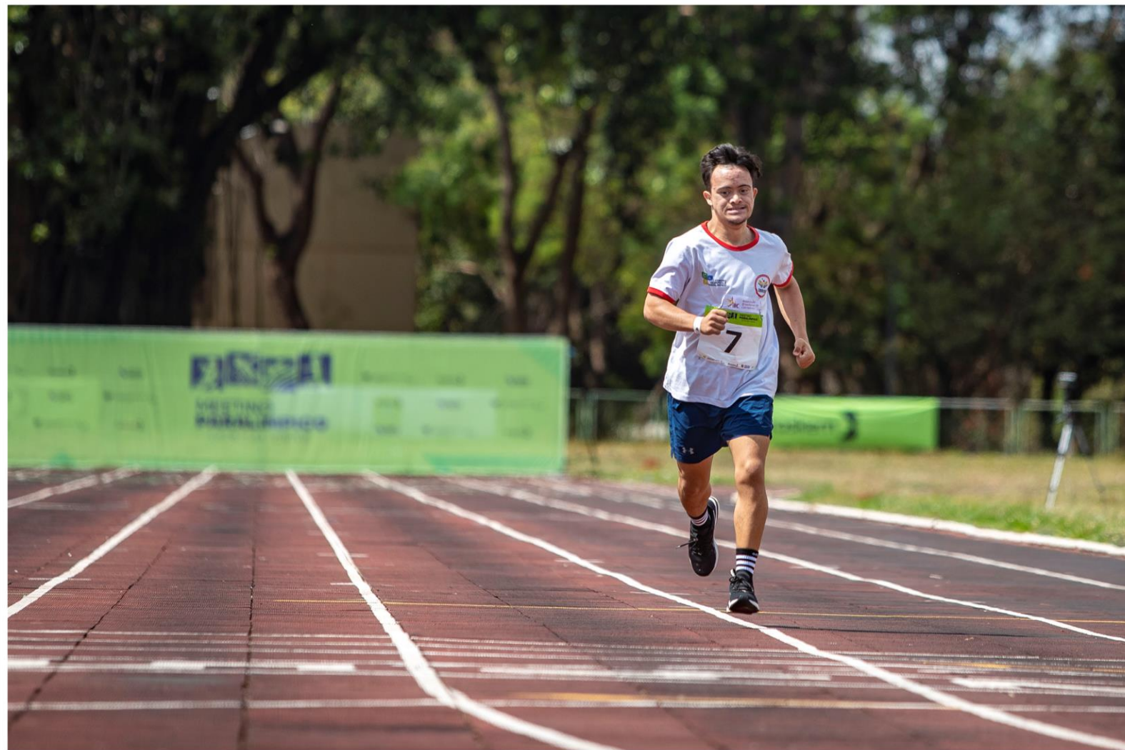
Meeting Paralímpico Loterias Caixa de atletismo em Brasília/ DF.