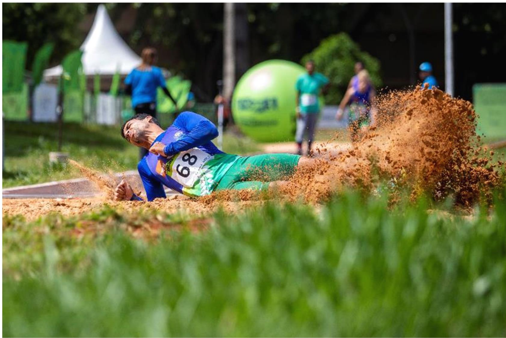
Meeting Paralímpico Loterias Caixa de atletismo em Brasília/ DF.