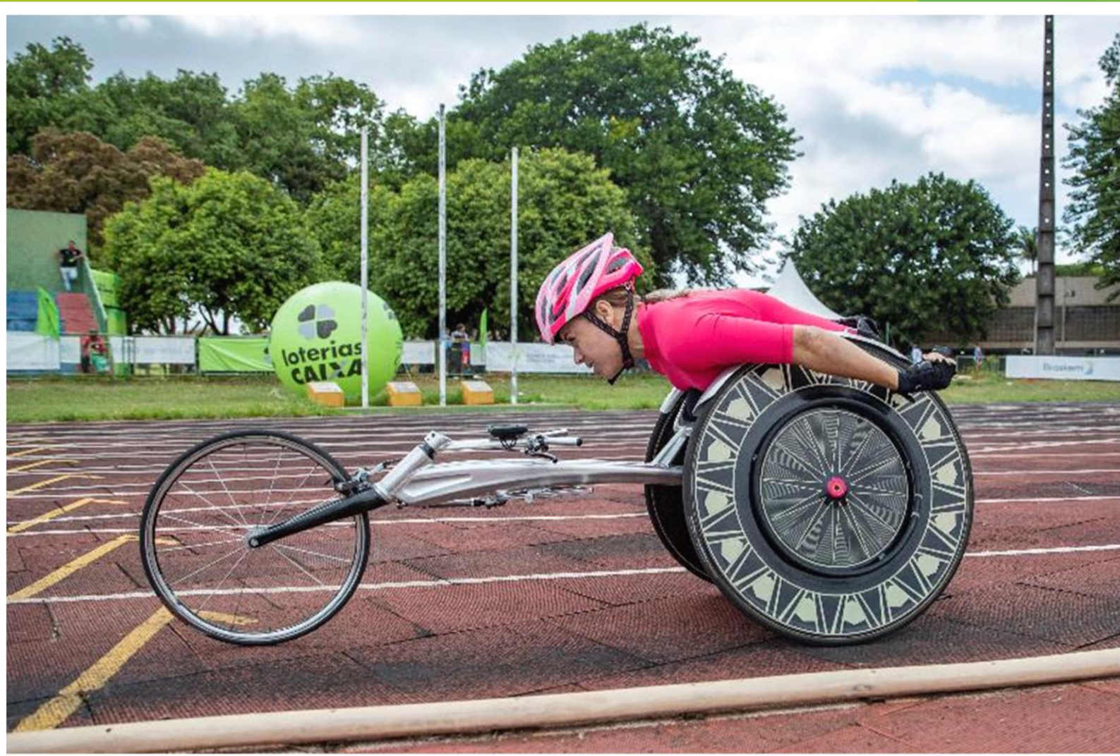
Meeting Paralímpico Loterias Caixa de atletismo em Brasília/ DF.