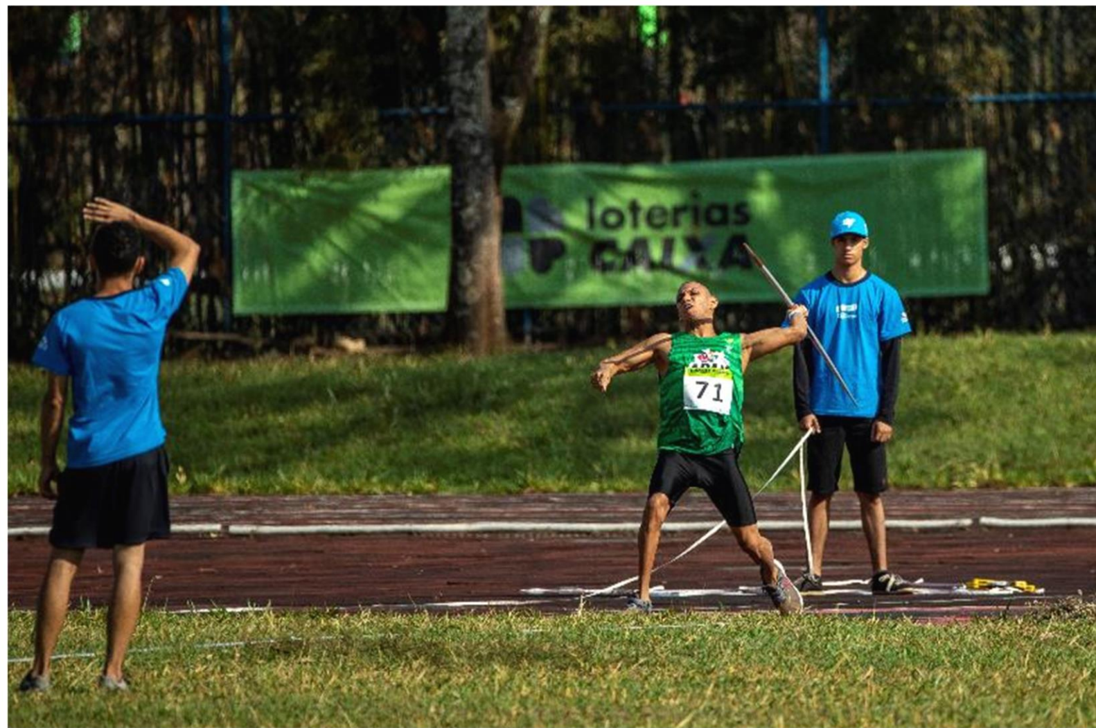
Meeting Paralímpico Loterias Caixa de atletismo em Brasília/ DF.