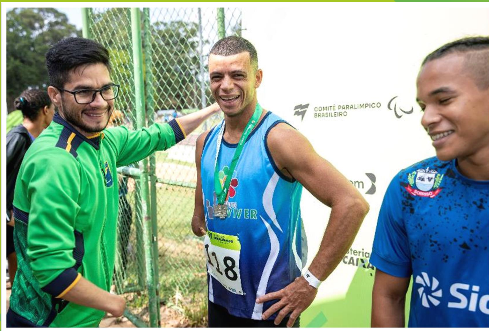
Meeting Paralímpico Loterias Caixa de atletismo em Brasília/ DF.