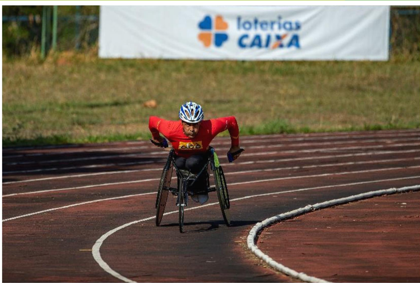
Meeting Paralímpico Loterias Caixa de atletismo em Brasília/ DF.