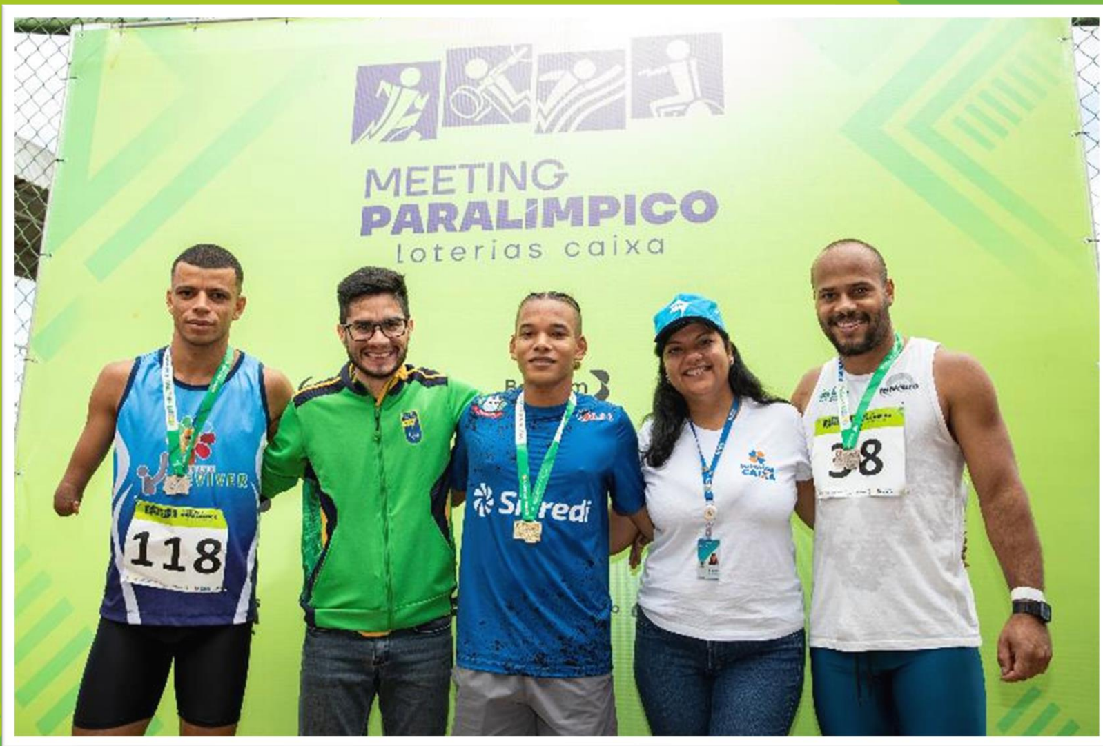
Meeting Paralímpico Loterias Caixa de atletismo em Brasília/ DF.