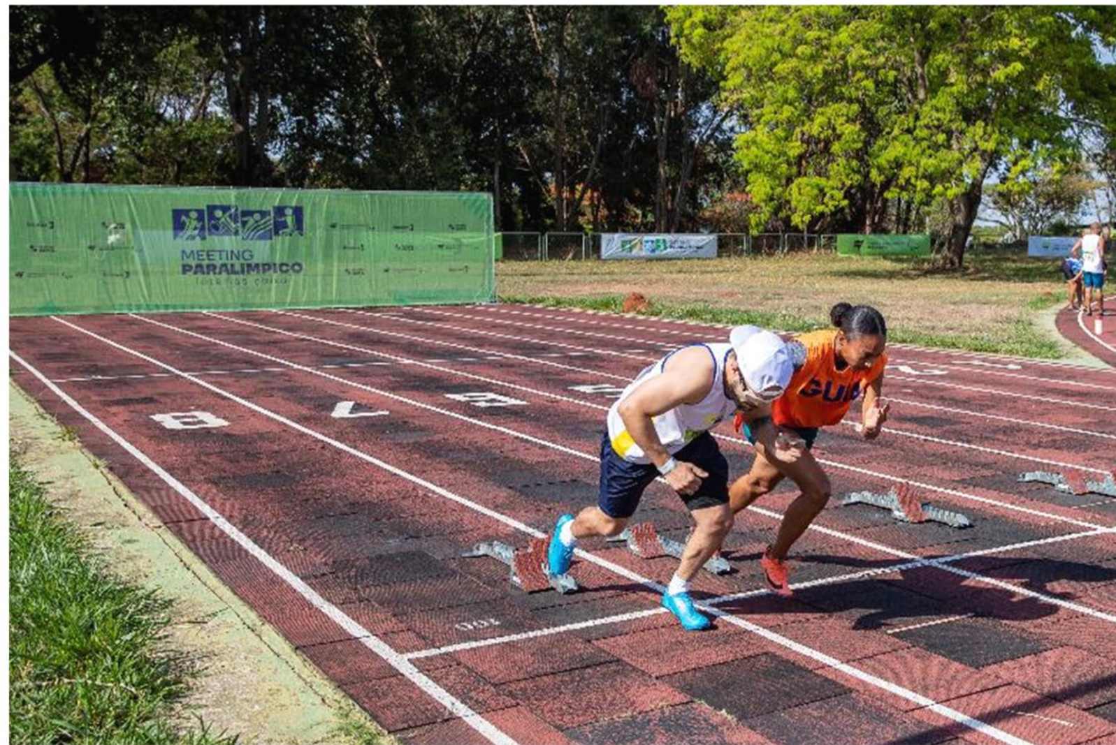
Meeting Paralímpico Loterias Caixa de atletismo em Brasília/ DF.