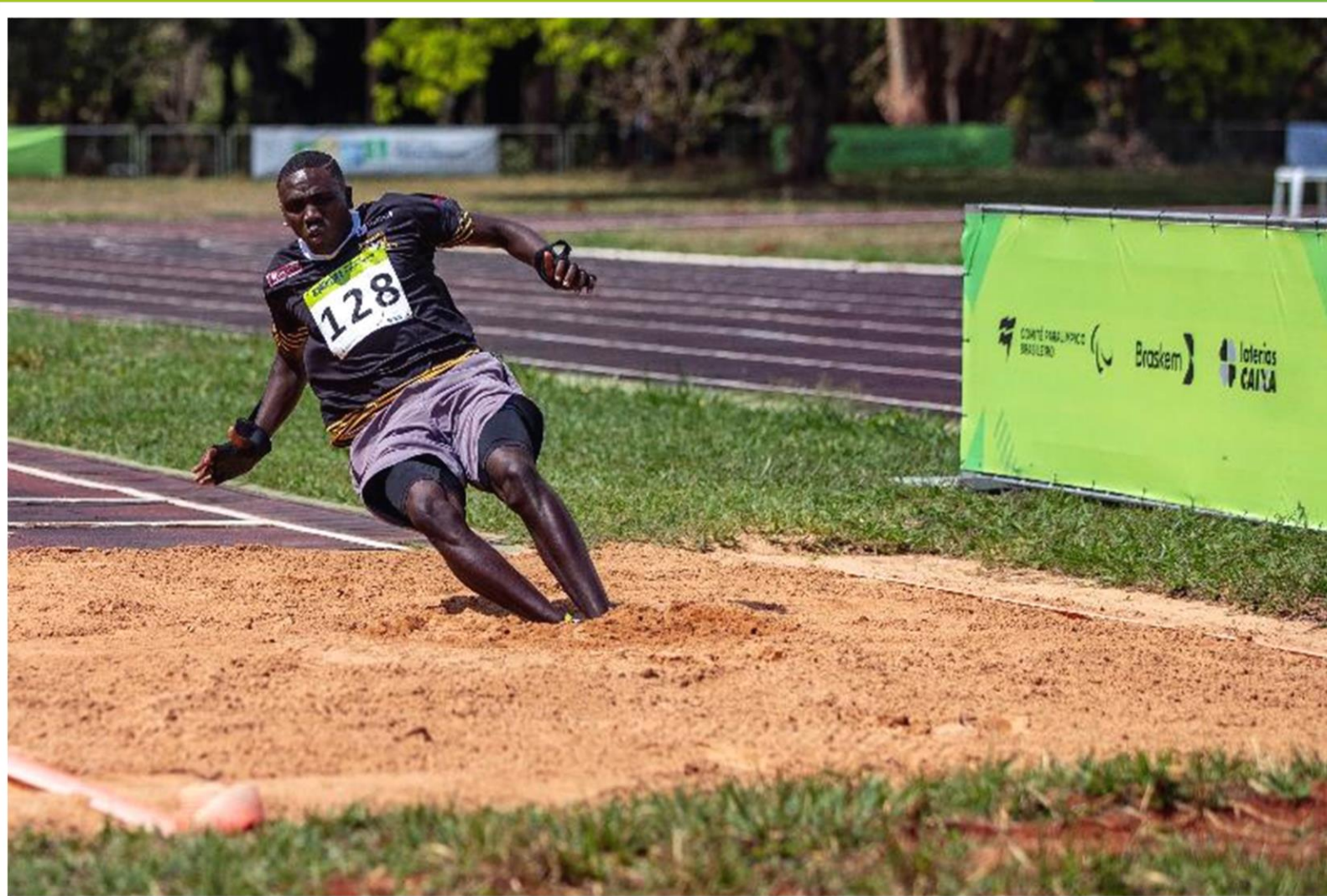
Meeting Paralímpico Loterias Caixa de atletismo em Brasília/ DF.