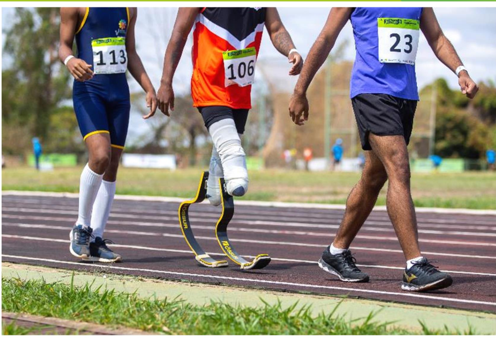
Meeting Paralímpico Loterias Caixa de atletismo em Brasília/ DF.