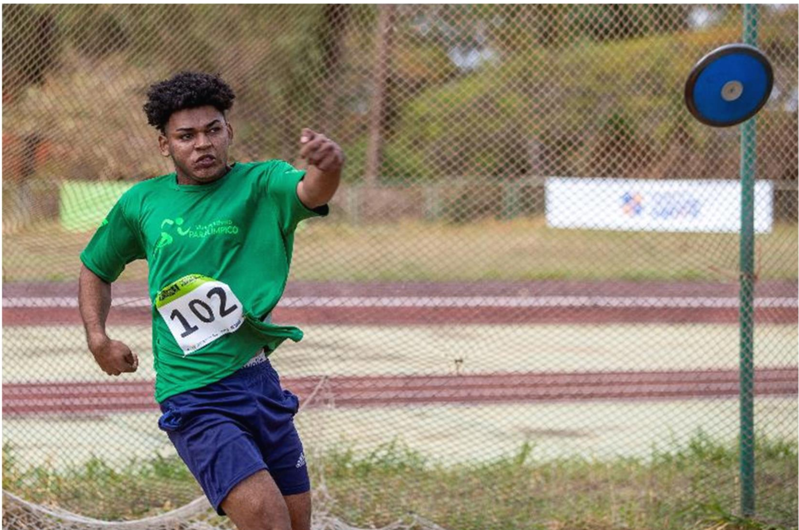
Meeting Paralímpico Loterias Caixa de atletismo em Brasília/ DF.