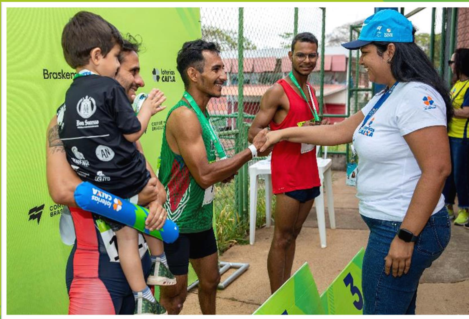
Meeting Paralímpico Loterias Caixa de atletismo em Brasília/ DF.