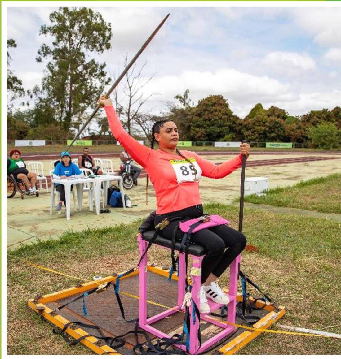
Meeting Paralímpico Loterias Caixa de atletismo em Brasília/ DF.