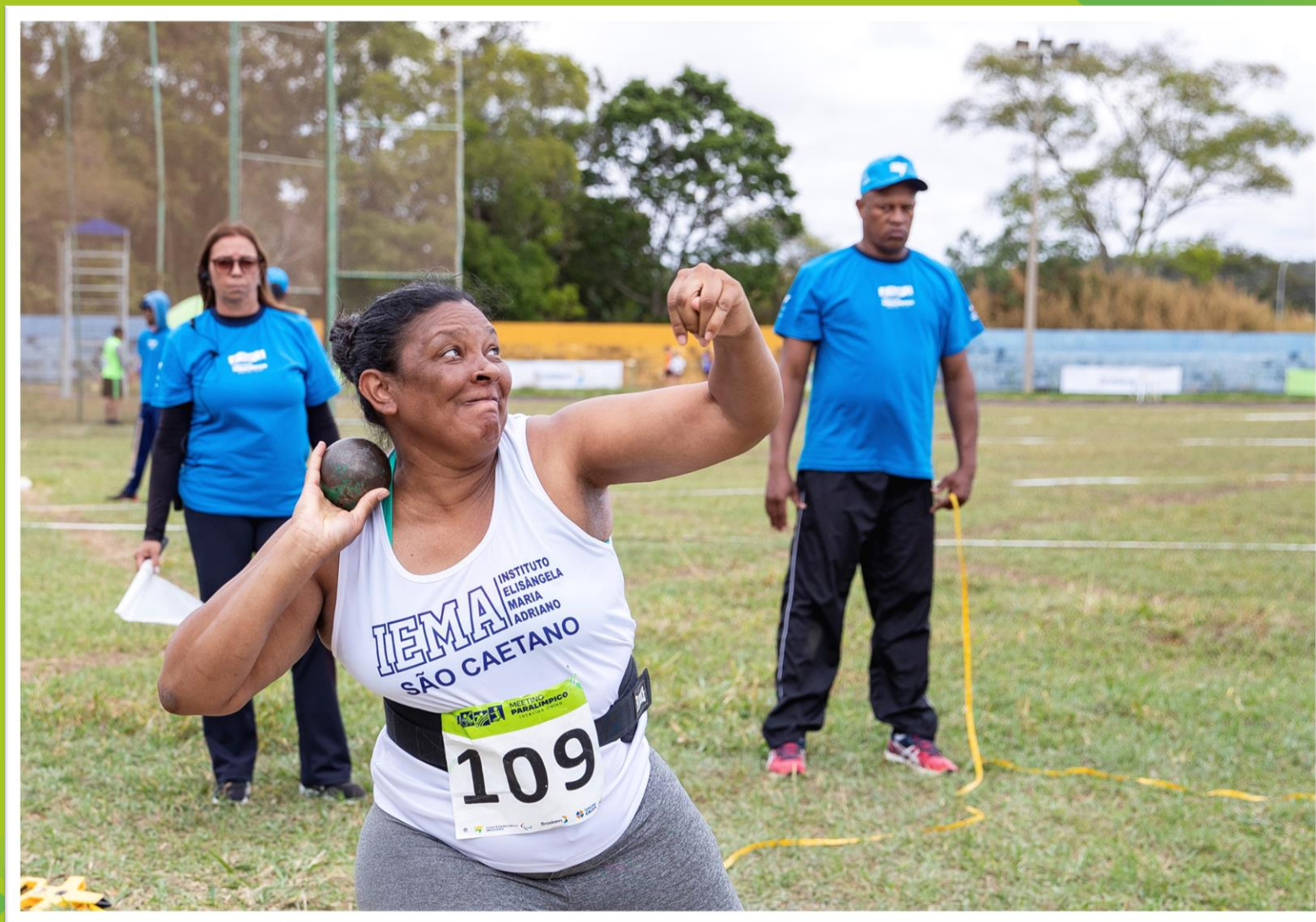
Meeting Paralímpico Loterias Caixa de atletismo em Brasília/ DF.