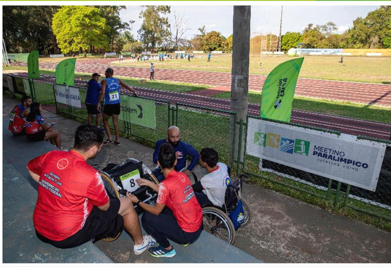
Meeting Paralímpico Loterias Caixa de atletismo em Brasília/ DF.