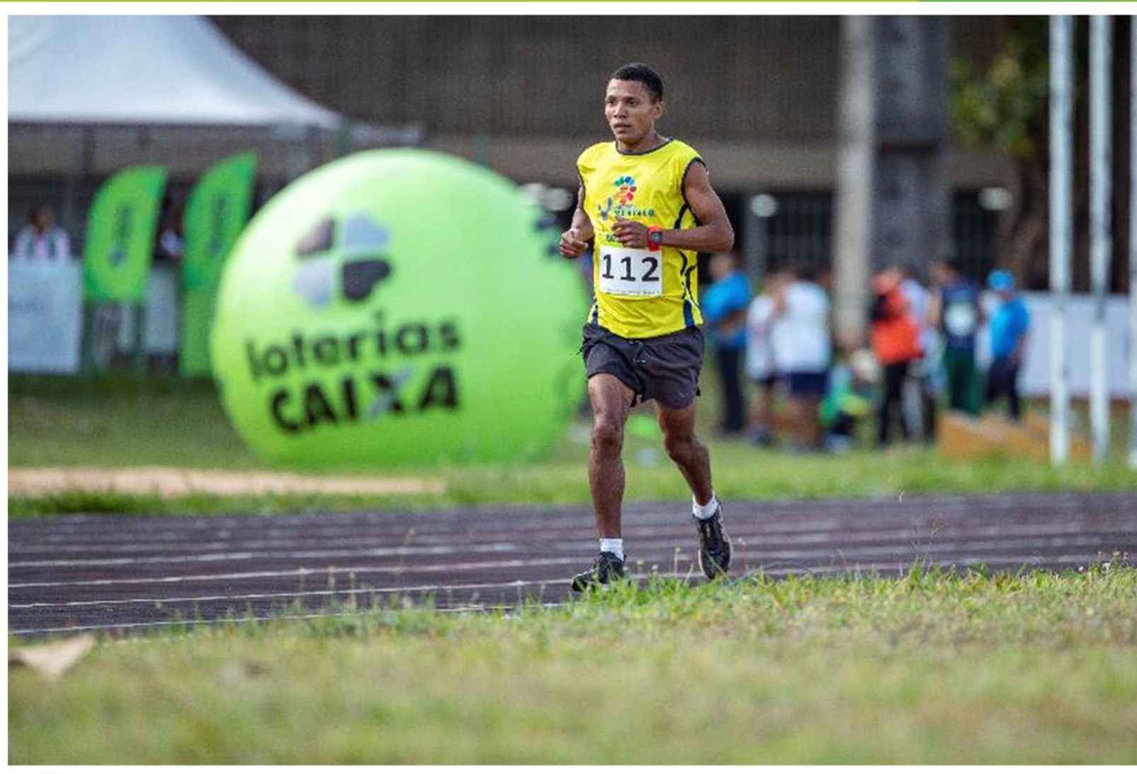
Meeting Paralímpico Loterias Caixa de atletismo em Brasília/ DF.