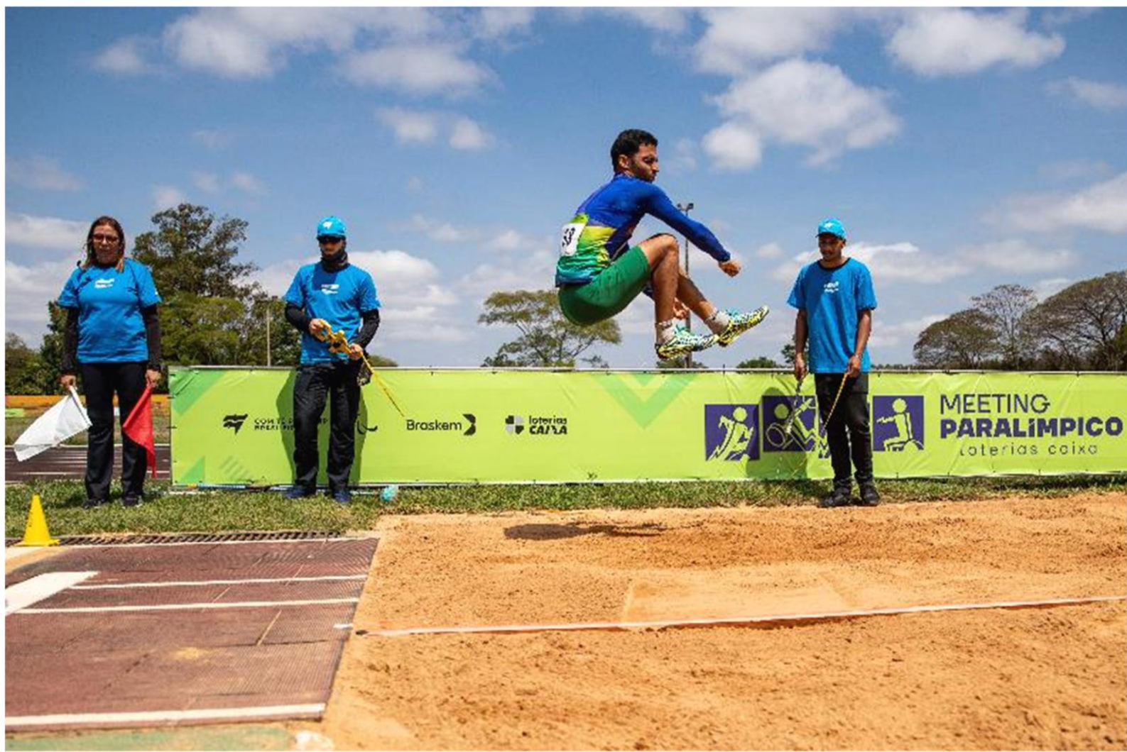
Meeting Paralímpico Loterias Caixa de atletismo em Brasília/ DF.