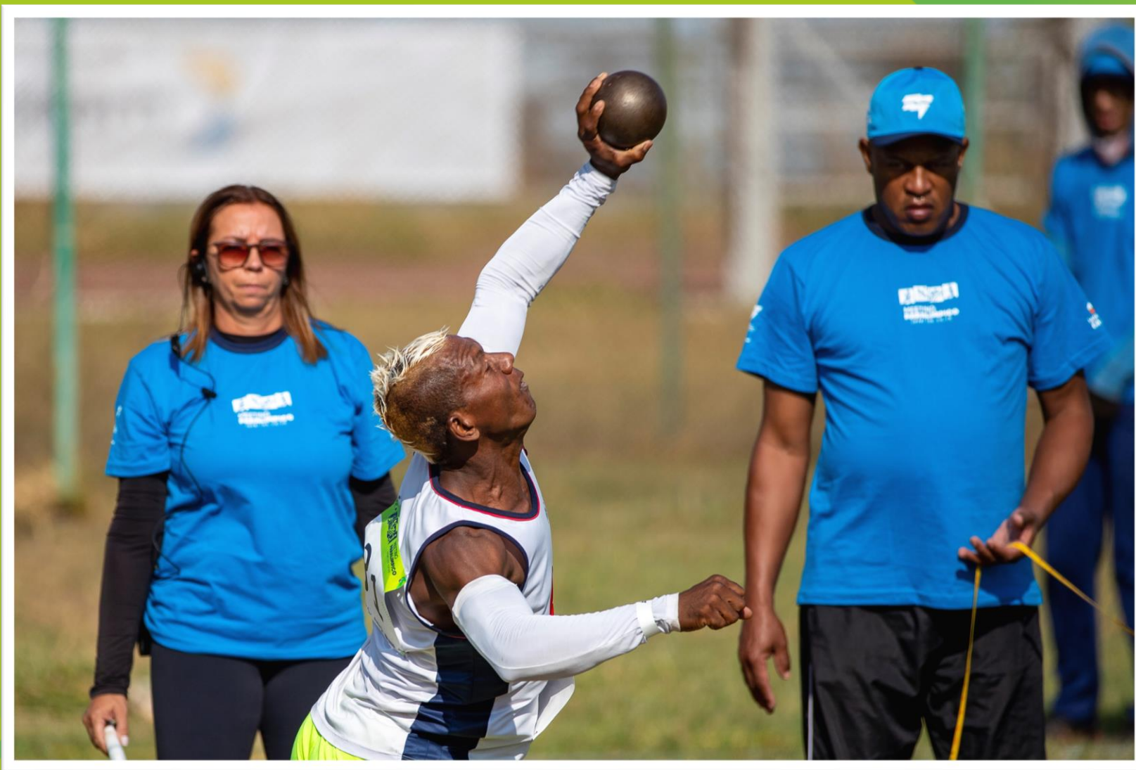
Meeting Paralímpico Loterias Caixa de atletismo em Brasília/ DF.