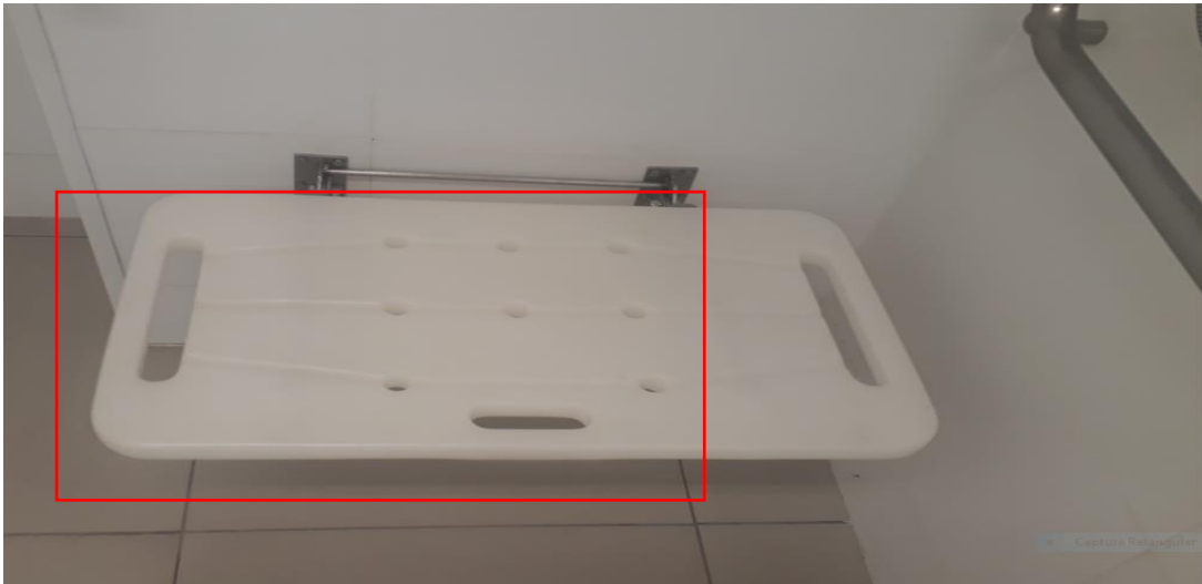
Figura 1 ASSENTO DE BANHO