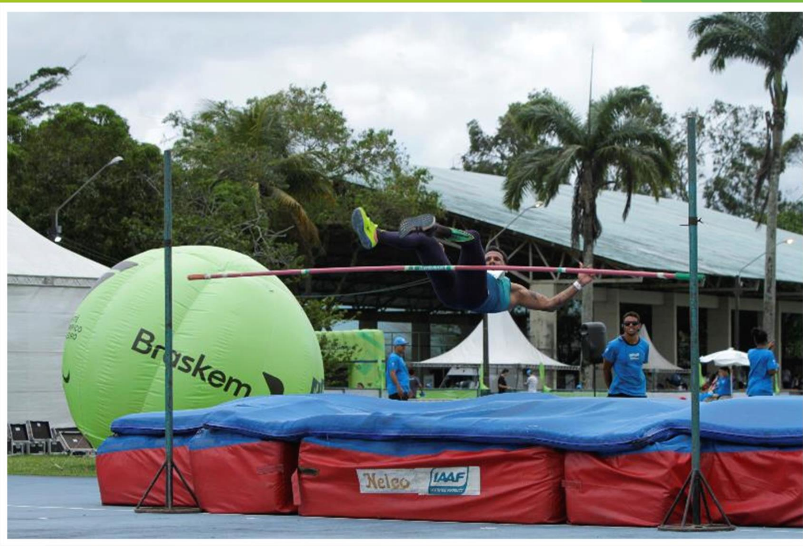
Meeting Paralímpico Loterias Caixa de atletismo de Recife/ PE.