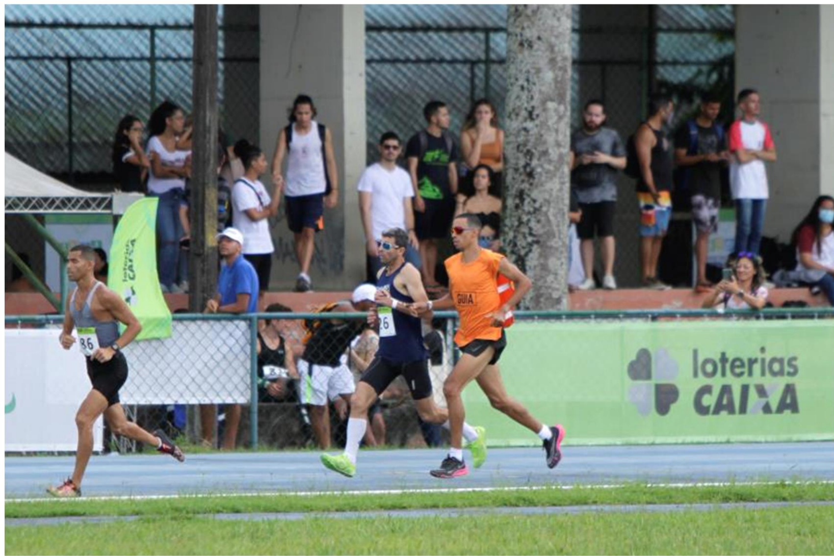
Meeting Paralímpico Loterias Caixa de atletismo de Recife/ PE.