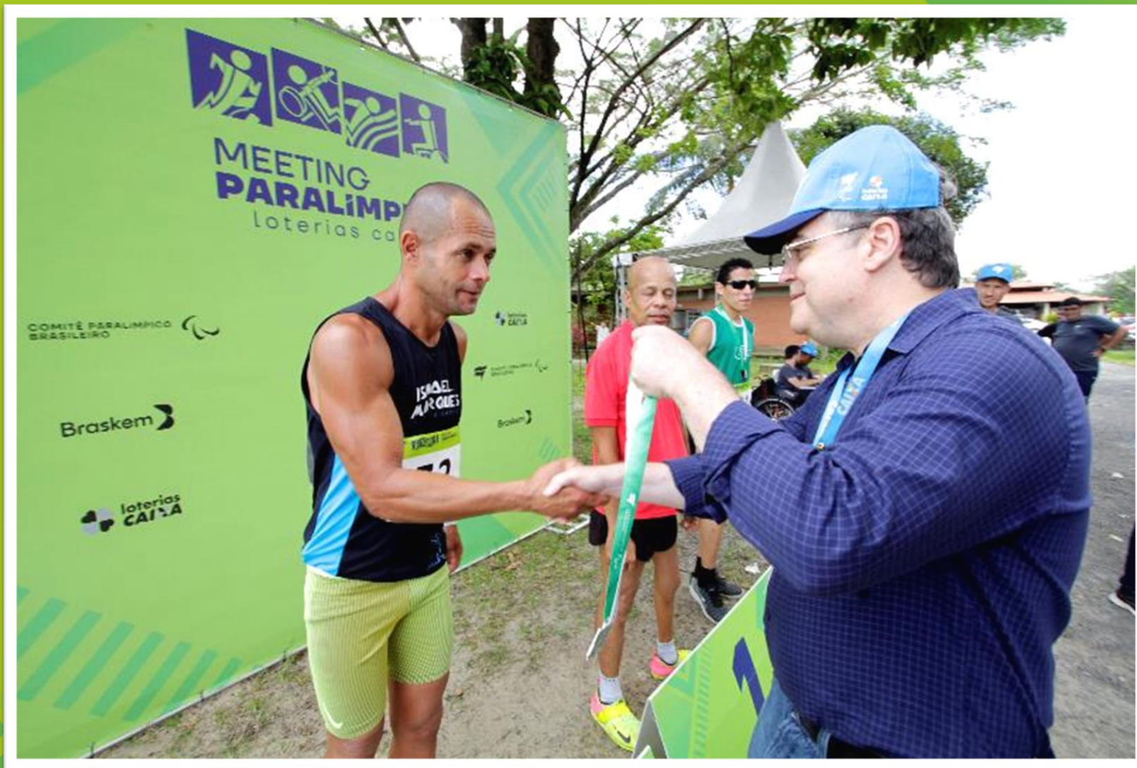
Meeting Paralímpico Loterias Caixa de atletismo de Recife/ PE.