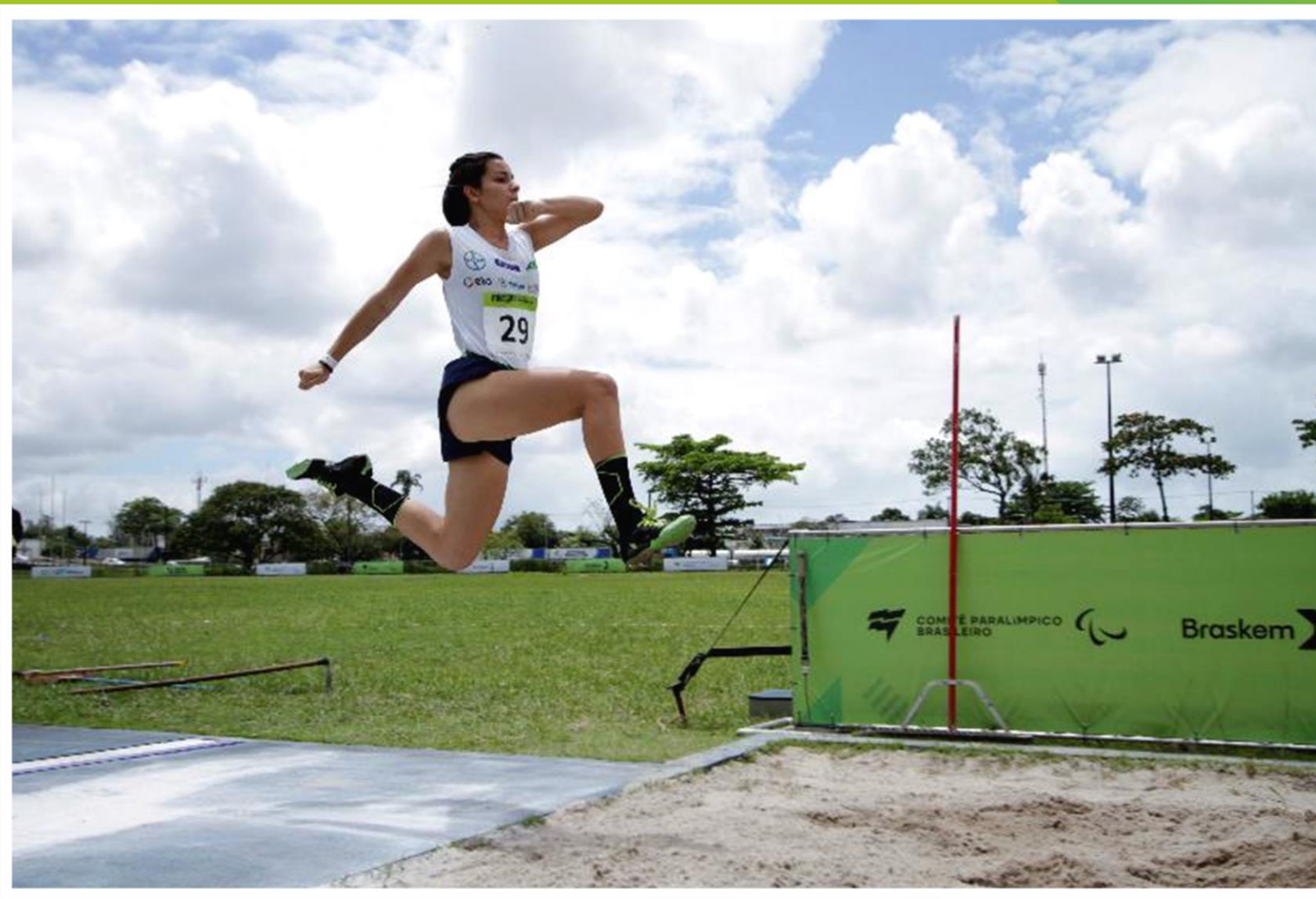
Meeting Paralímpico Loterias Caixa de atletismo de Recife/ PE.