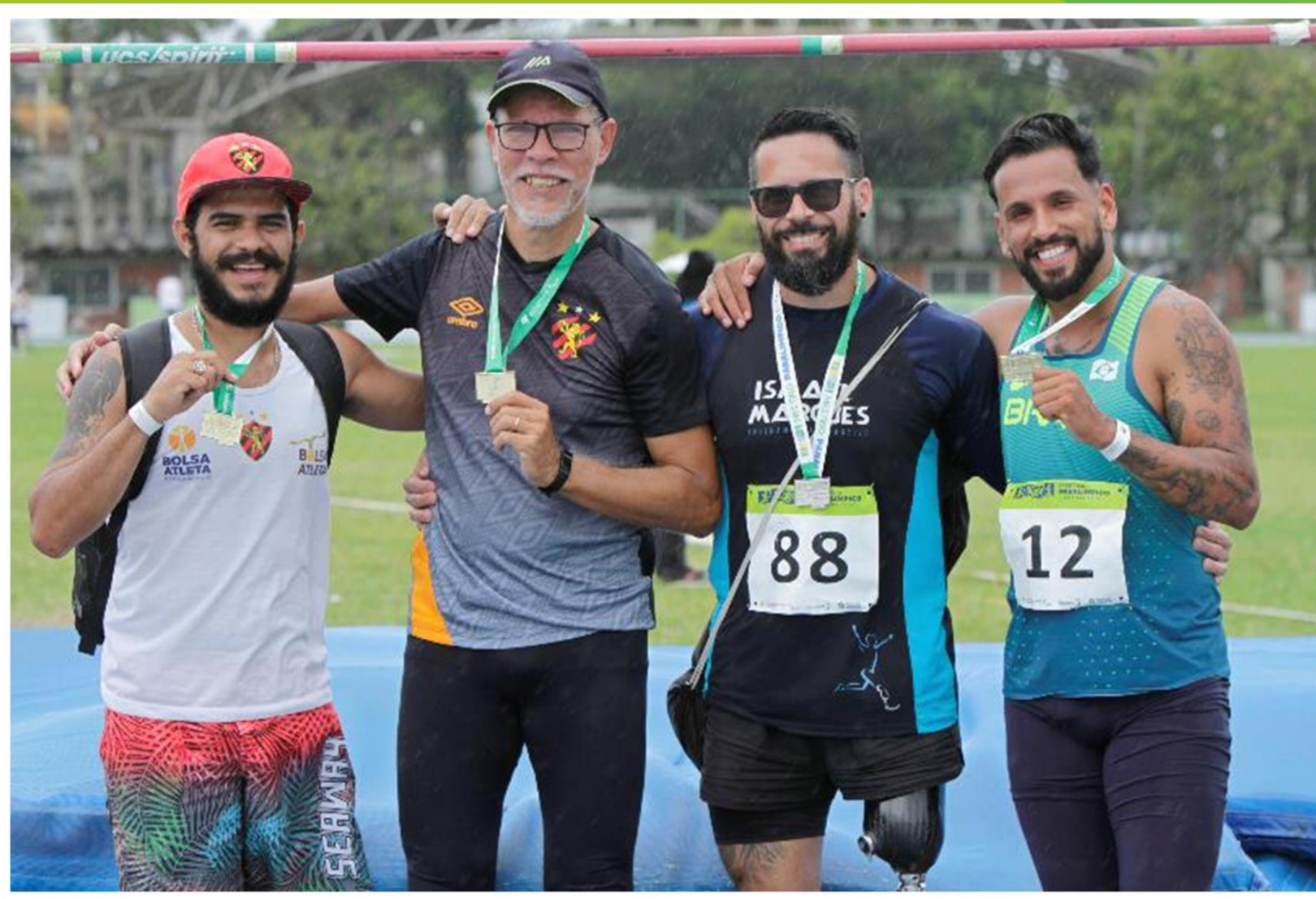
Meeting Paralímpico Loterias Caixa de atletismo de Recife/ PE.