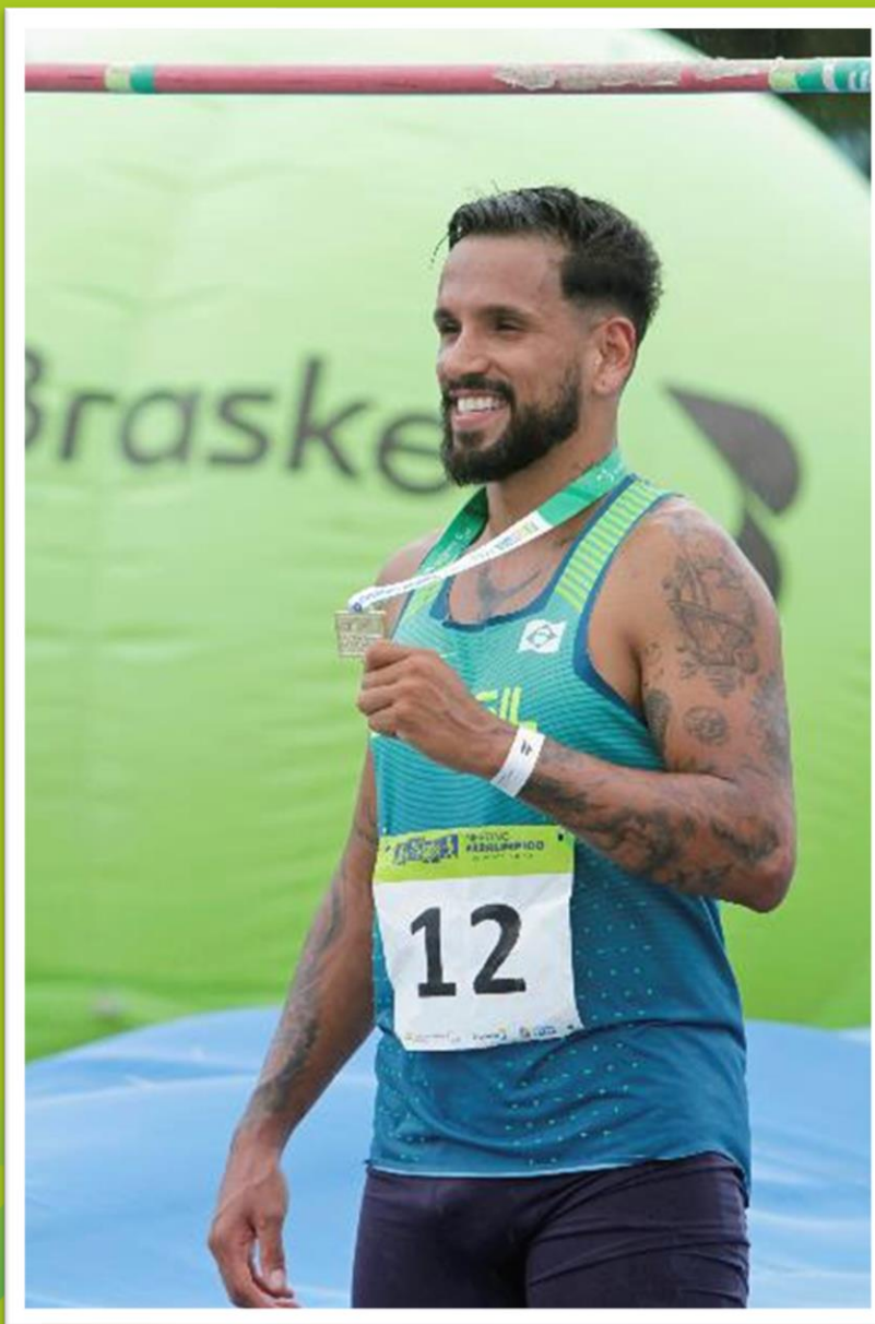
Meeting Paralímpico Loterias Caixa de atletismo de Recife/ PE.