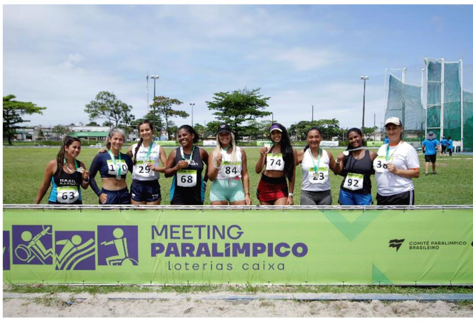
Meeting Paralímpico Loterias Caixa de atletismo de Recife/ PE.