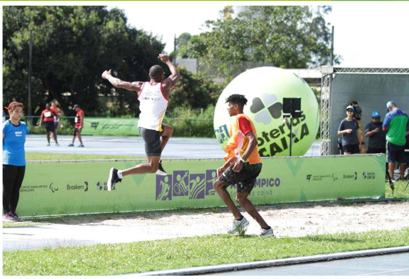
Meeting Paralímpico Loterias Caixa de atletismo de Recife/ PE.