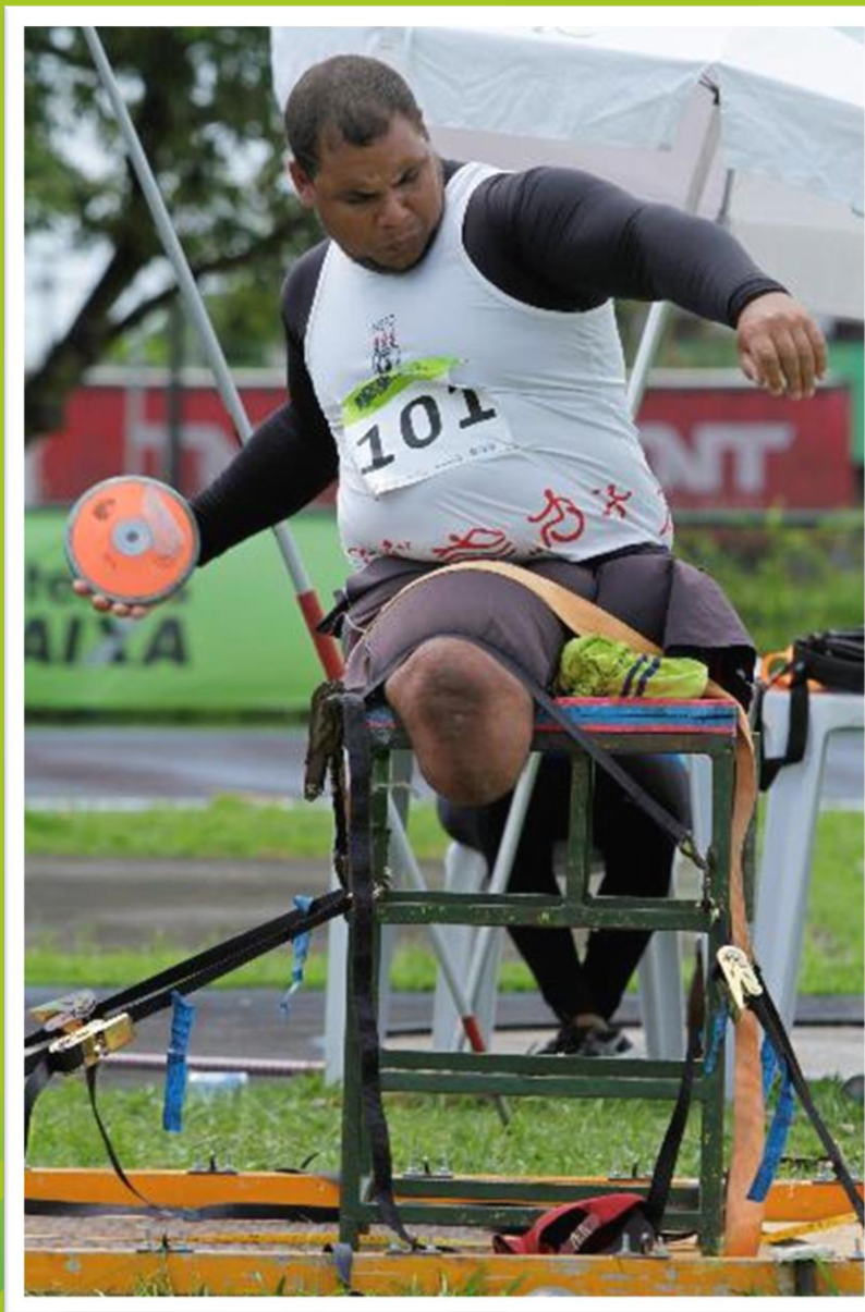
Meeting Paralímpico Loterias Caixa de atletismo de Recife/ PE.