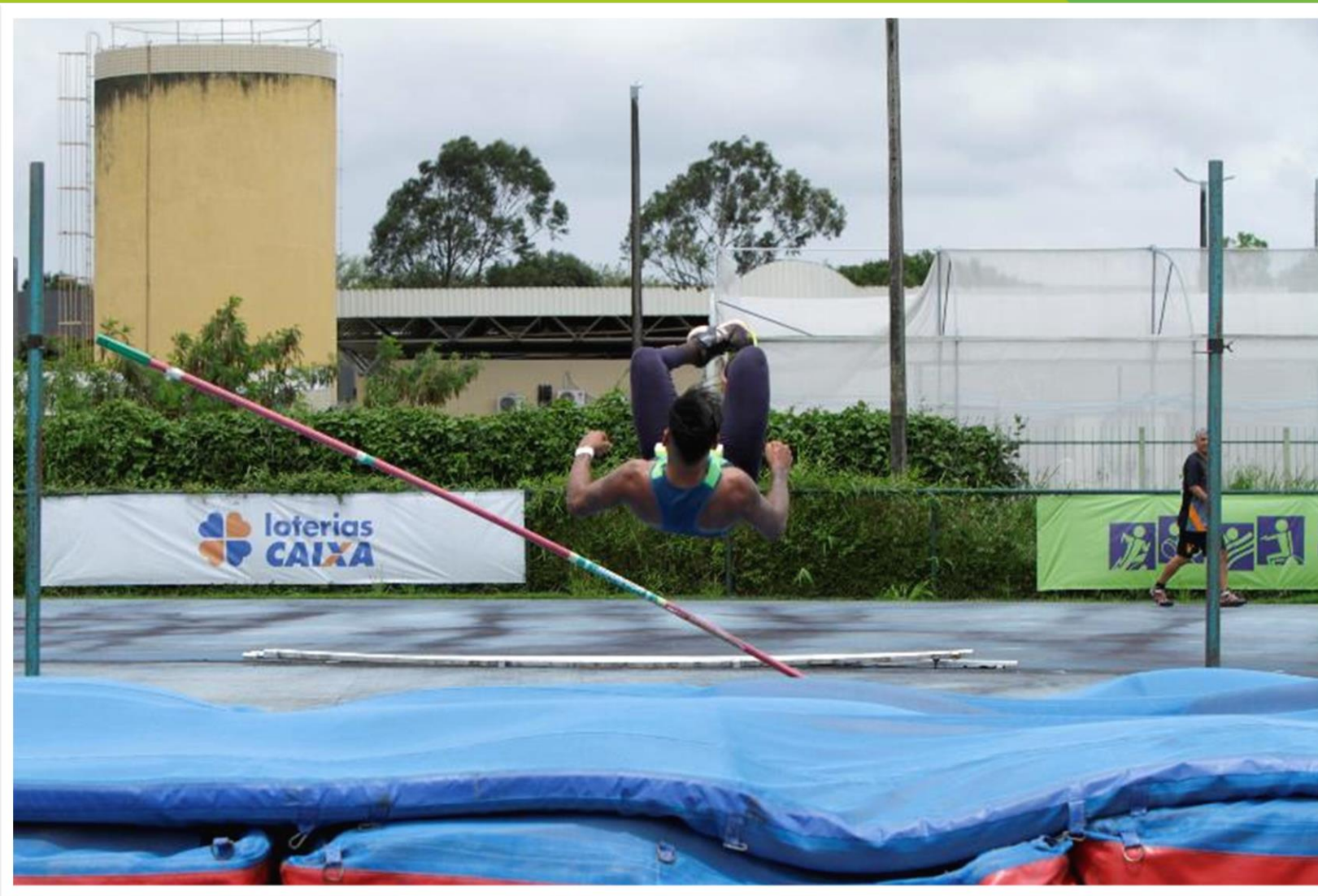
Meeting Paralímpico Loterias Caixa de atletismo de Recife/ PE.