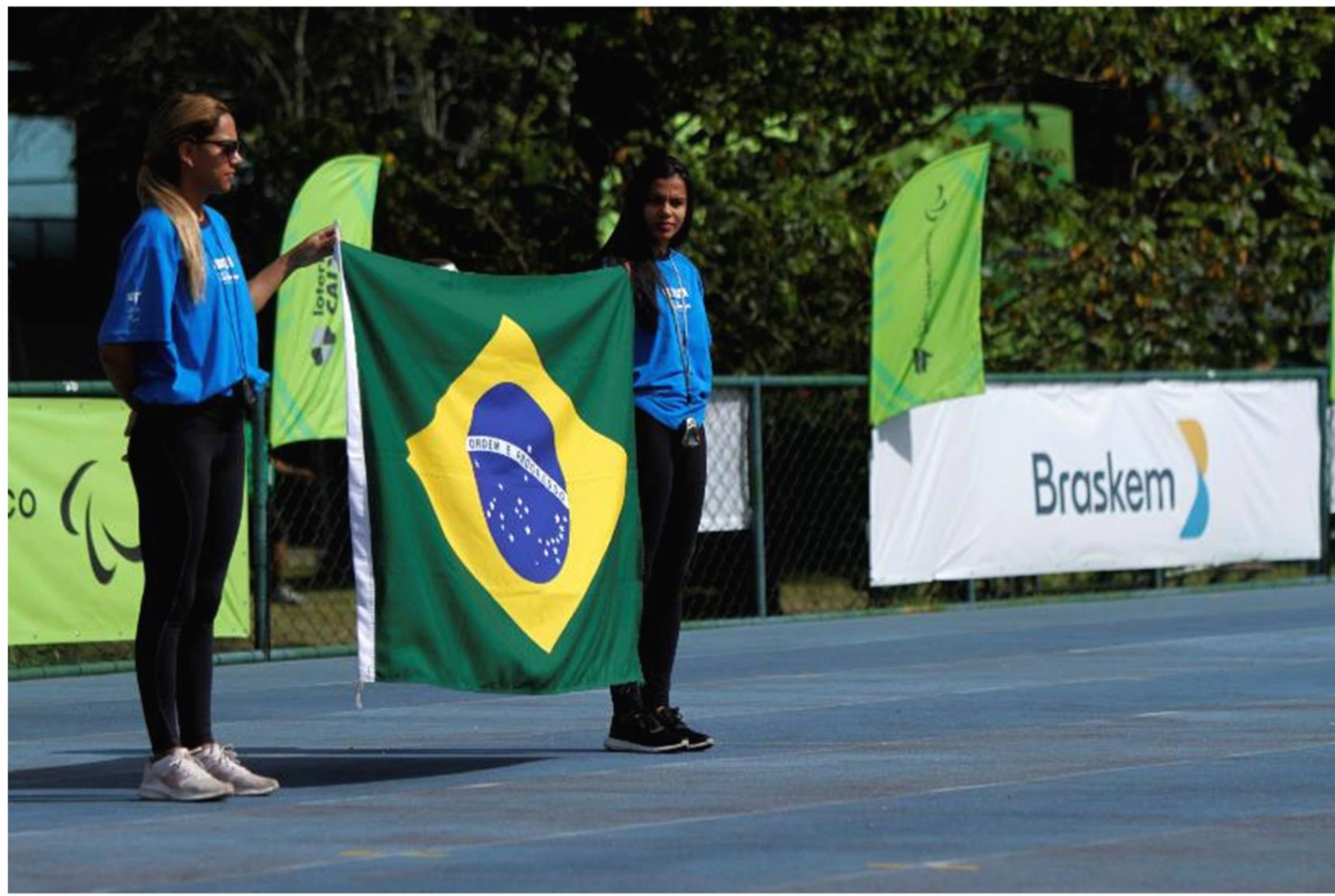
Meeting Paralímpico Loterias Caixa de atletismo de Recife/ PE.