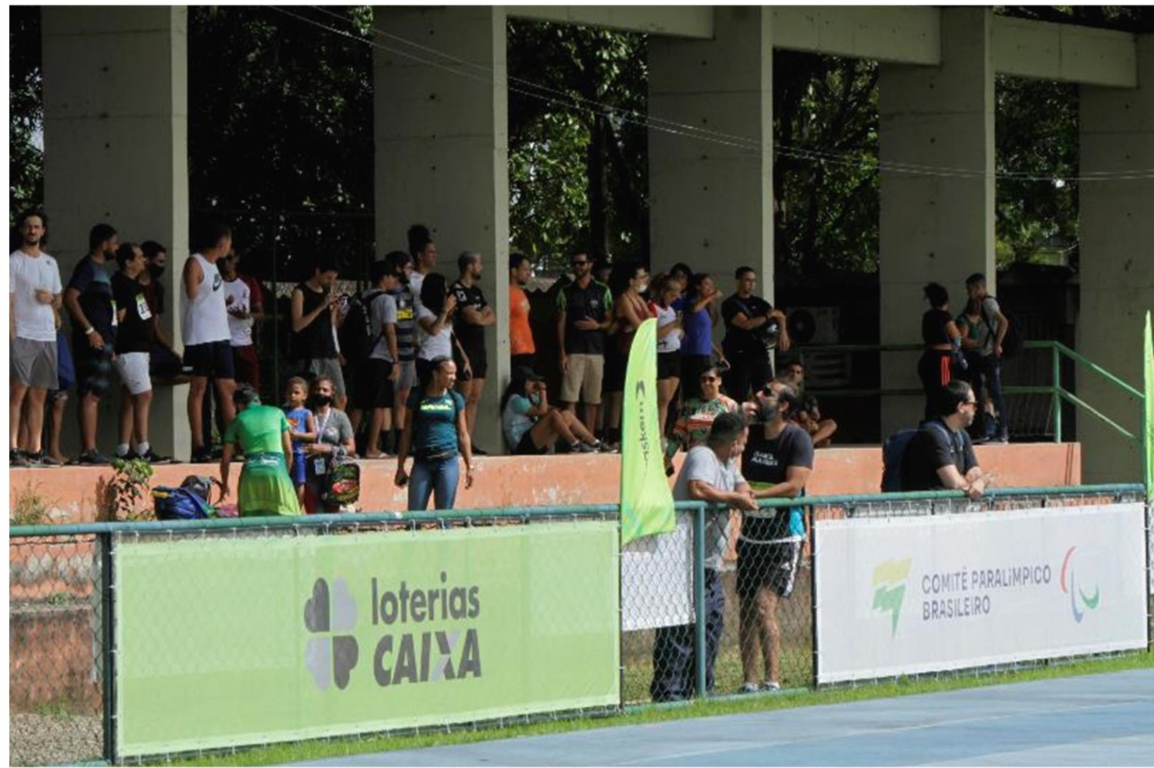
Meeting Paralímpico Loterias Caixa de atletismo de Recife/ PE.