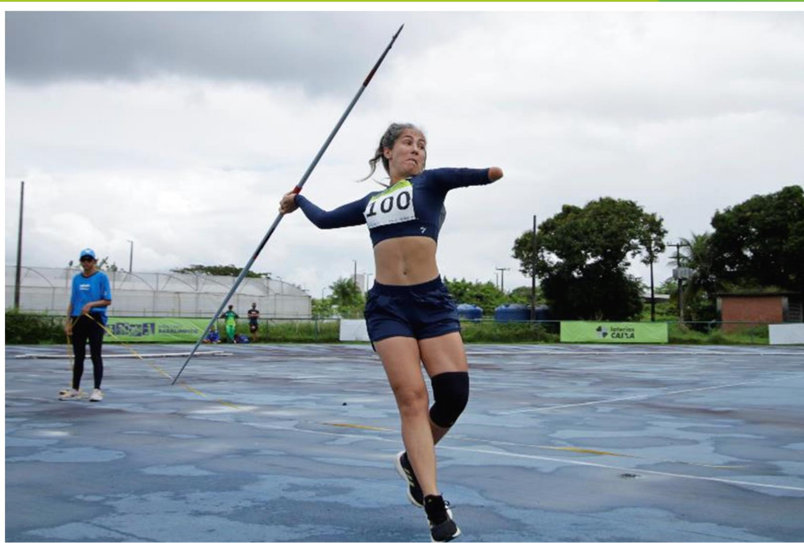
Meeting Paralímpico Loterias Caixa de atletismo de Recife/ PE.