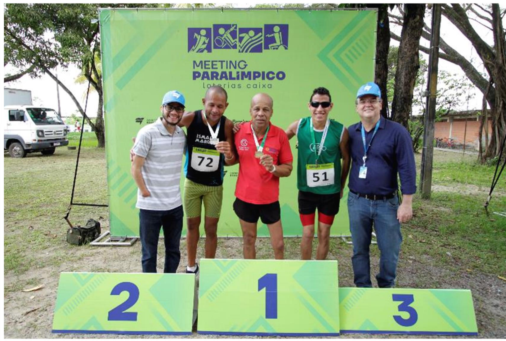
Meeting Paralímpico Loterias Caixa de atletismo de Recife/ PE.