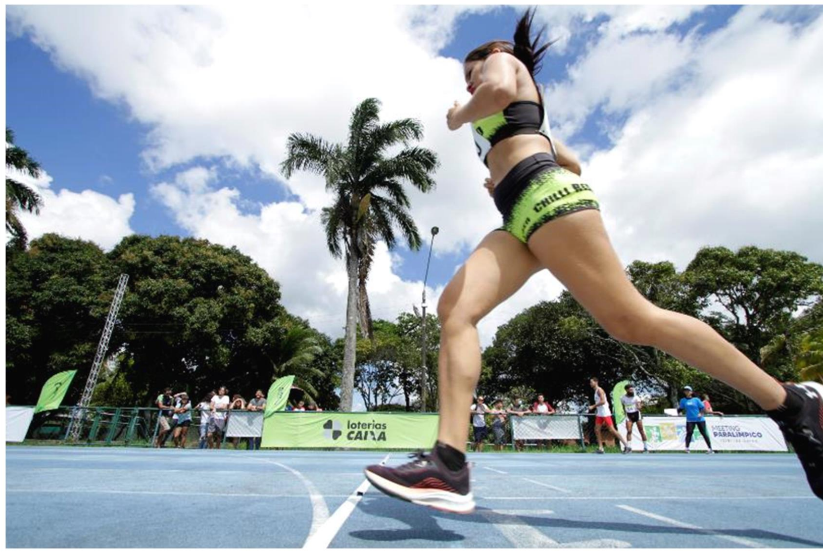
Meeting Paralímpico Loterias Caixa de atletismo de Recife/ PE.