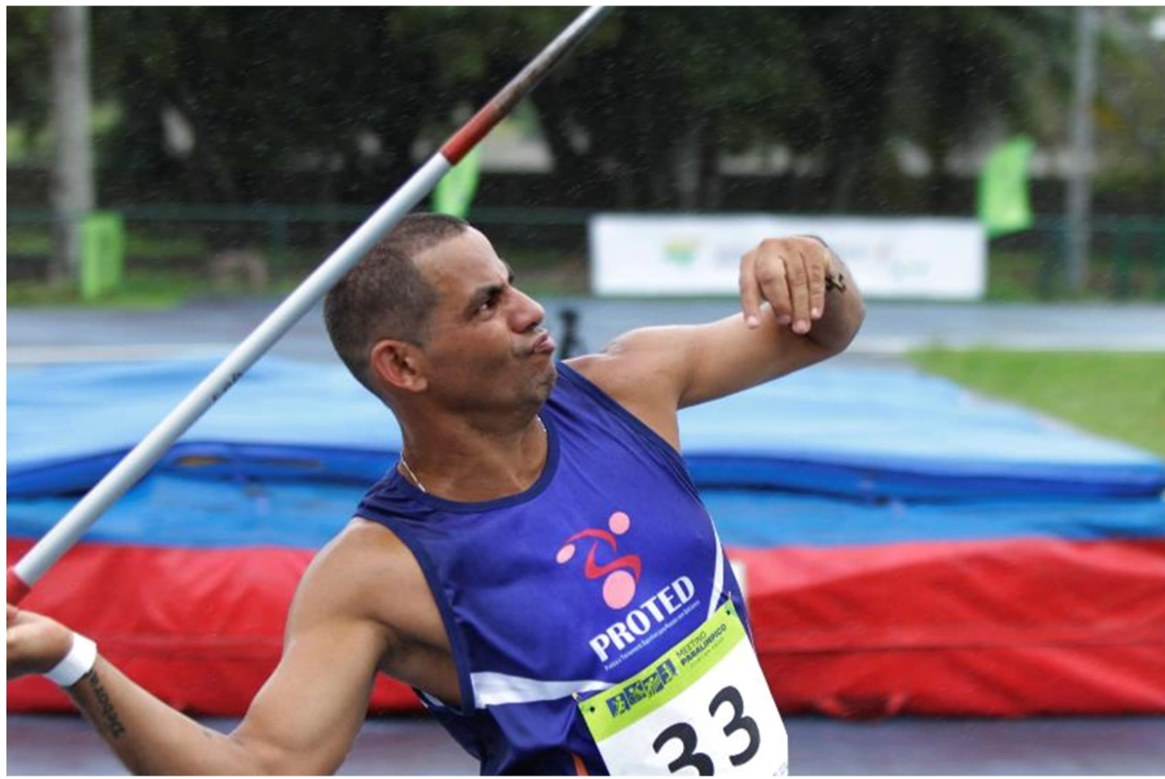
Meeting Paralímpico Loterias Caixa de atletismo de Recife/ PE.