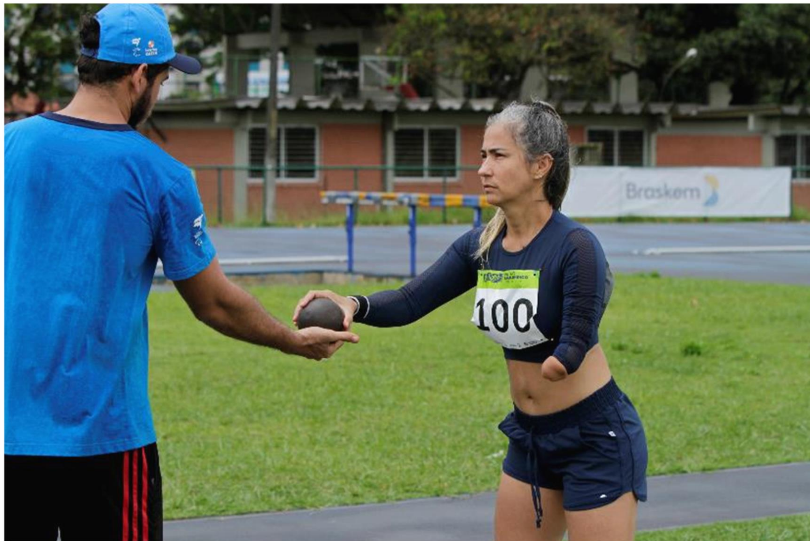
Meeting Paralímpico Loterias Caixa de atletismo de Recife/ PE.