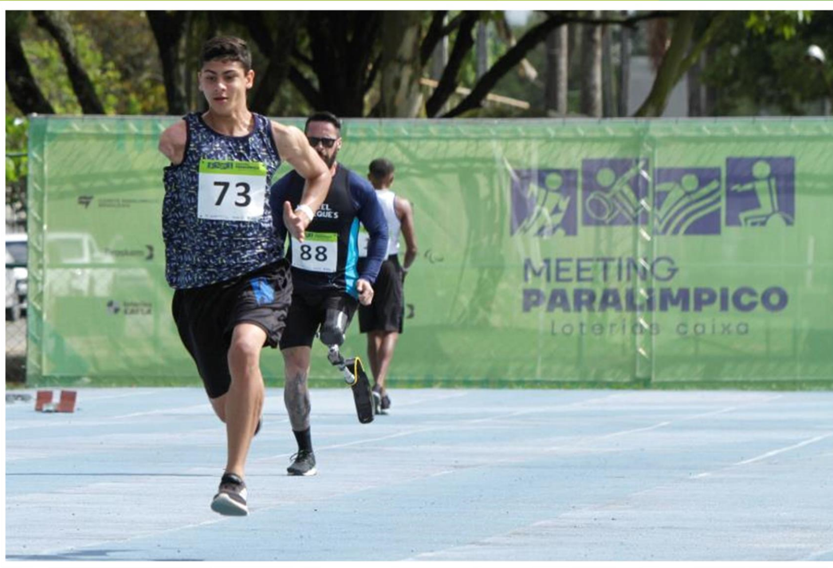
Meeting Paralímpico Loterias Caixa de atletismo de Recife/ PE.