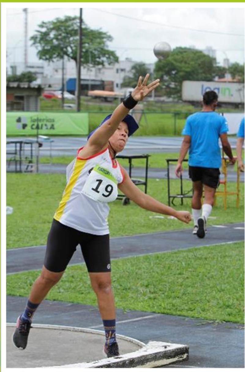
Meeting Paralímpico Loterias Caixa de atletismo de Recife/ PE.