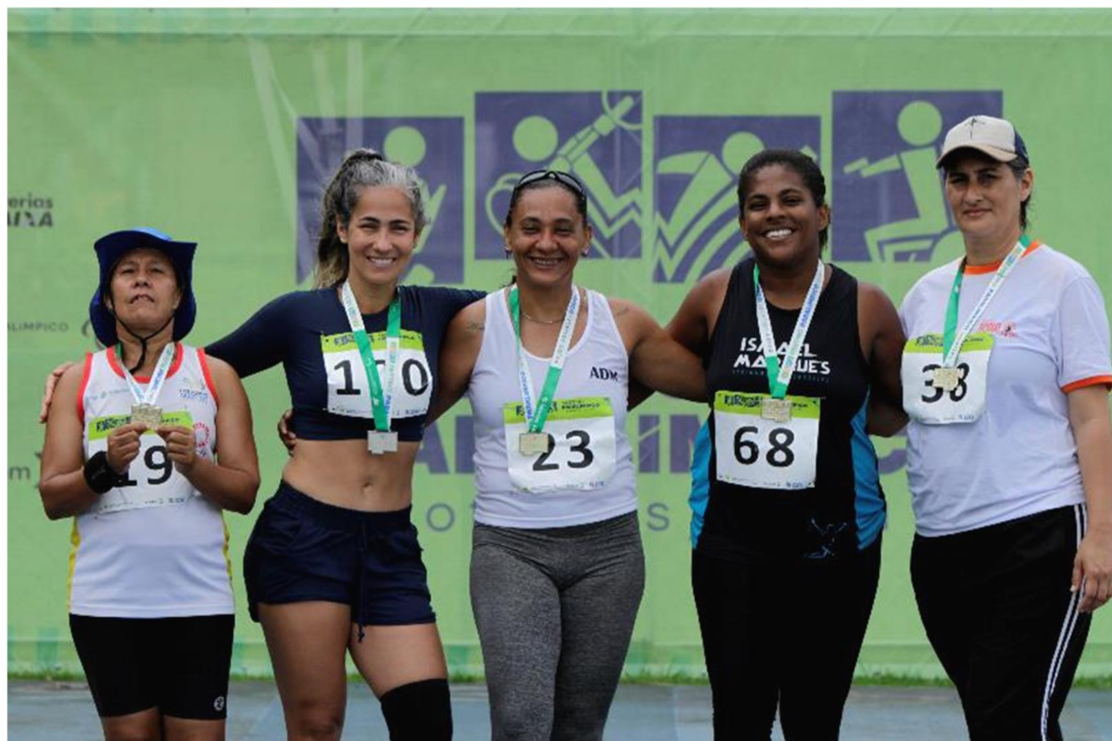
Meeting Paralímpico Loterias Caixa de atletismo de Recife/ PE.