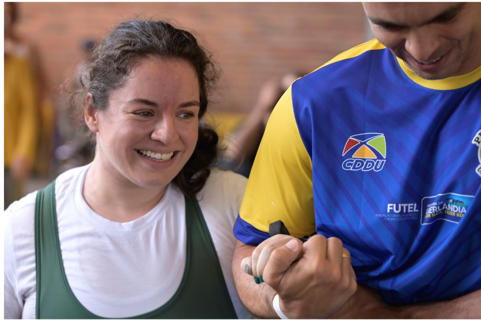
Meeting Paralímpico Loterias Caixa, halterofilismo em Belo Horizonte/MG.