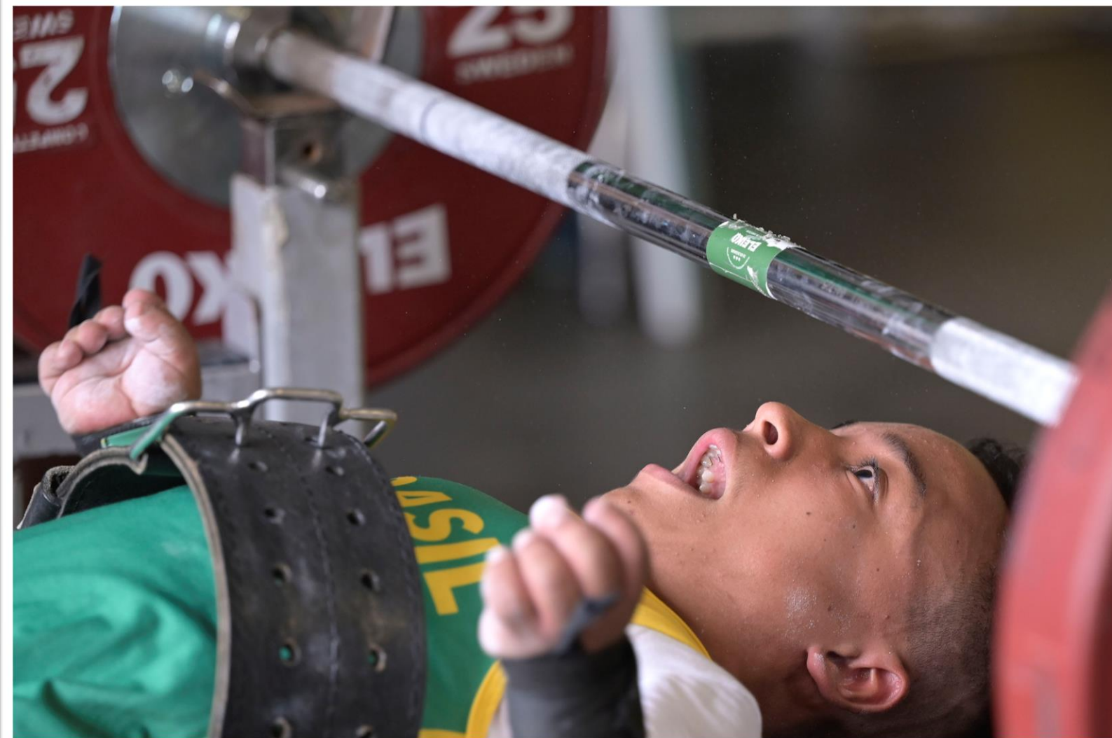
Meeting Paralímpico Loterias Caixa, halterofilismo em Belo Horizonte/MG.