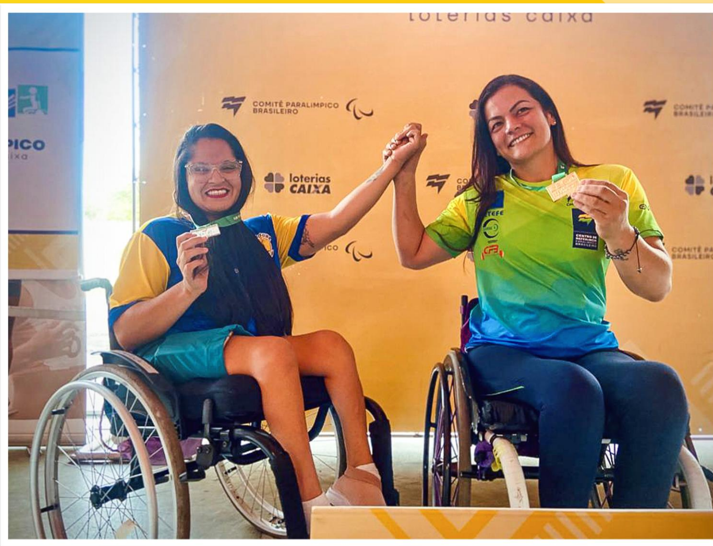
Meeting Paralímpico Loterias Caixa, halterofilismo em Belo Horizonte/MG.