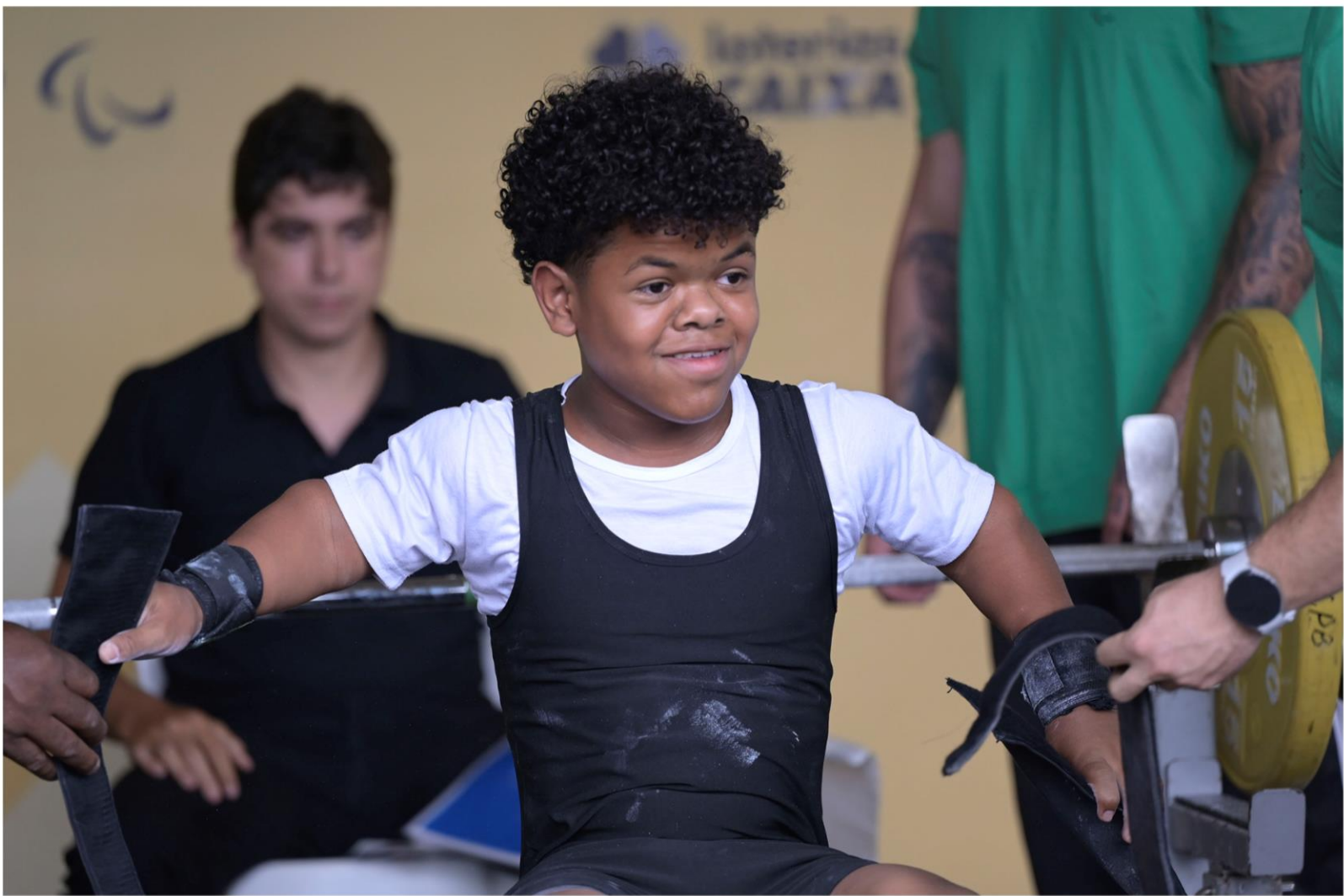
Meeting Paralímpico Loterias Caixa, halterofilismo em Belo Horizonte/MG.