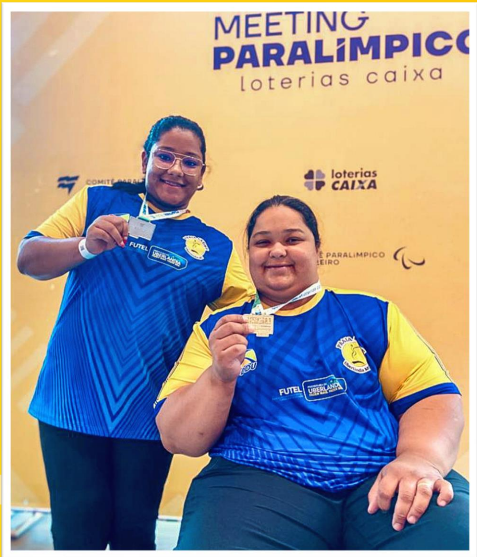
Meeting Paralímpico Loterias Caixa, halterofilismo em Belo Horizonte/MG.