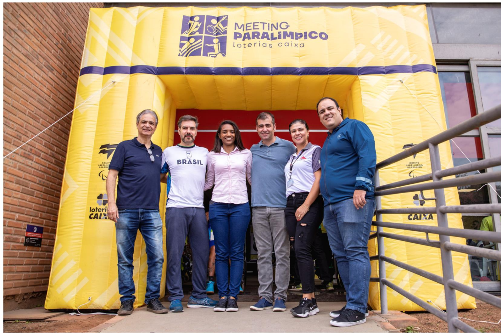
Meeting Paralímpico Loterias Caixa, halterofilismo em Belo Horizonte/MG.