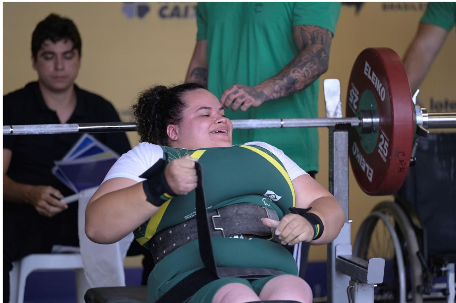
Meeting Paralímpico Loterias Caixa, halterofilismo em Belo Horizonte/MG.