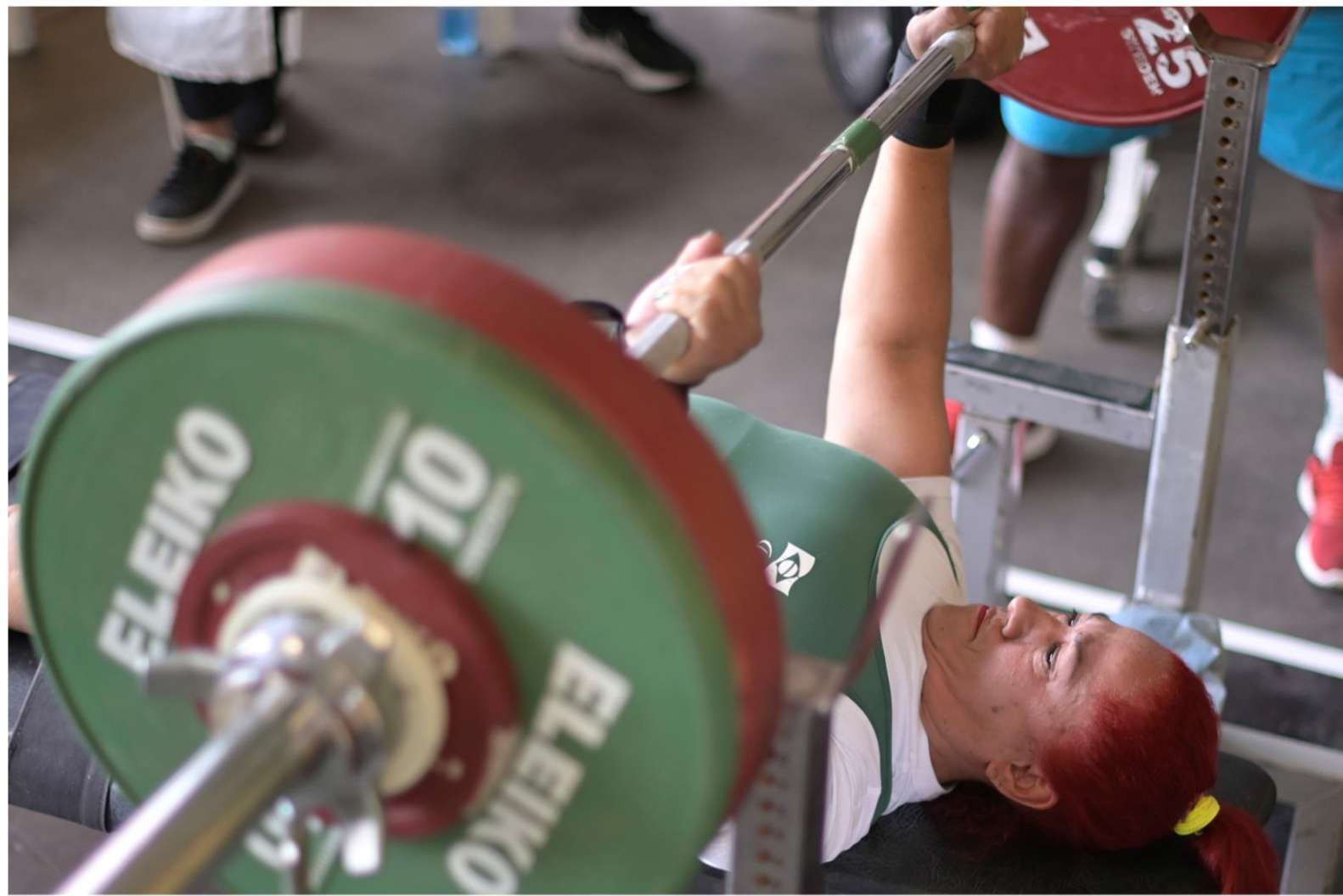
Meeting Paralímpico Loterias Caixa, halterofilismo em Belo Horizonte/MG.