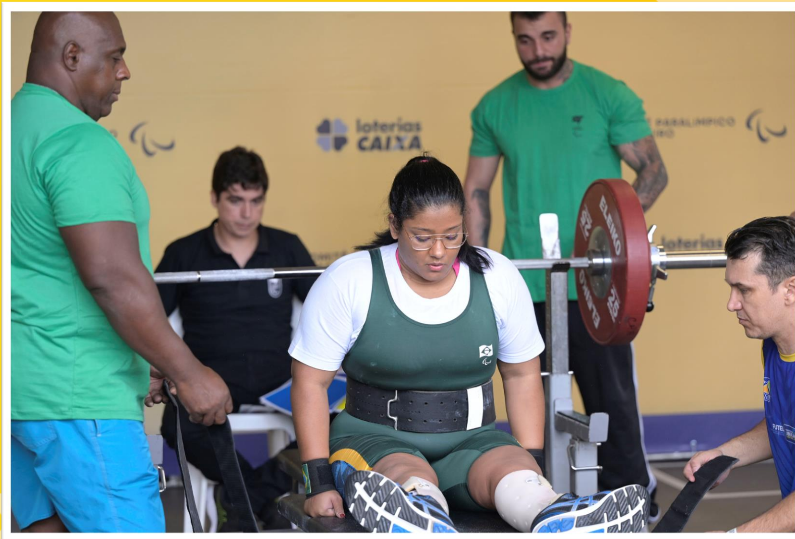
Meeting Paralímpico Loterias Caixa, halterofilismo em Belo Horizonte/MG.