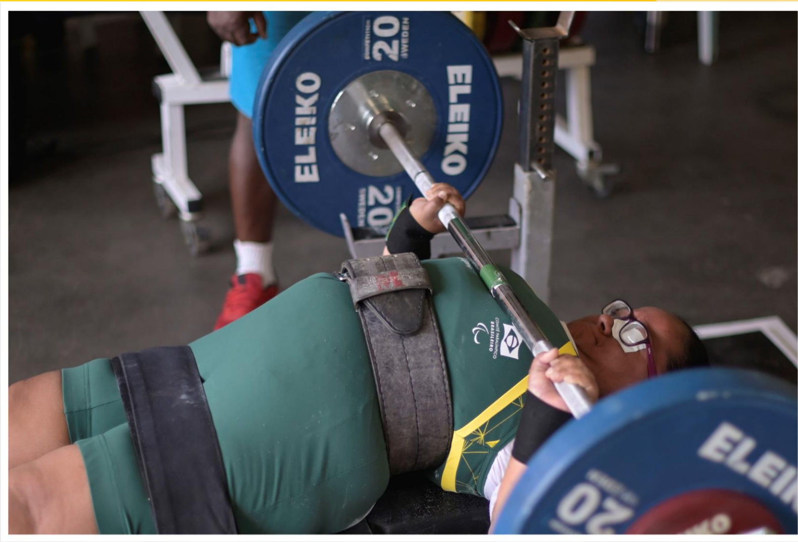
Meeting Paralímpico Loterias Caixa, halterofilismo em Belo Horizonte/MG.