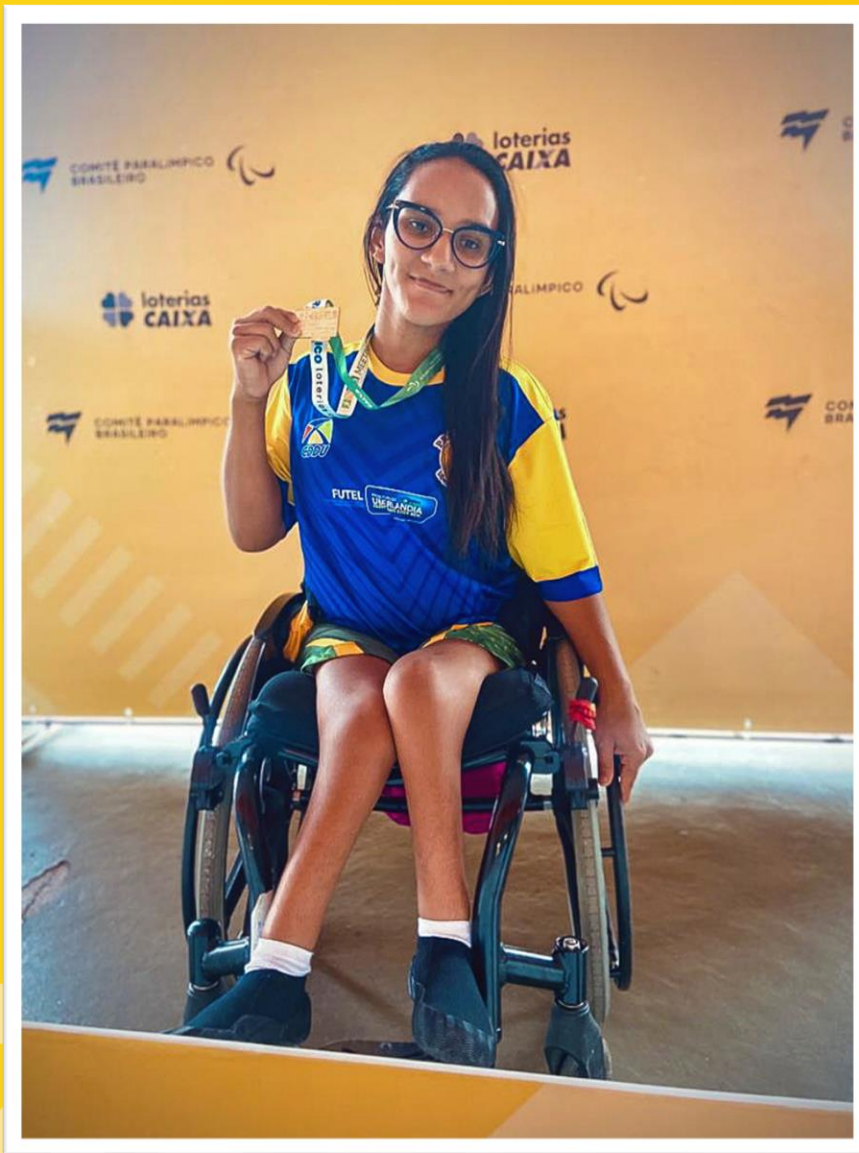
Meeting Paralímpico Loterias Caixa, halterofilismo em Belo Horizonte/MG.