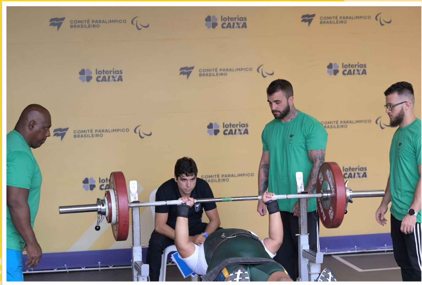
Meeting Paralímpico Loterias Caixa, halterofilismo em Belo Horizonte/MG.