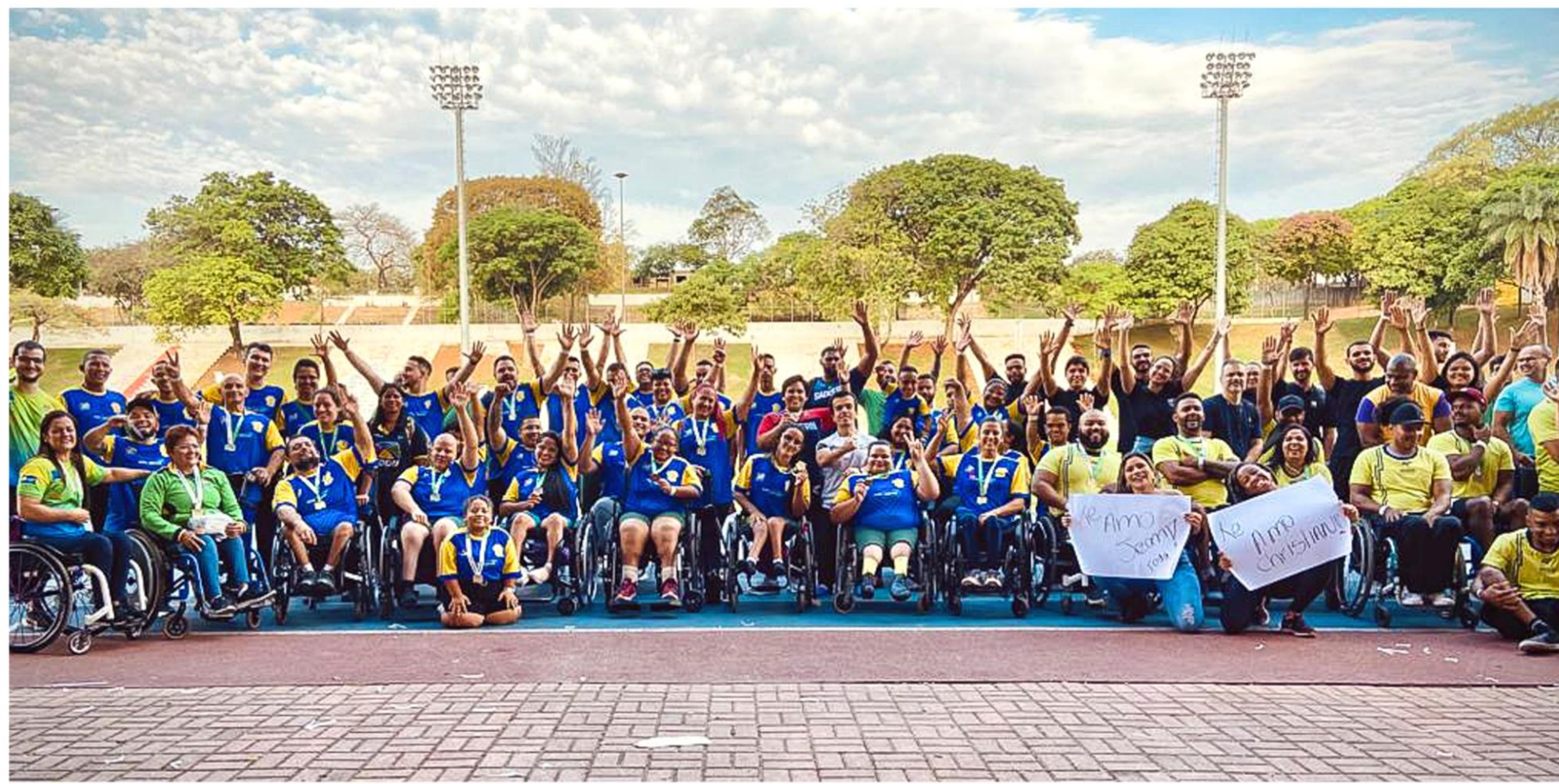
Meeting Paralímpico Loterias Caixa, halterofilismo em Belo Horizonte/MG.