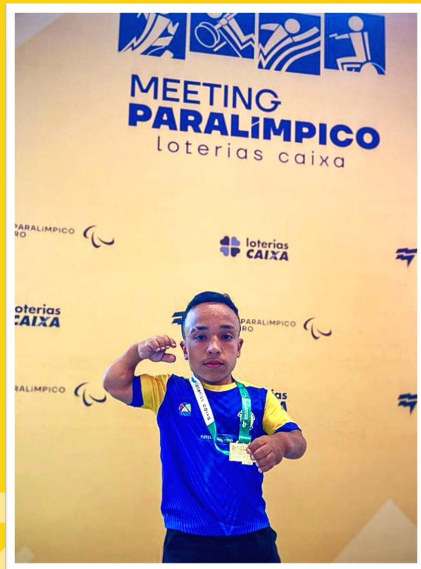
Meeting Paralímpico Loterias Caixa, halterofilismo em Belo Horizonte/MG.