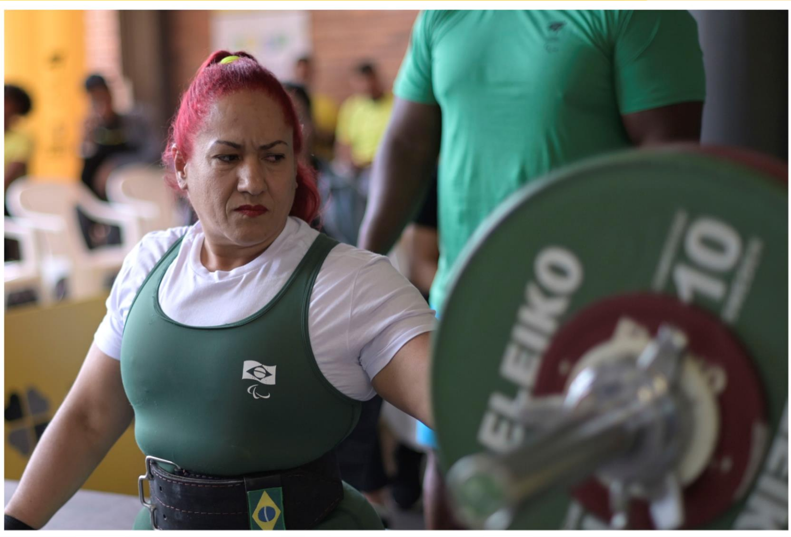
Meeting Paralímpico Loterias Caixa, halterofilismo em Belo Horizonte/MG.