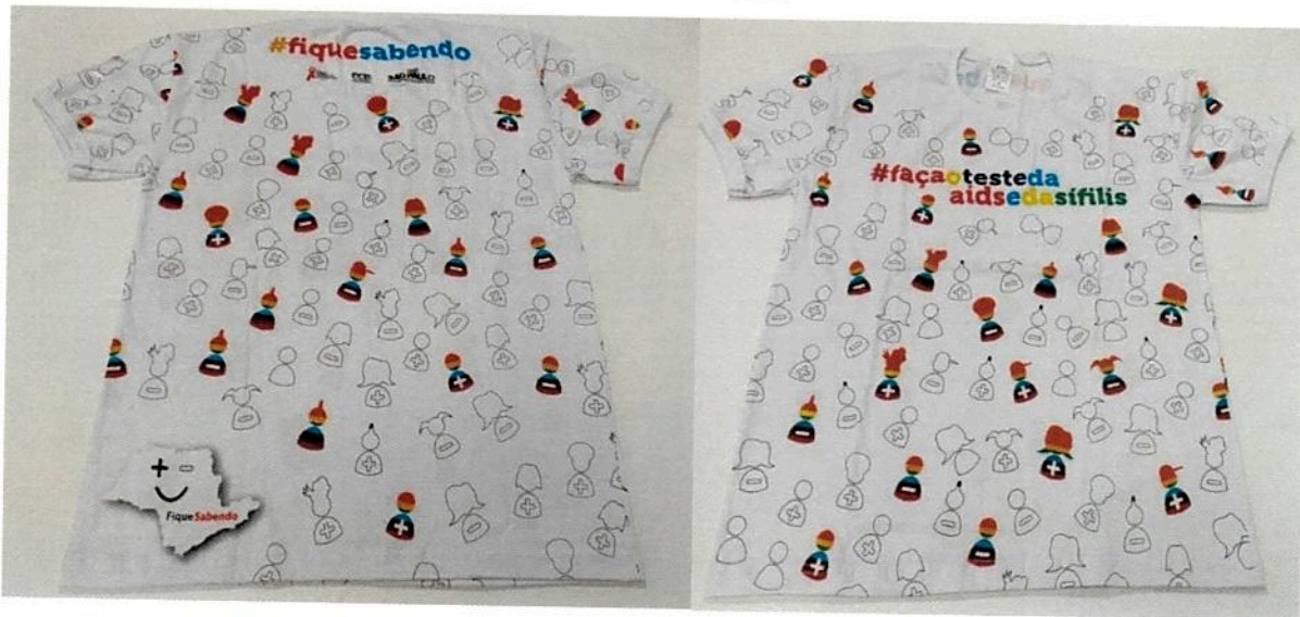
LOTE 02 - ITEM 02