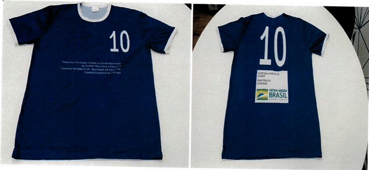
LOTE 02 - ITEM 01